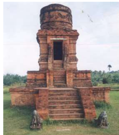
Gambar 7. Candi Biaro Bahal