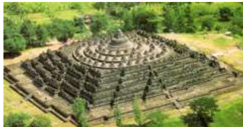
Gambar 5. Candi Borobudur