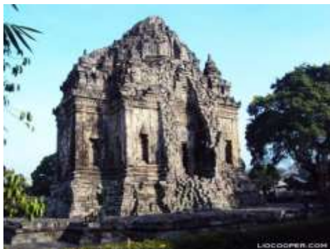
Gambar 1. Candi Kalasan