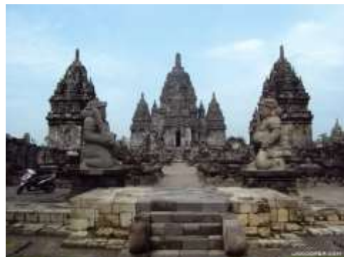
Gambar 2. Candi Sewu