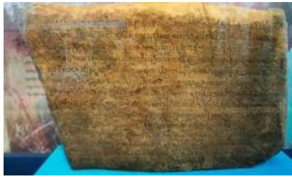
Gambar 9. Prasasti Talang Tuo