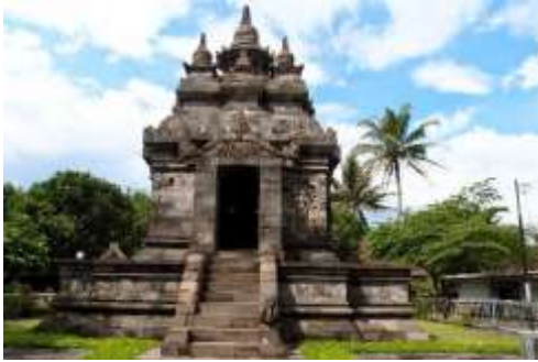
Gambar 3. Candi Pawon