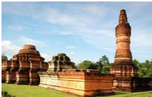
Gambar 6. Candi Muara Takus