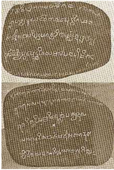
Gambar 8. Prasasti Kedukan Bukit