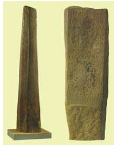
Gambar 11. Prasasti Kota kapur