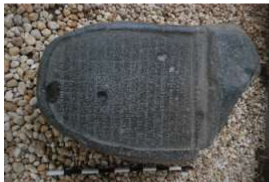
Gambar 12. Prasasti Karang Berahi