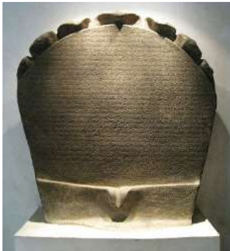
Gambar 10. Prasasti Telaga Batu