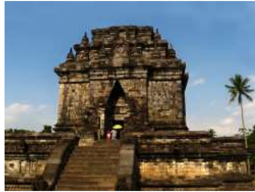
Gambar 4. Candi Mendut