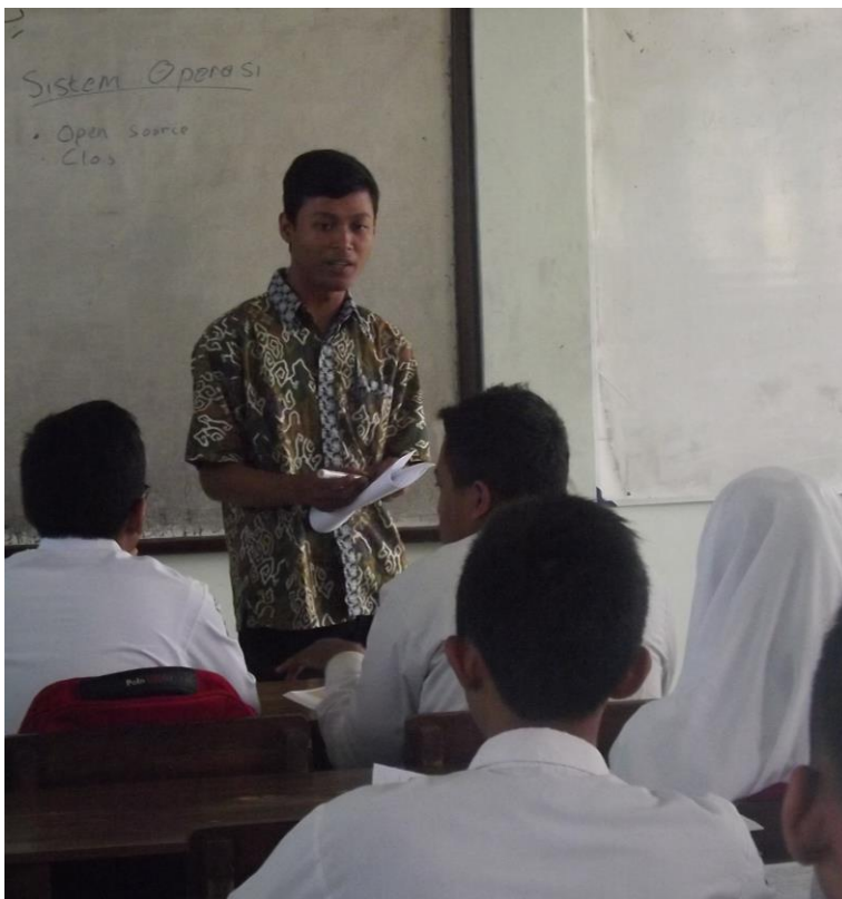
Gambar 2.0 Menjelaskan materi kepada siswa