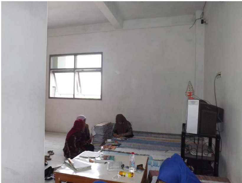
Gambar 6.0 Adminsitration buku Perpustakaan