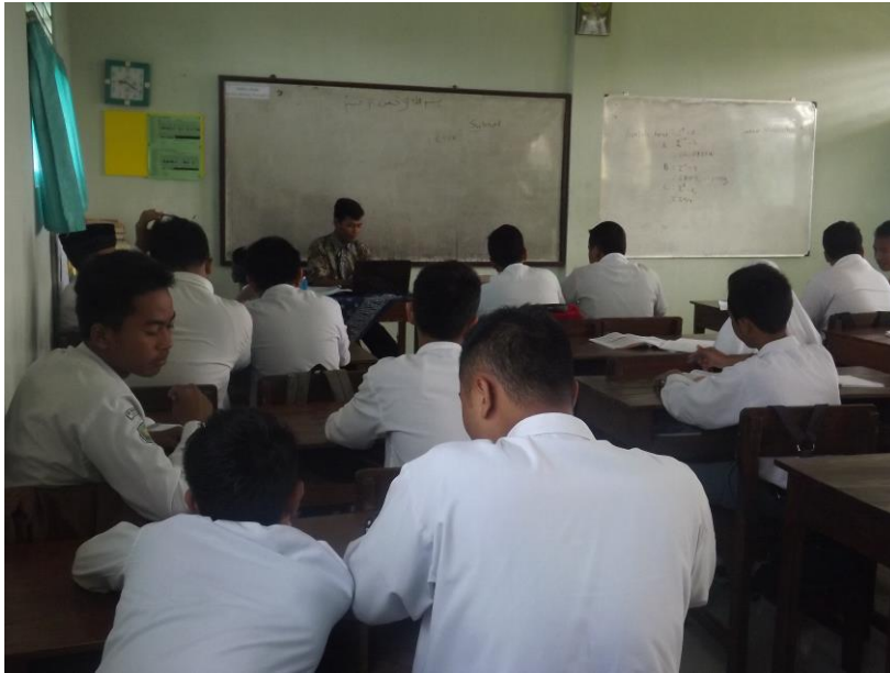
Gambar 3.0 Peroses pembelajaran didalam kelas