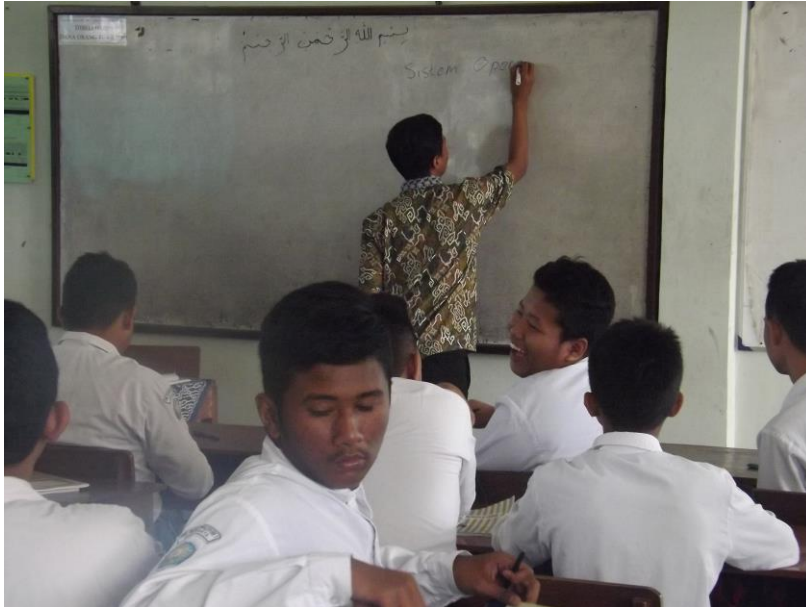
Gambar 1.0 Menuliskan materi pembelajaran