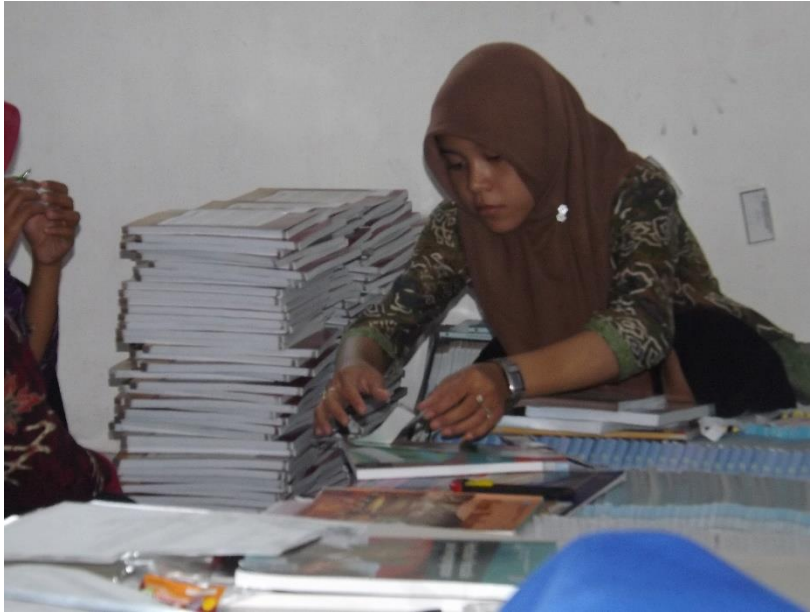
Gambar 5.0 Adminsitration Perpustakaan