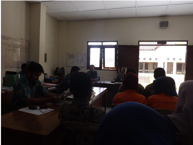
Gambar 4.0 Kajian rutin mingguan