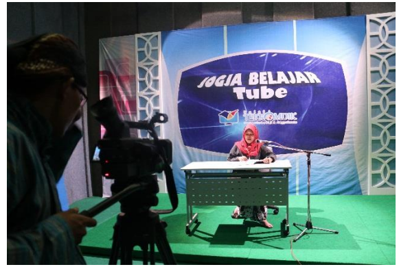
c. Lomba Teka-teki Silang Bahasa Jawa