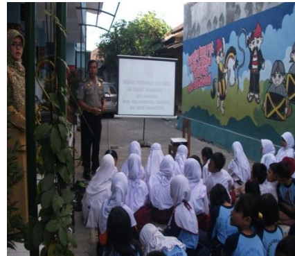
Gambar18. Penyuluhan Tertib Lalu Lintas