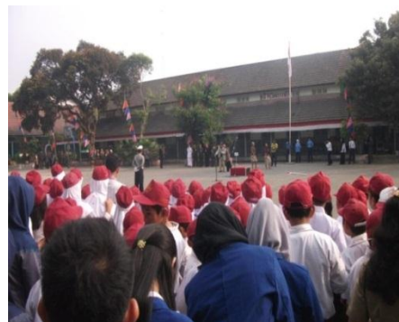
Gambar 12. Upacara Memperingati HUT ke