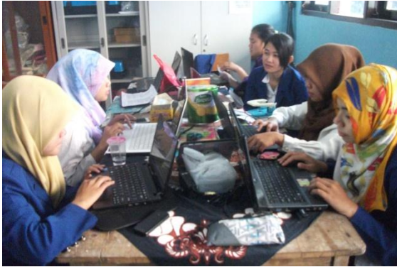
Gambar 15. Membantu administrasi Guru