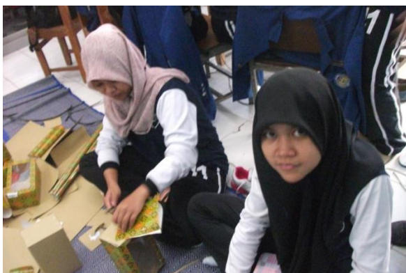
Gambar 1. Membuat Kotak Saran