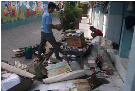
Gambar 9. Kerja Bakti