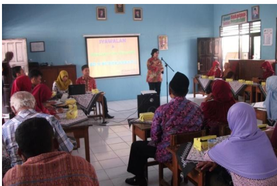
Gambar 11. Syawalan dan Sosialisasi RKAS 70 RI