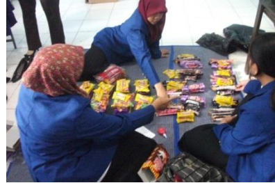
Gambar 6. Persiapan Lomba Tujuh Belasan