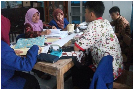
Gambar 5. Kunjungan DPL