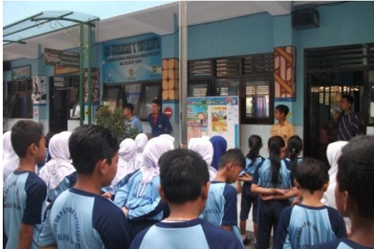
Gambar 7. Apel Pagi RI