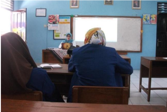
Gambar 13. Rapat bersama guru koordinator DPL