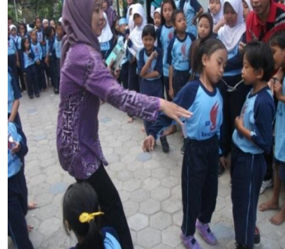
Gambar 8. Lomba Memperingati HUT ke -70