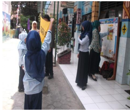
Gambar 16. Latihan Upacara Bendera