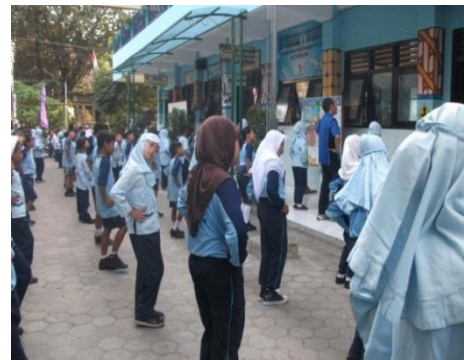
Gambar 10. Senam Pagi