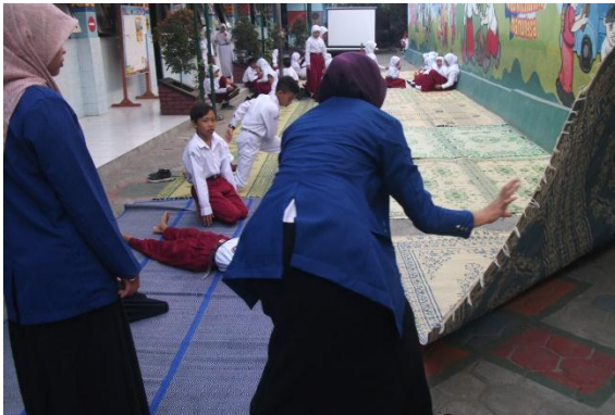
Gambar 17. Persiapan Penyuluhan Tertib Lalu Lintas