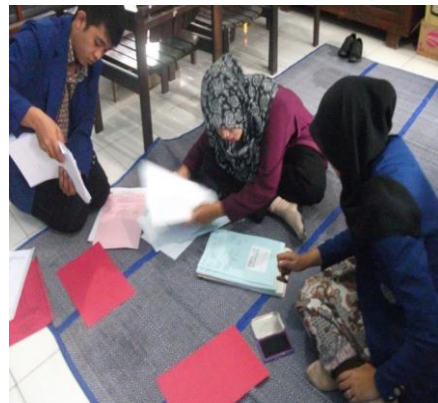
Gambar 2. Pemilahan Dokumen