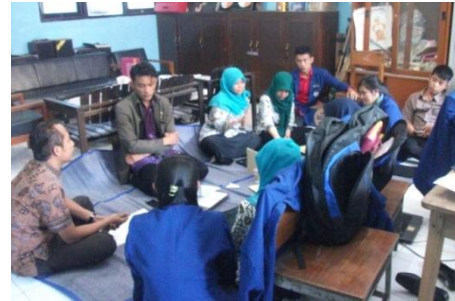
Gambar 14. Koordinasi dengan