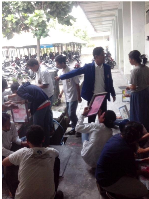
Praktek mengajar mata pelajaran Cetak Saring