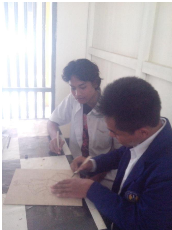
Praktek mengajar mata pelajaran Grafis Seni