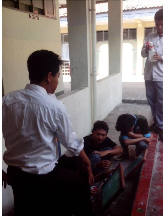
Praktek mengajar mata pelajaran Cetak Saring