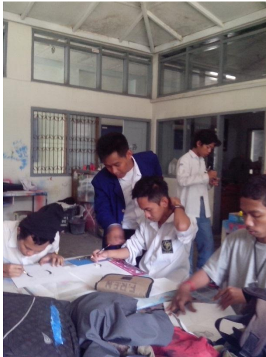
Praktek mengajar mata pelajaran Cetak Saring