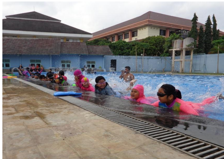
Dokumentasi observasi kegiatan ekstrakurikuler renang SD Al Azhar 31 Yogyakarta