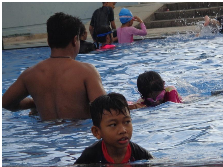
Dokumentasi observasi kegiatan ekstrakurikuler renang SD Al Azhar 31 Yogyakarta