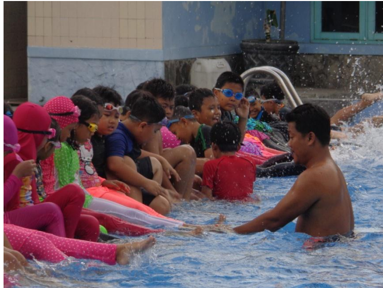
Dokumentasi observasi kegiatan ekstrakurikuler renang SD Al Azhar 31 Yogyakarta