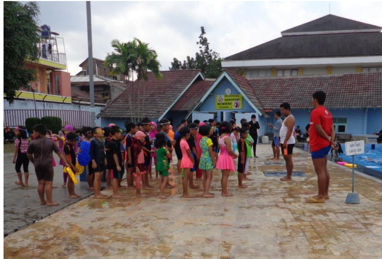
Dokumentasi observasi kegiatan ekstrakurikuler renang SD Al Azhar 31 Yogyakarta