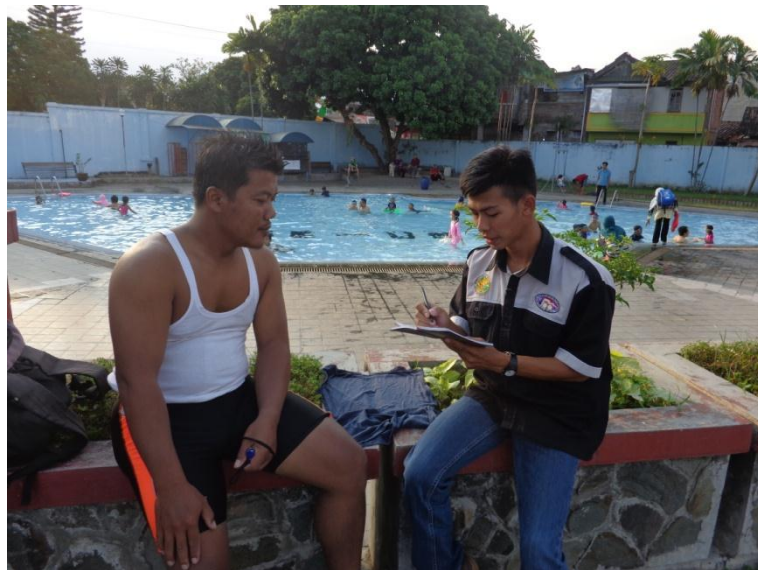
Dokumentasi wawancara kegiatan ekstrakurikuler renang SD Al Azhar 31 Yogyakarta