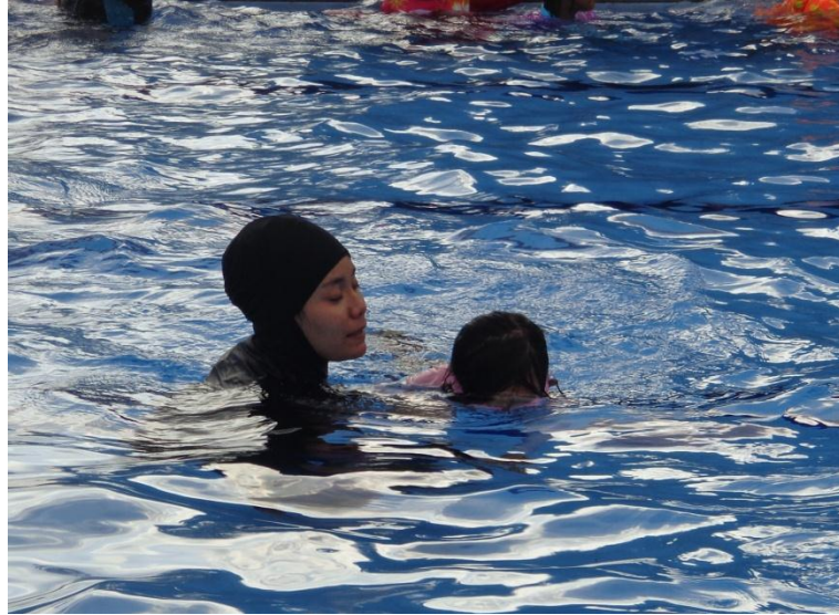
Dokumentasi observasi kegiatan ekstrakurikuler renang SD Al Azhar 31 Yogyakarta