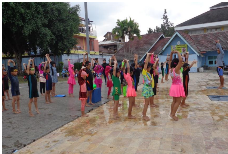
Dokumentasi observasi kegiatan ekstrakurikuler renang SD Al Azhar 31 Yogyakarta