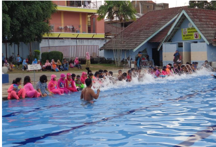
Dokumentasi observasi kegiatan ekstrakurikuler renang SD Al Azhar 31 Yogyakarta