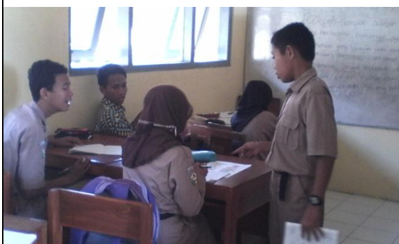
Nama : Kegiatan Pembelajaran di Kelas Lokasi : Ruang Kelas VIII SLB N 2 Bantul