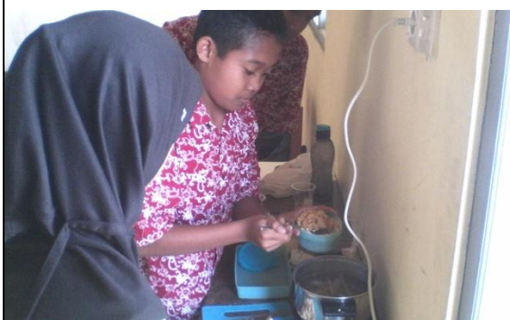
Nama : Praktik Membuat Wedang Jahe Lokasi : Ruang Kelas VIII SLB N 2 Bantul