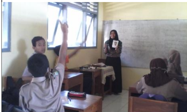
Nama : Praktik Mengajar Terbimbing Lokasi : Ruang Kelas VIII SLB N 2 Bantul