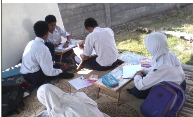
Nama : Kegiatan Pembelajaran SBK Lokasi : Gazebo SLB N 2 Bantul