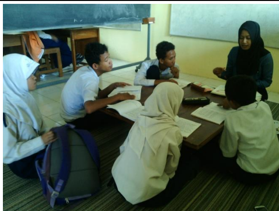
Nama : Praktik Mengajar Terbimbing Lokasi : Ruang Kelas XI SLB N 2 Bantul