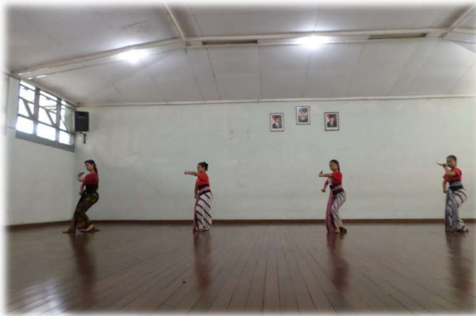
Gambar 6.Tari Surakarta ( Ulap-ulap Tawing )