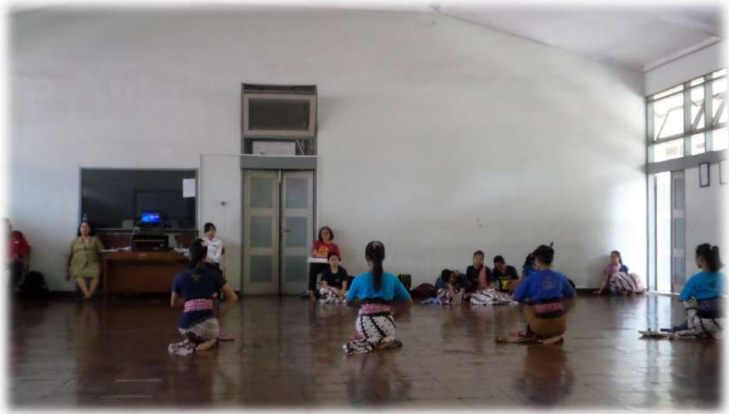
Gambar 3. Tari Surakarta ( Jengkeng )