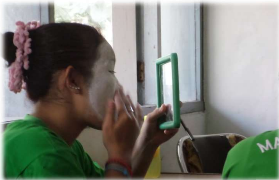
Gambar 10.Rias Busana Tari ( Siswa mempraktikkan sendiri rias Gareng )