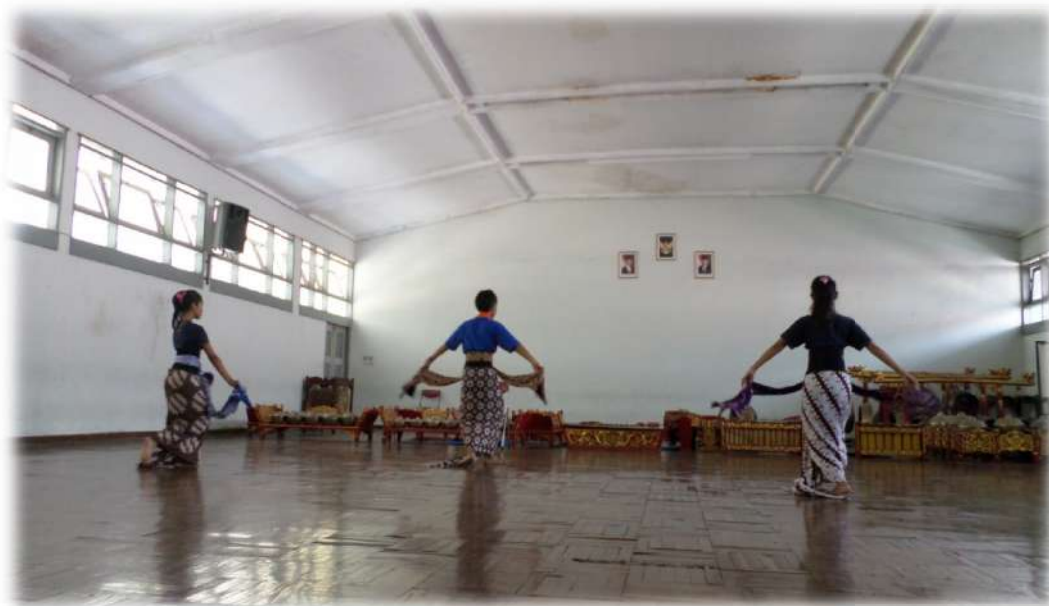
Gambar 1. Tari Surakarta (Gerak srisig)