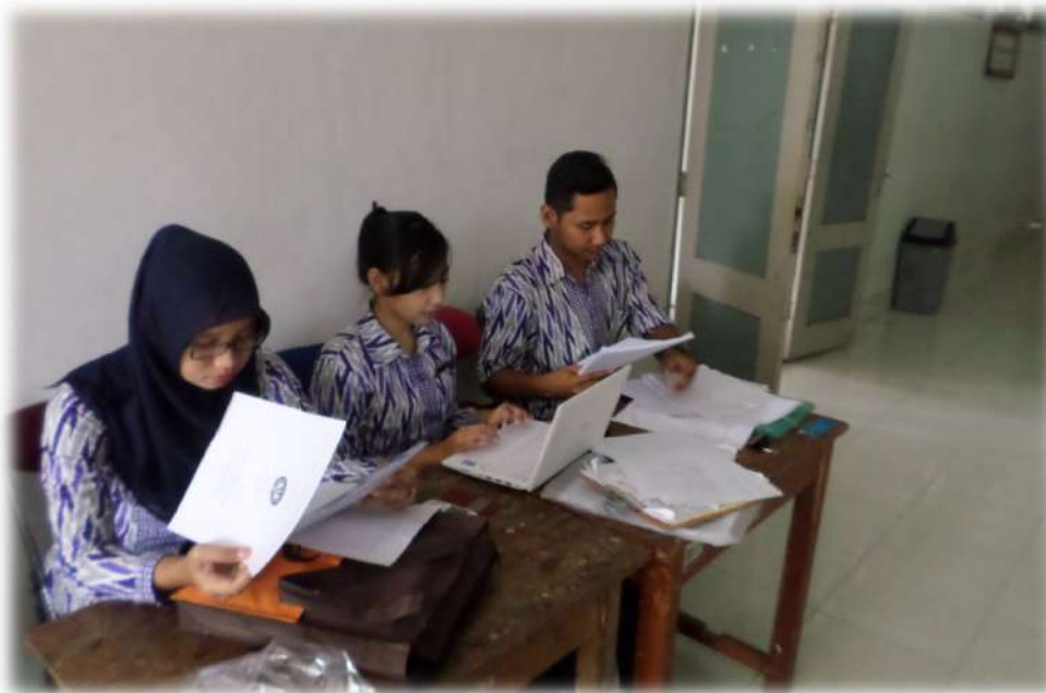
Gambar 12.Membuat laporan