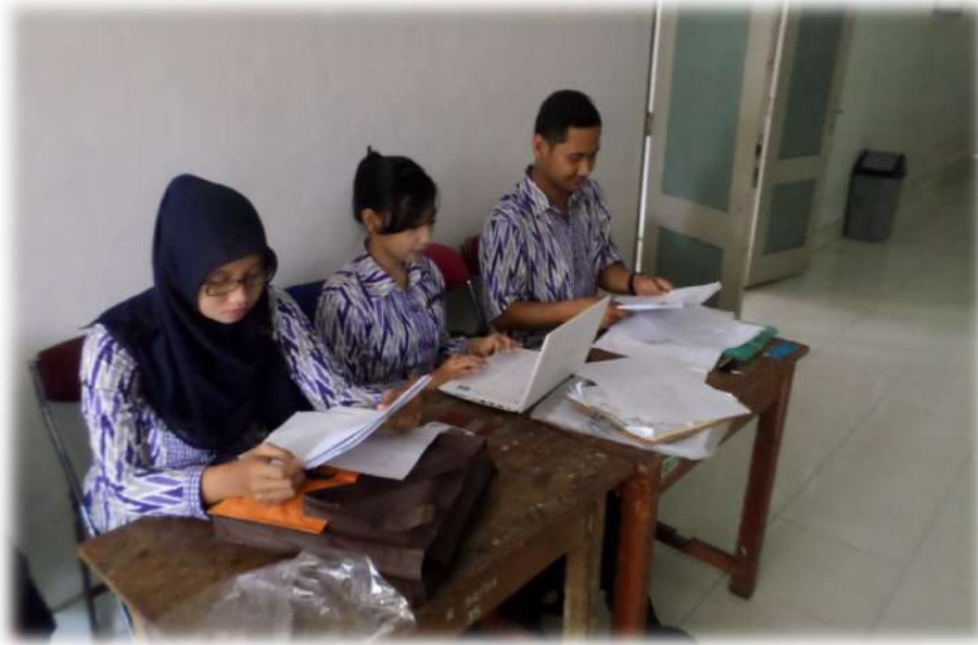
Gambar 11.Membuat Matrik dan Catatan Harian