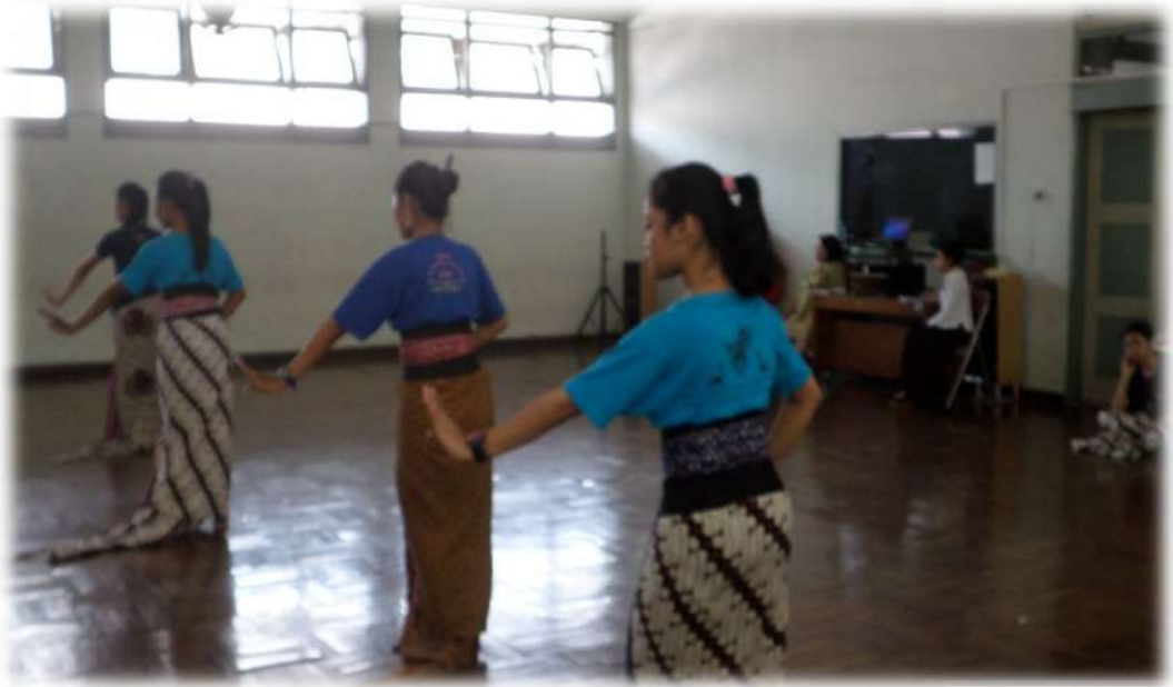
Gambar 4. Tari Surakarta ( Pentangan Kiri )