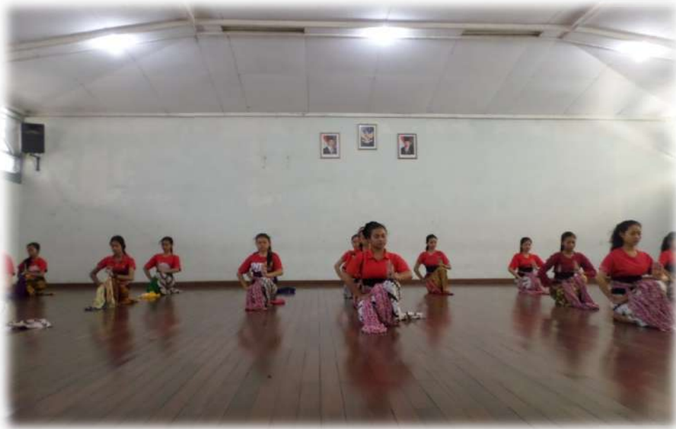
Gambar 5.Tari Surakarta ( Jengkeng )