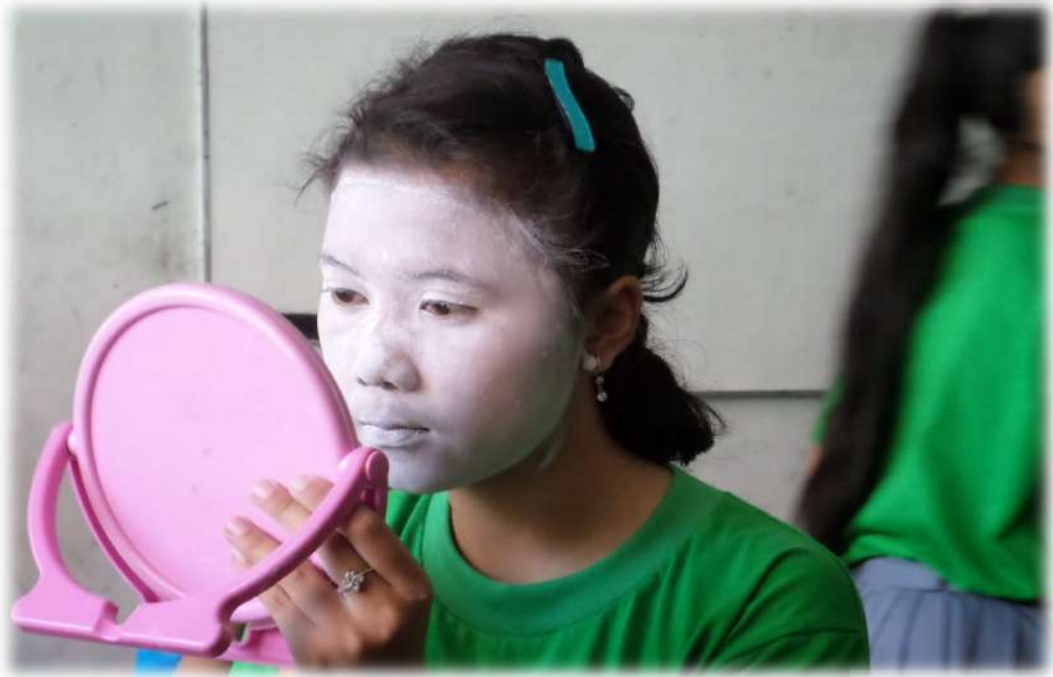
Gambar 7. Rias Busana Tari ( Rias Gareng )