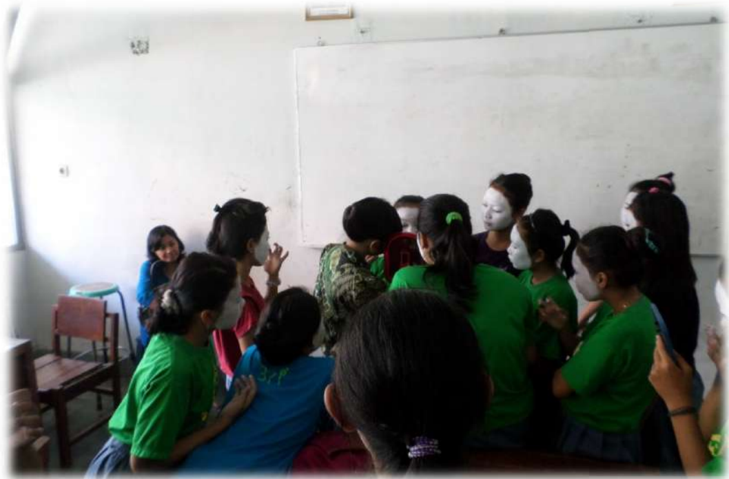
Gambar 8. Rias Busana Tari ( Memberi contoh rias Gareng )