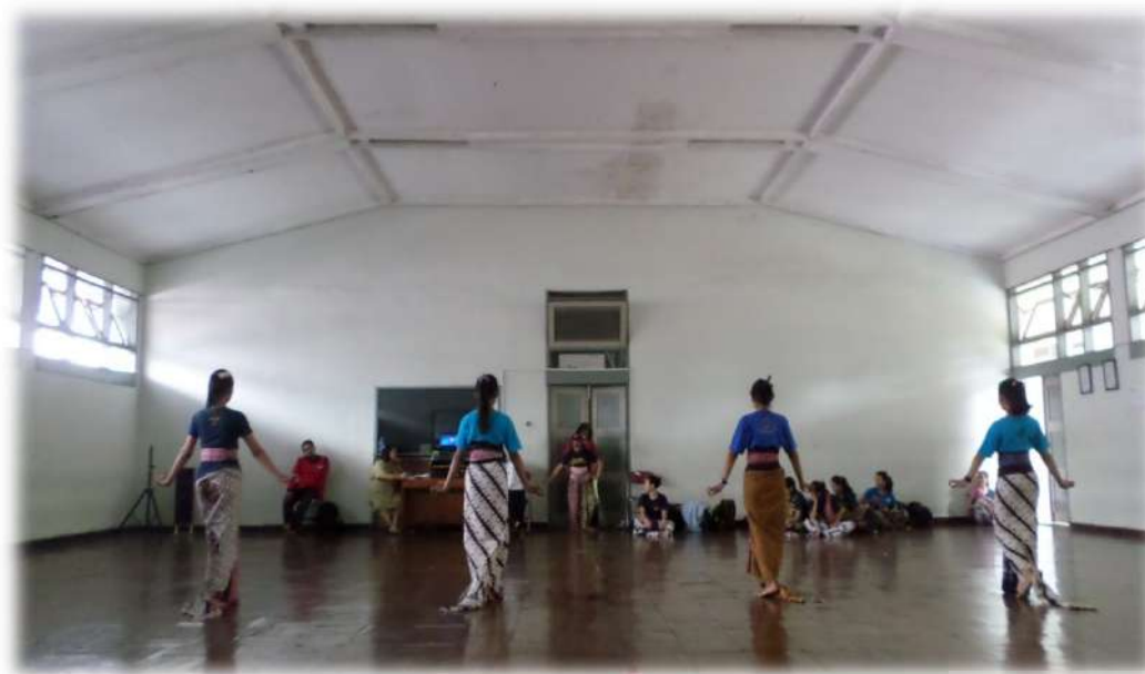
Gambar 2. Tari Surakarta ( Gerak Kapang-Kapang )