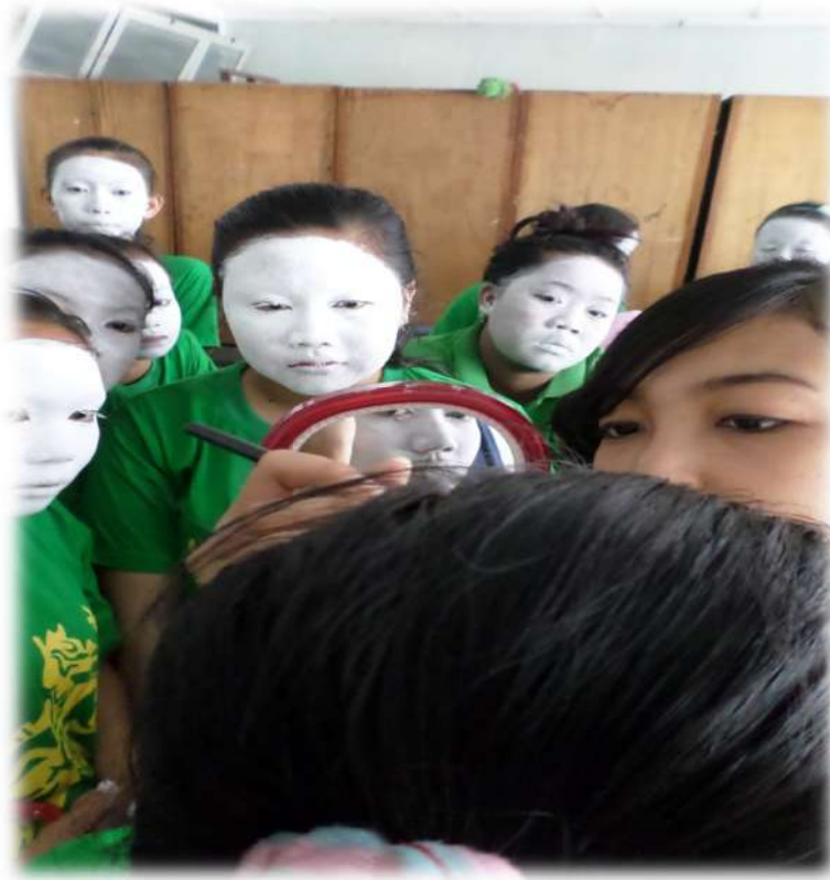
Gambar 9.Rias Busana Tari ( Siswa memperhatikan rias Gareng )