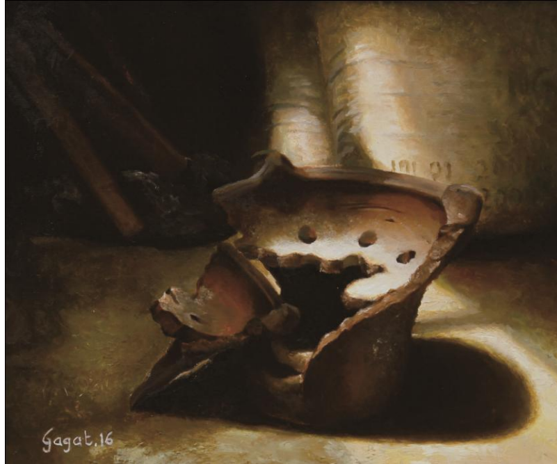
Gambar 20: Tungku Pecah Cat Minyak di atas Kanvas (2016) 50x60 cm

Lukisan di atas menggambarkan sebuah tungku dengan garis lengkung dan seolah membentuk ruang kosong di dalamnya tampak terbelah dan didominasi warna cokelat sebagai objek utamanya. Di samping kananya terdapat sebuah kantong goni berwarna putih kehijauan dengan warna yang tampak lebih terang dan kontras pada bagian tertentu. Sedangkan bagian pojok kiri atas lukisan terdapat tiga batang kayu yang berwarna cokelat tua menggambarkan sedang berada pada kegelapan. Tanah pada bagian bawah objek didominasi antara warna gelap yaitu hijau kecokelatan dan warna terang yaitu putih