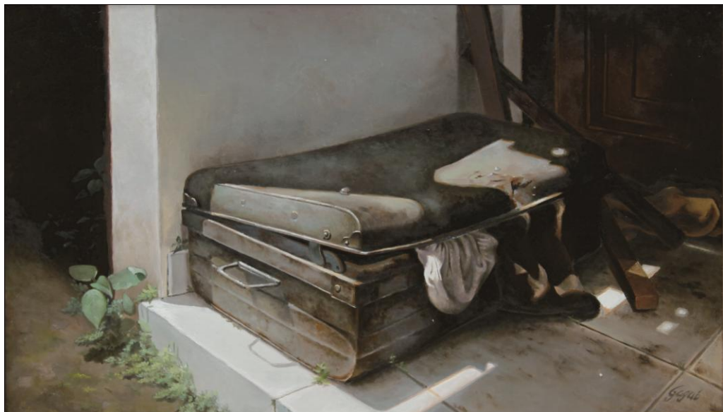
Gambar 18 : Koper Besi yang Usang Cat Minyak di atas Kanvas (2016) 100x60 cm