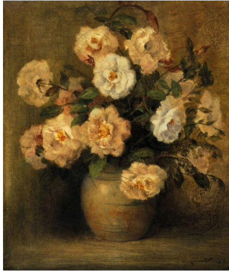
Gambar 1 :Dullah, “White Roses” (Oil on Canvas 57.5 cm x 53.5 cm)

Dullah merupakan salah seorang pelukis realis yang jarang berpameran. Tapi pamerannya bersama anak-anaknya di Gedung Agung (Istana Kepresidenan Yogya) tahun 1978, berhasil menarik puluhan ribu orang. Meskipun pameran diperpanjang satu hari, pintu gerbang Gedung Agung bagian Utara sempat pula jebol. Pameran itu dilanjutkan 20 Desember 1979 hingga 2 Januari 1980, di Aldiron Plaza, Jakarta. Banyak orang kecewa karena ia tak menjual lukisannya. Selain lukisan-lukisan potret, karya-karya Dullah juga banyak menampilkan objek pemandangan alam. S. Sudjojono dan Afandi merupakan guru melukis Dullah. Meskipun begitu corak lukisan Dullah mempunyai perbedaan mendasar dengan dua orang gurunya