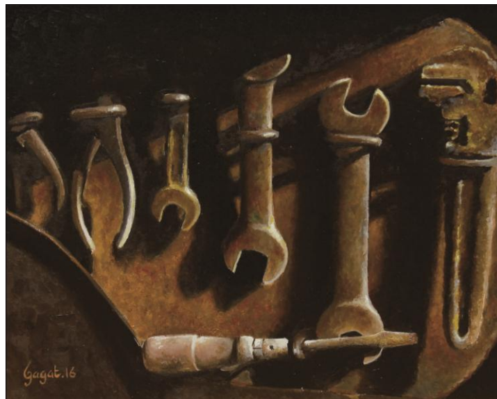
Gambar 21: Kunci-kunci Berkarat Cat Minyak di atas Kanvas (2016) 50x40 cm