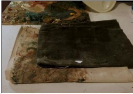
Gambar 7: Kain Lap