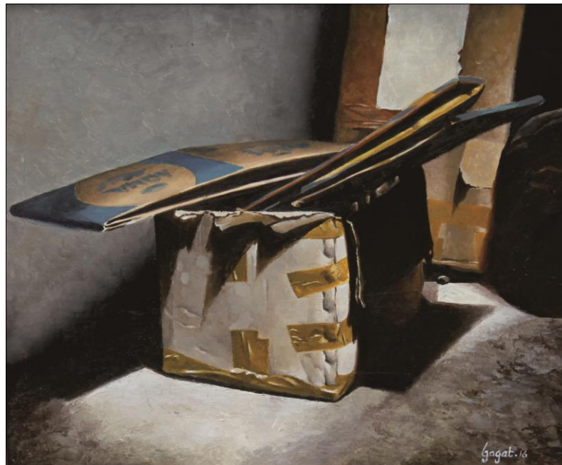
Gambar 15 : Tumpukan Kardus Cat Minyak di atas Kanvas (2016) 50x60 cm