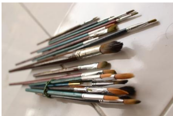
Gambar 5: Kuas

Kuas yang digunakan adalah kuas cat minyak dengan berbagai ukuran, mulai ukuran 0,1 sampai 12, kuas ukuran kecil untuk pendetailan, ukuran sedang untuk bagian pembentukan dasar objek, sedangkan kuas ukuran besar untuk penggarapan background, begitu juga fungsi pada ukuran dan bentuk pisau palet.