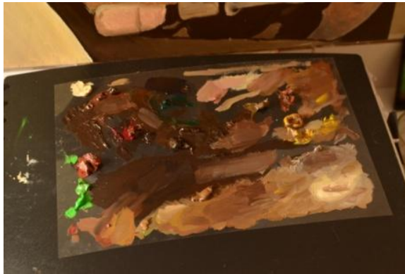
Gambar 6: Palet

Penggunaan palet dalam proses melukis yaitu sebagai tempat untuk menampung cat yang telah dituangkan dan juga berfungsi untuk mencampur warna-warna cat yang diinginkan perupa.