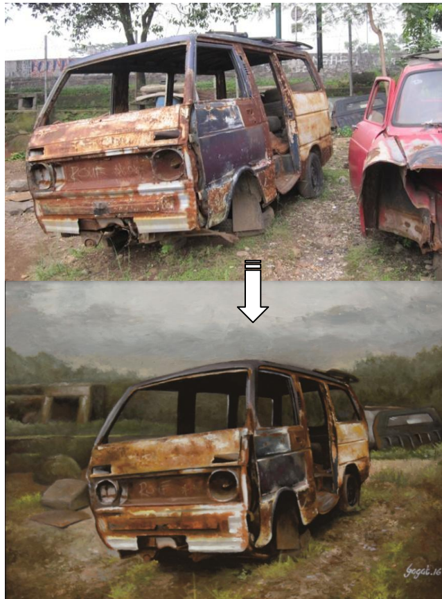
Gambar 12: Perbandingan foto dengan hasil Lukisan (Dokumentasi pribadi)

Dalam proses ini penulis mengatur proporsi dan mengkomposisikan, menambah, serta mengurangi objek-objek yang ada di foto guna meningkatkan rasa dan kualitas lukisan tanpa merubah keaslian objek ada pada kenyataan.