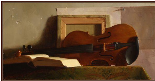
Gambar 2: Jacob Collins, Attributes of the Arts, Oil on Canvas, 2002

Jacob Collins adalah seorang pelukis realis yang berasal dari New York, Amerika Serikat. Setelah meninggalkan gaya modernisme, ia mulai mengerjakan lukisan-lukisan dengan gaya lukisan klasik abad ke-15 hingga abad ke-19 lengkap dengan teknik dan keindahannya. Jacob Collins disiplin melukis figur-figur manusia dengan tingkat kedetailan yang tinggi, pencahayaan yang sangat tepat serta penggunaan warna yang kaya. Brush Stroke