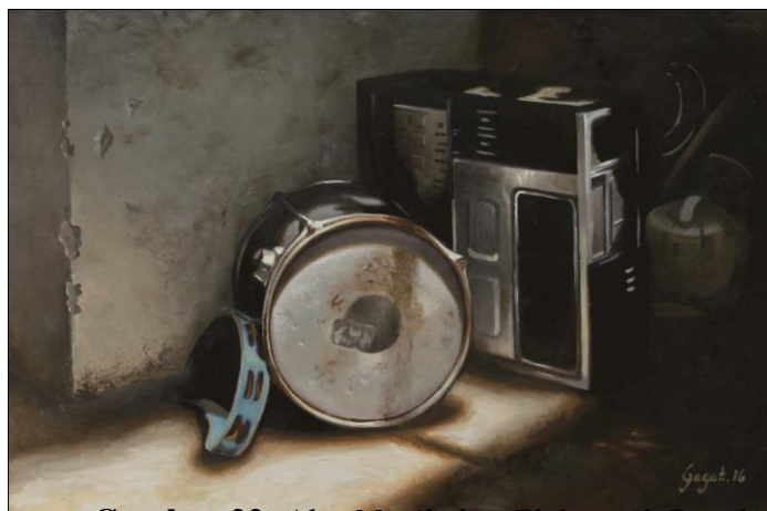
Gambar 22 :Alat Musik dan Elektronik Rusak Cat Minyak di atas Kanvas (2016) 75x50 cm