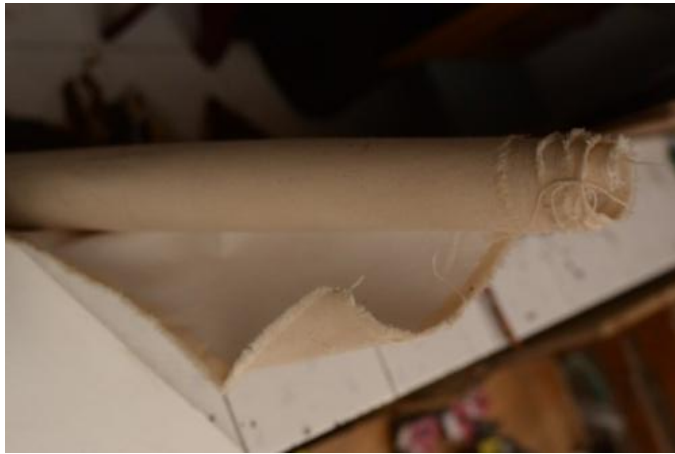
Gambar 10: Kanvas