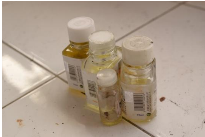
Gambar 9: Pelarut (minyak)

Oil painting digunakan sebagai pelarut atau pencampur warna cat minyak. Pelarut cat yang digunakan yaitu menggunakan minyak cat ( linseed oil ) Marries .