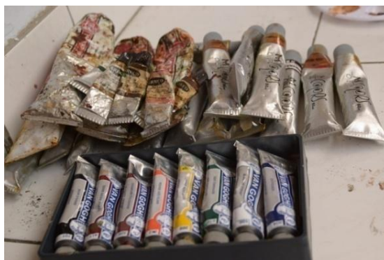
Gambar 8: Cat Minyak (Dokumentasi pribadi)

Jenis cat minyak yang digunakan dalam melukis yaitu, cat produk dari Van Gogh , Grecco , M.Oil , Winton , dan Tallens Amsterdmt . Cat produk ini mempunyai kualitas warna dan ketahanan yang cukup baik dan harganya yang terjangkau.