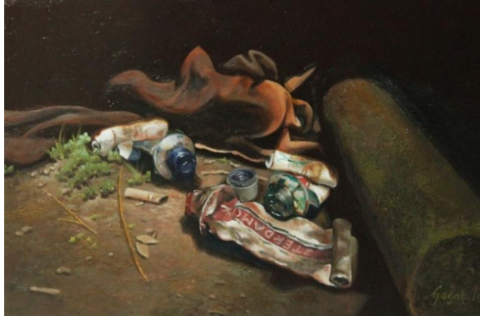
Gambar 17 : Pernah Berjasa dalam Karya Cat Minyak di atas Kanvas (2016) 75x50 cm

Pada lukisan penulis di atas terdapat tiga tube cat minyak yang berserakan dan telah kosong dengan warna Phthalo Green , Phthalo Blue , Dan Burnt Sienna . Di samping kanan terdapat sebatang kayu silinder berwarna coklat kehijauan dengan arah diagonal dan bagian atas terlihat sebuah kain lap berwarna coklat bertekstur halus, tanah yang berwarna coklat tua terlihat pada kiri lukisan dengan banyak sampah berserakan di atasnya mulai dari dedaunan kering, batu kerikil, ranting-ranting patah, dan rerumputan yang tampak kecil berwarna hijau muda.