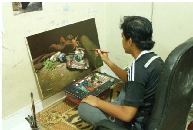
Gambar 14: Proses pendetailan

Finishing atau penyelesaian yaitu tahap pengerjaan secara akhir sebagai penyempurna pada keseluruhan lukisan dengan menambahkan atau menumpukkan warna-warna dengan lebih kompleks dan. Pada tahap ini proses penggarapan lukisan berada pada titik paling sensitif. Disebut demikian karena setiap bagian terkecil diperhatikan dengan seksama seperti memperhatikan warna secara tepat pada bagian-bagian detail terkecil.