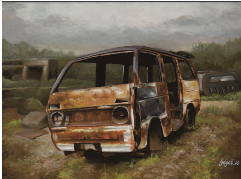
Gambar 16 : Seongkok Mobil Berkarat Cat Minyak di atas Kanvas (2016) 80x60 cm

Objek utama pada lukisan di atas adalah sebuah mobil bekas berkarat dengan didominasi warna coklat bertekstur semu sebelah kanannya terdapat beberapa rongsokan besi dari mobil yang tidak utuh berbentuk persegi, dan sebelah kirinya terlihat terowongan tua yang tampak menjorok ke dalam dikelilingi rerumputan sehingga lingkungannya didominasi warna hijau tua. Langit yang terbentang di atasnya dengan warna putih keabu-abuan dengan sedikit warna merah muda pada perbatasan lengkung antara langit dan pepohonan serta