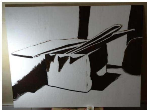
Gambar 11: Proses sketsa