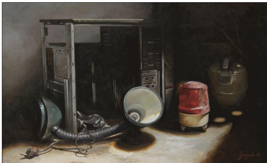
Gambar 19 : Elektronik Rusak Cat Minyak di atas Kanvas (2016) 75x50 cm