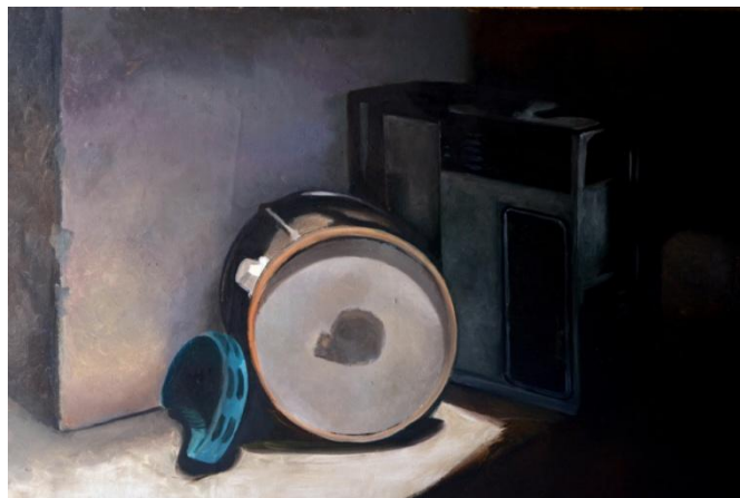
Gambar 13: Contoh Pewarnaan

Proses pewarnaan dasar merupakan proses yang penting. Pemilihan warna yang tepat dari awal akan menentukan pencapaian warna pada tahap akhir. Pewarnaan dasar berorientasi pada gelap terang atau tingkatan value .