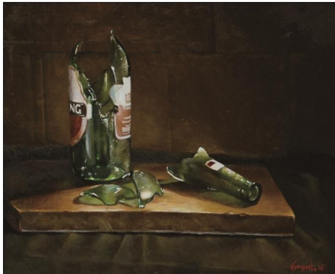
Gambar 23 : Botol Pecah Cat Minyak di atas Kanvas (2016) 50x60 cm

Pada lukisan di atas terdapat sebuah botol berwarna hijau yang tampak pecah dan terbelah menjadi dua bagian dengan serpihan yang ada di sekitarnya. Bagian bawah botol yang lebih besar tampak tegak berdiri dengan kombinasi antara garis lurus dan lengkung serta bagian yang lain tergeletak di kanannya. Beberapa warna putih mengkilap berada di bagian botol kaca tersebut sebagai gambaran dari pantulan cahaya. Sebuah kayu yang berada di bawah sebagai alas berwarna coklat dan tampak ada beberapa lipatan kain hitam yang ada di bagian bawah lukisan. Sedangkan di sebelah kanan dan kiri objek utama didominasi warna coklat tua sebagai background .