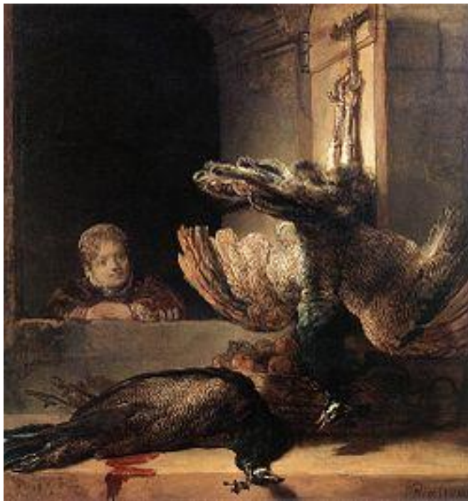
Gambar 3: Rembrandt Two Dead Peacocks and a Girl (c. 1639) Cat Minyak di Atas Kanvas

Memiliki kesuksesan sebagai pelukis potrait, tahun kemudian Rembrandt mengalami kesulitan keuangan. Namun, lukisan – lukisannya populer sepanjang hidupnya,, reputasinya sebagai seorang seniman tetap tinggi. Penulis merasa perlu untuk menjadikannya sebuah referensi dalam mengembangkan kemampuan melukis.