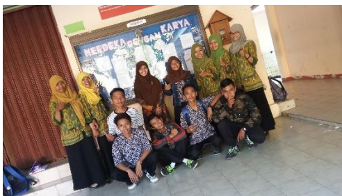
9. Pendampingan Ekstrakurikuler PIK-R Selasa, 11 Agustus 2015