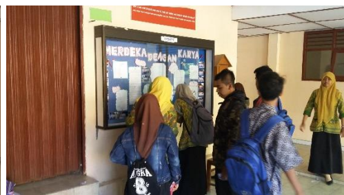
Sabtu, 5 September 2015