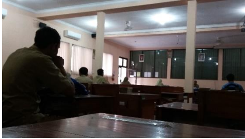
8. Pendampingan Ekstrakurikuler Mading Kamis, 13 Agustus 2015