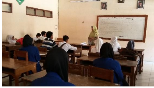
Selasa, 25 Agustus 2015