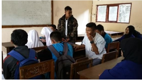
Selasa, 1 September 2015