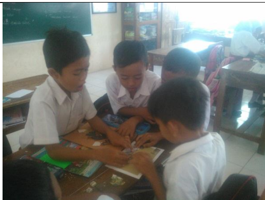
Praktik terbimbing II