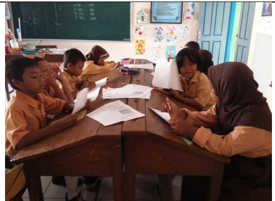
Praktik terbimbing I