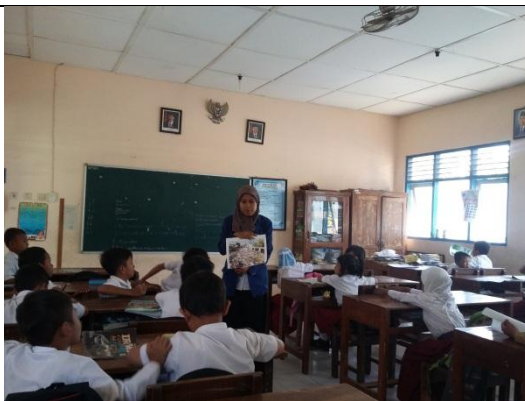
Praktik terbimbing II