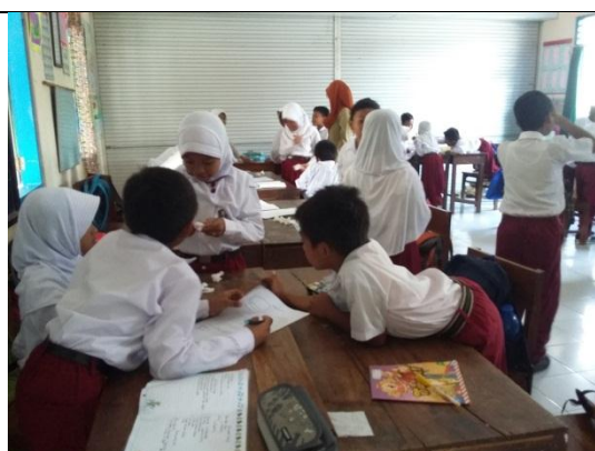
Praktik terbimbing IV