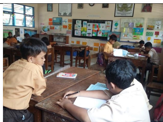
Pendampingan Kelas IV B