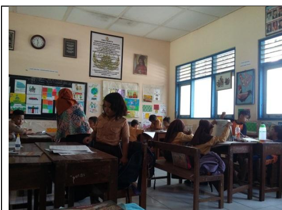
Pendampingan Kelas IV B