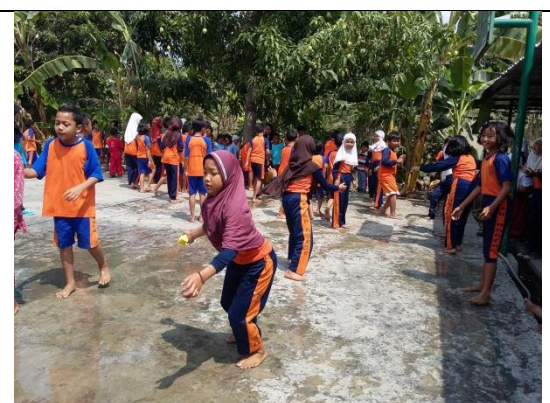
Lomba dan Pentas Seni HUT RI ke 70