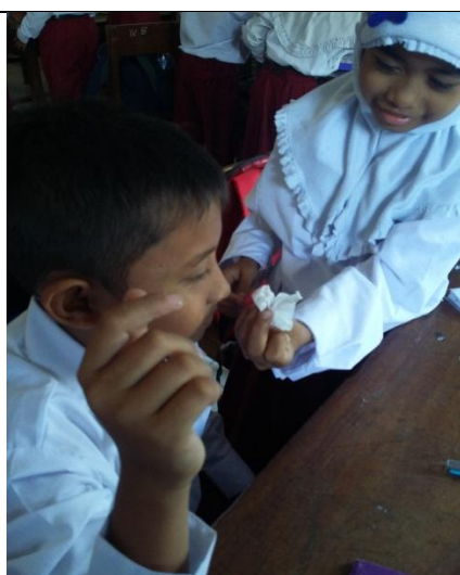
Praktik terbimbing IV