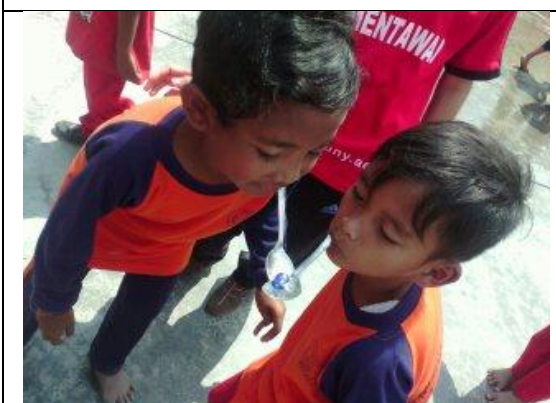
Lomba dan Pentas Seni HUT RI ke 70