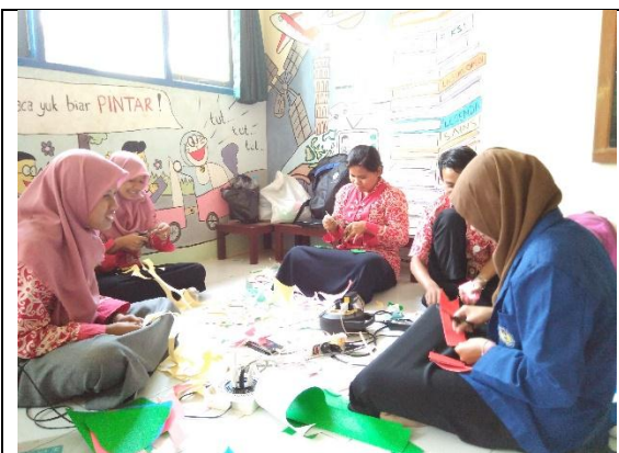
Pengadaan Media Pembelajaran