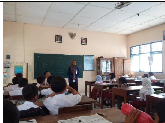
Praktik terbimbing II