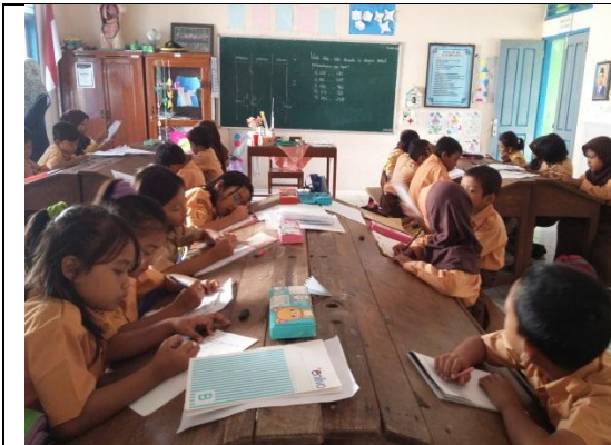
Praktik terbimbing I