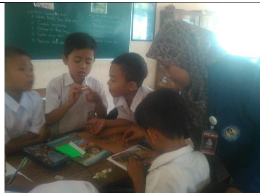
Praktik terbimbing II