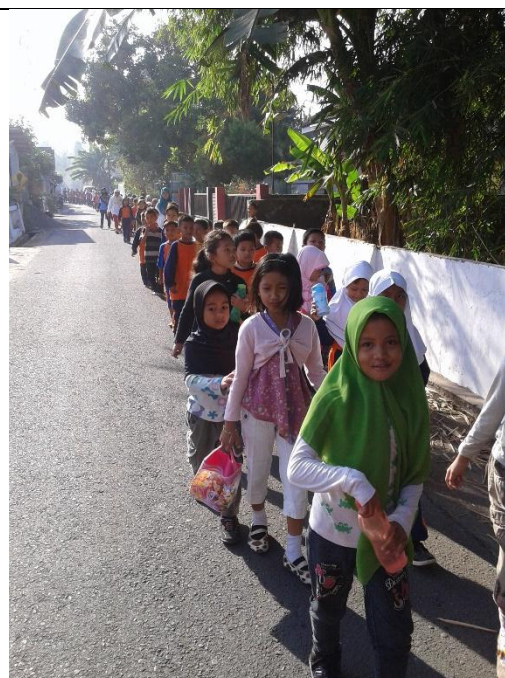
Jalan Sehat HAORNAS