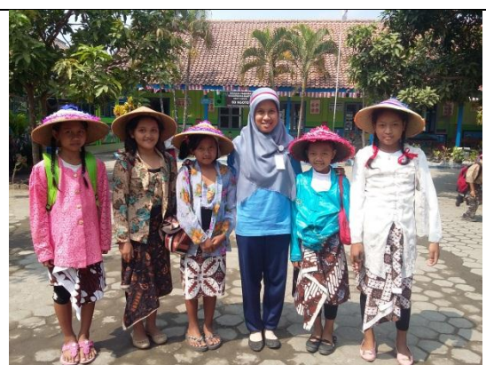
Pawai HUT RI