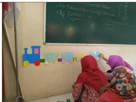
Pengadaan Media Pembelajaran