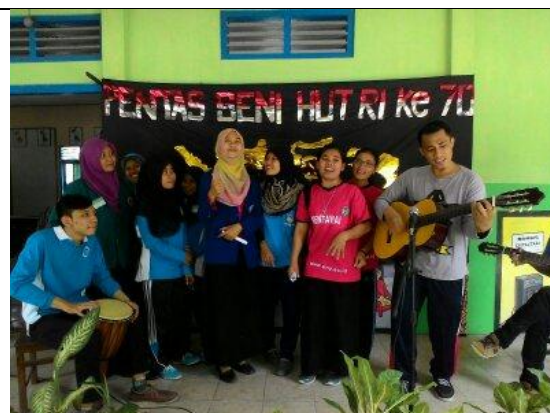
Lomba dan Pentas Seni HUT RI ke 70