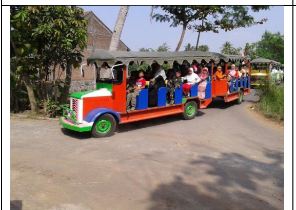
Pawai HUT RI