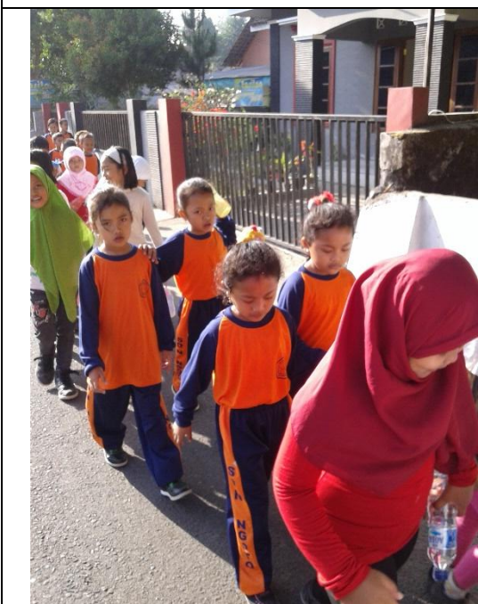
Jalan Sehat HAORNAS