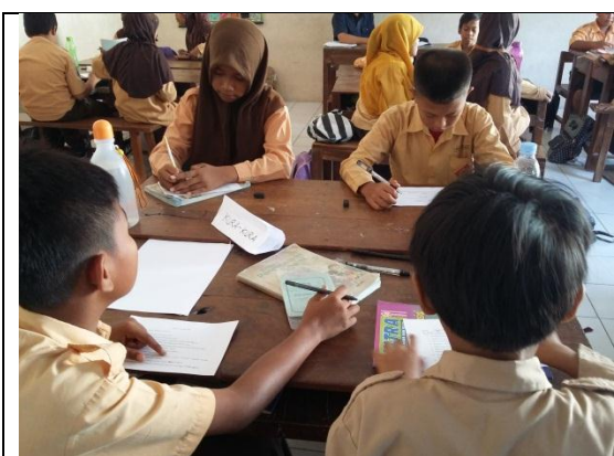
Praktik terbimbing III