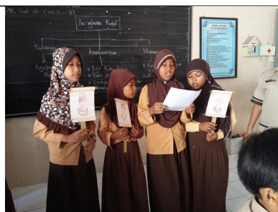
Praktik terbimbing III