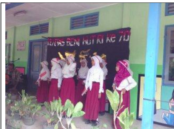
Lomba dan Pentas Seni HUT RI ke 70