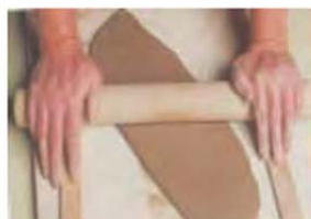
Membuat lempengan dengan rol