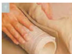
Gulung lempengan dengan cetakan silinder.