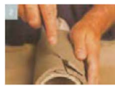
Potong kelebihan tanah menggunakan butsir.