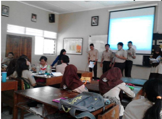
Gambar. 2. Diskusi dan kegiatan mengkomunikasikan di kelas XI IIS 2