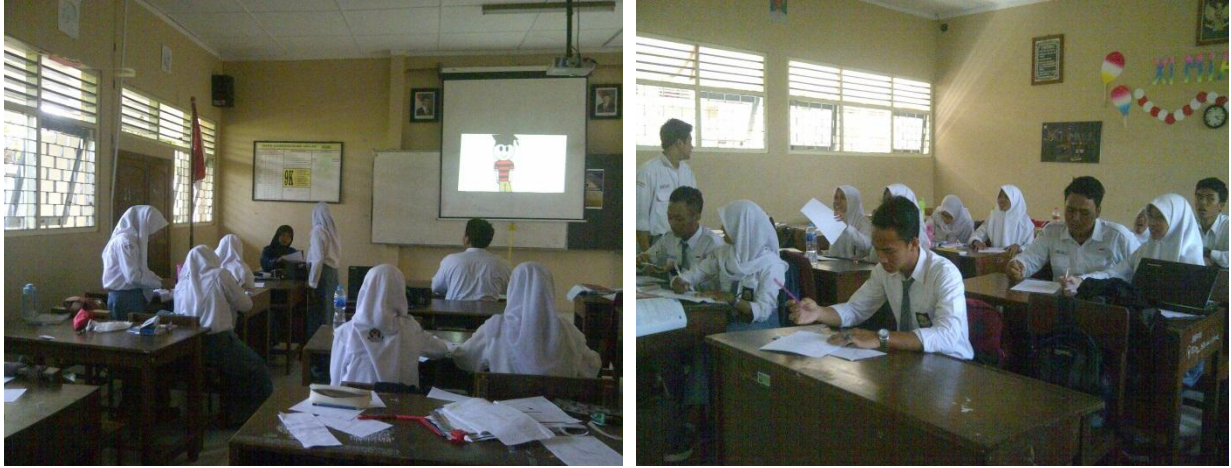
Gambar.1 Proses pembelajaran di kelas XI MIA 2