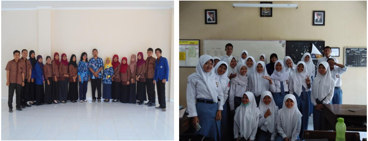
Gambar.6 Penarikan PPL Bersama Koordinator PPL Sekolah dan Siswa Kelas XI IIS 1