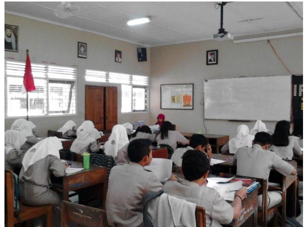
Gambar.3 Kegiatan ulangan harian di kelas XI IIS 2