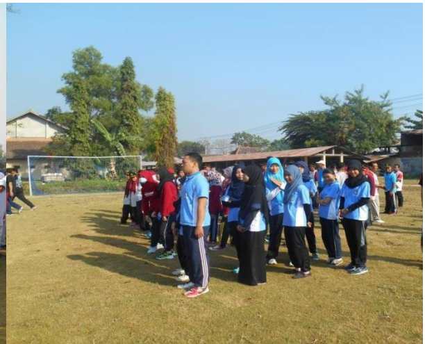
Gambar.4 Apel pagi memperingati HAORNAS (Hari Olah Raga Nasional)