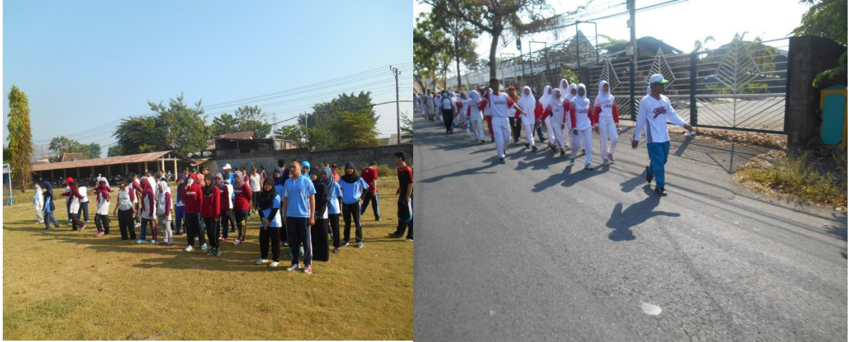
Gambar.5 Senam Bersama dan jalan sehat memperingati HAORNAS (Hari Olah Raga Nasional)