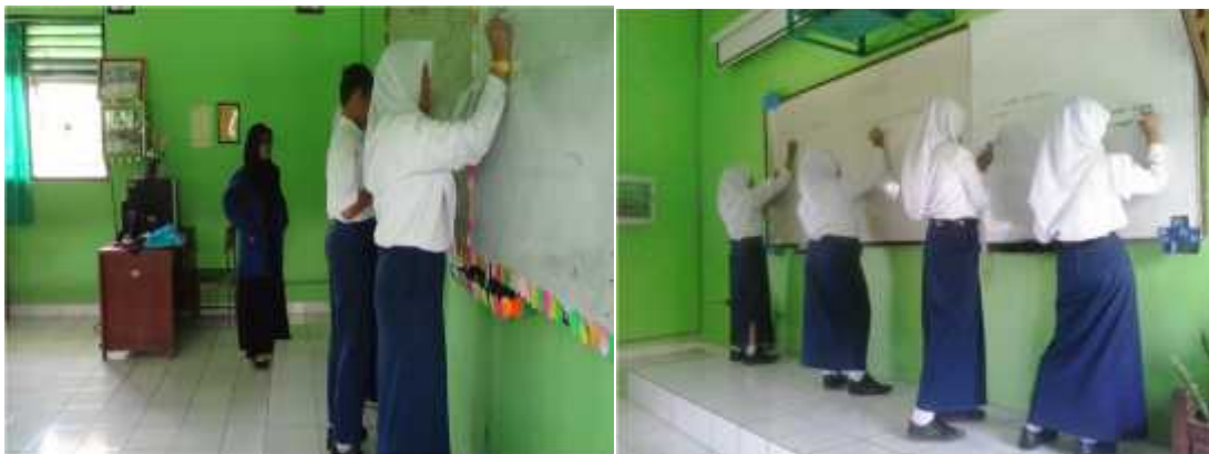
Gambar 8. Peserta didik menuliskan hasil pekerjaannya di papan tulis.