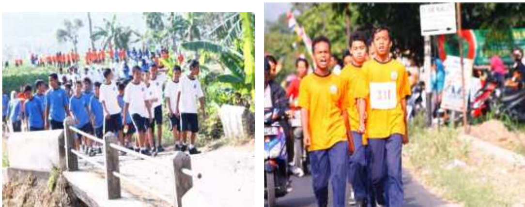
Gambar 12. Lomba gerak jalan dan jalan sehat