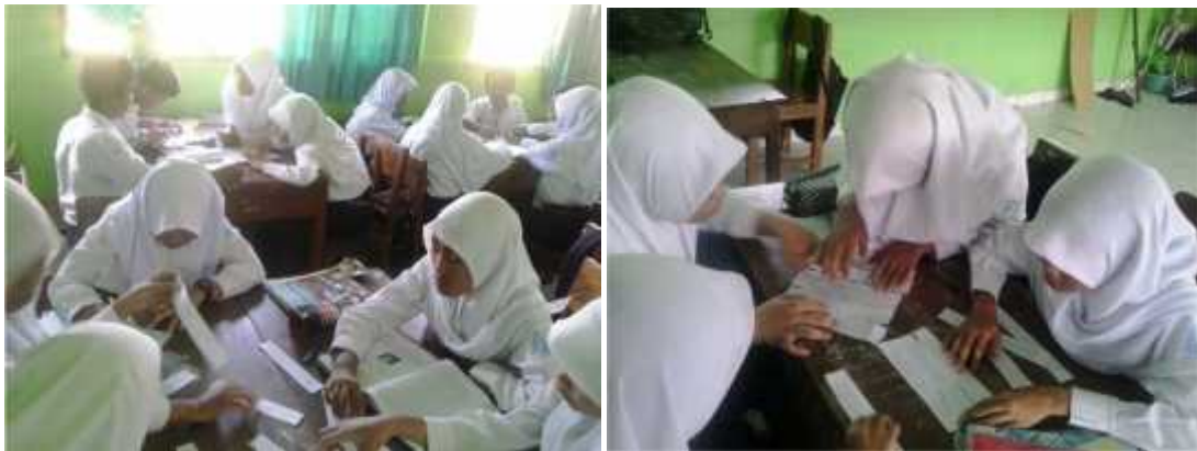
Gambar 5. Diskusi kelompok, materi menyusun teks cerita moral/fabel secara urut dan logis.