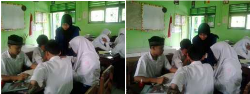
Gambar 7. Mahasiswa mengamati diskusi setiap kelompok