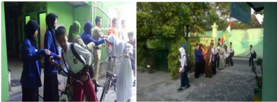
Gambar 10. Piket pagi, menyambut dan menyalami peserta didik yang datang.