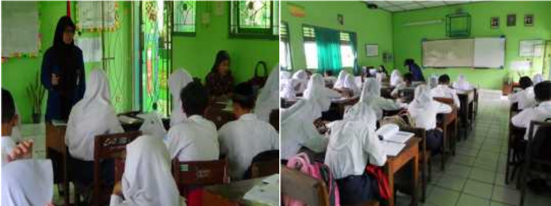
Gambar 2. Mengajar terbimbing