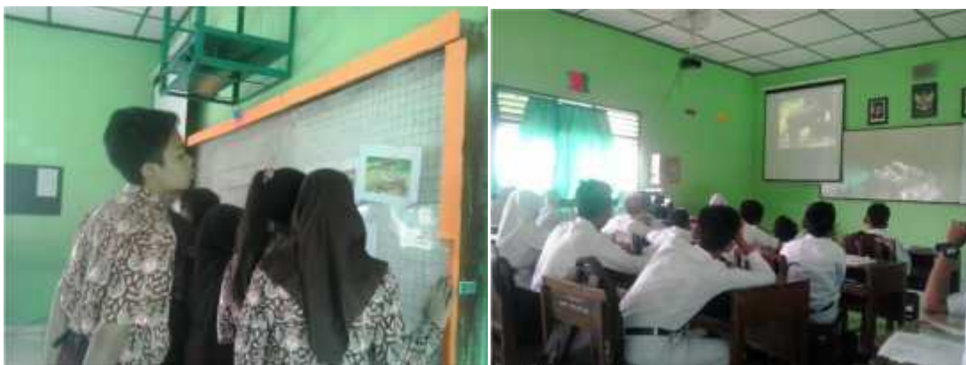
Gambar 9. Peserta didik mengamati berbagai media pembelajaran yaitu media gambar-gambar binatang dan menyimak video cerita tentang semut dan gajah.