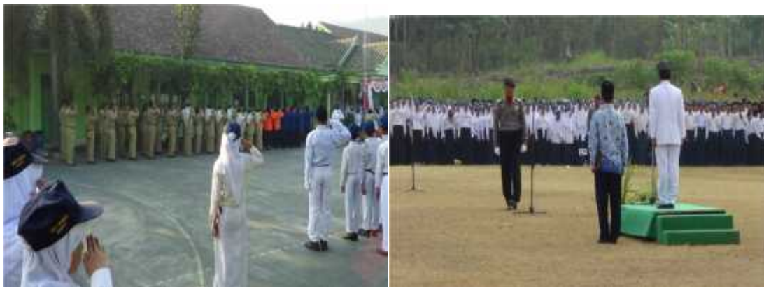
Gambar 11. Upacara bendera hari senin di sekolah dan upacara 17 Agustus di lapangan petir, piyungan