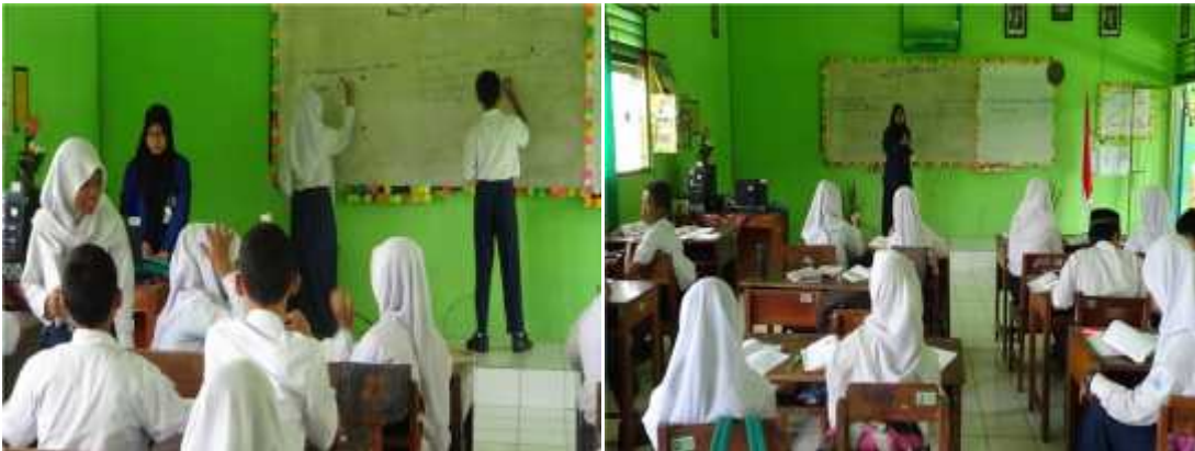
Gambar 3. Mengajar mandiri