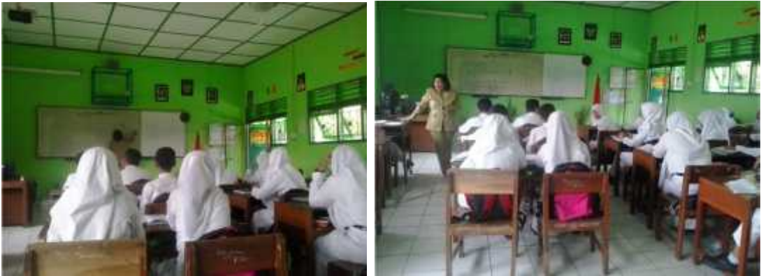
Gambar 1. Observasi guru saat mengajar di kelas