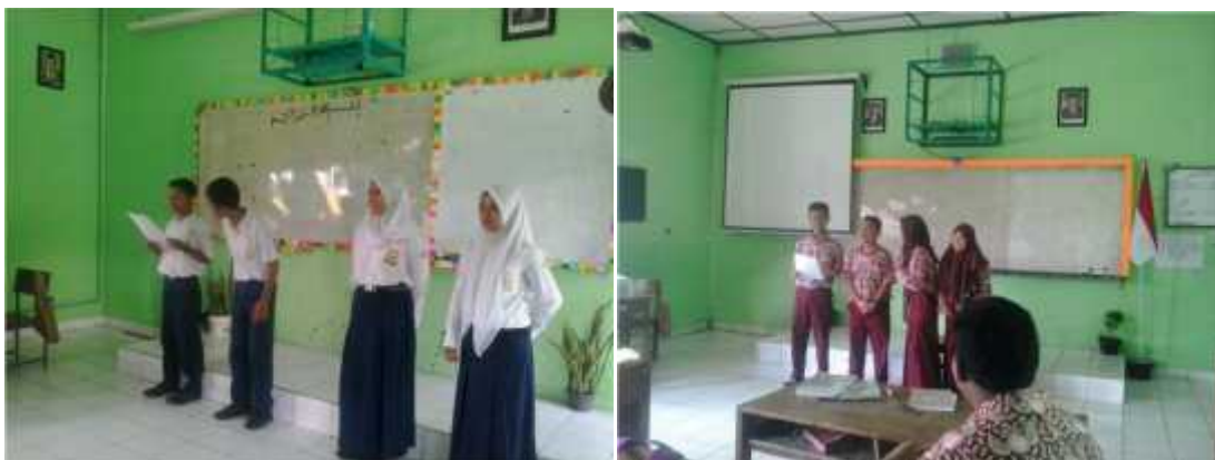
Gambar 6. Kelompok mempresentasikan hasil diskusinya di depan kelas.