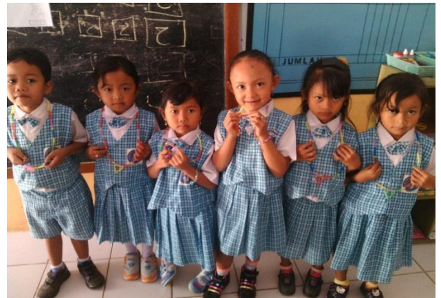
Hasil meronce dengan sedotan dan pelepah pisang