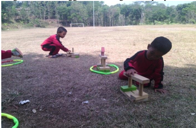
Anak sedang membangun istana dari balok