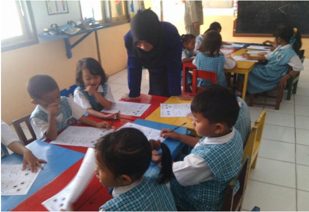
Kegiatan inti memberi tanda >,<