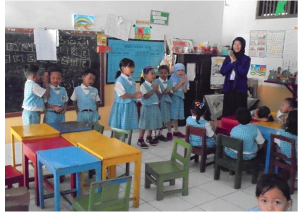
anak berani tampil bernyanyi di depan kelas