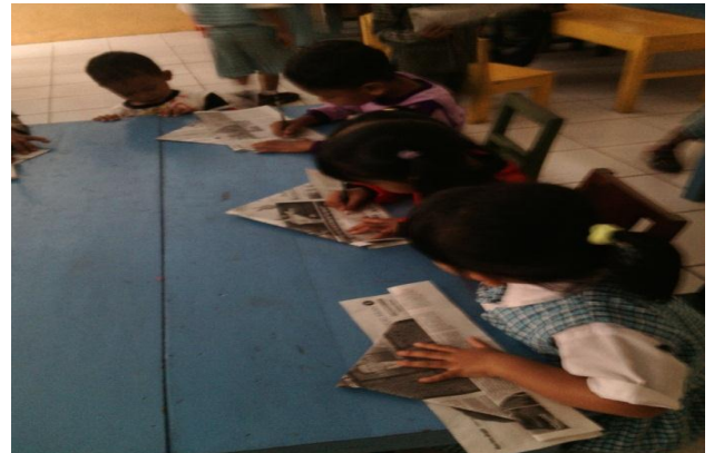
Kegiatan inti melipat koran menjadi bentuk topi