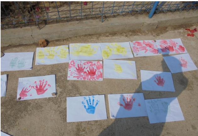
Hasil mengecap tangan cdan memberi angka