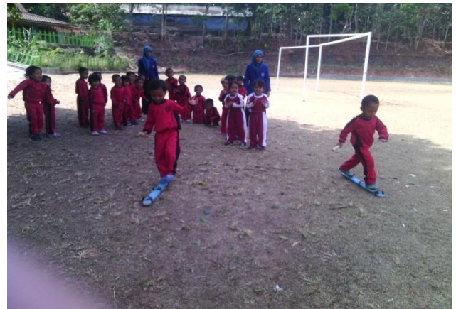
Anak berlomba membuat menara dari balok