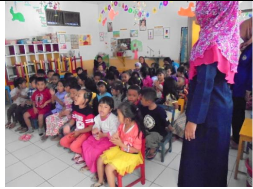
Anak sedang mengikuti ekstra drum band