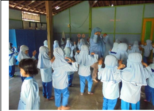
Anak sedang mengikuti ekstra tari