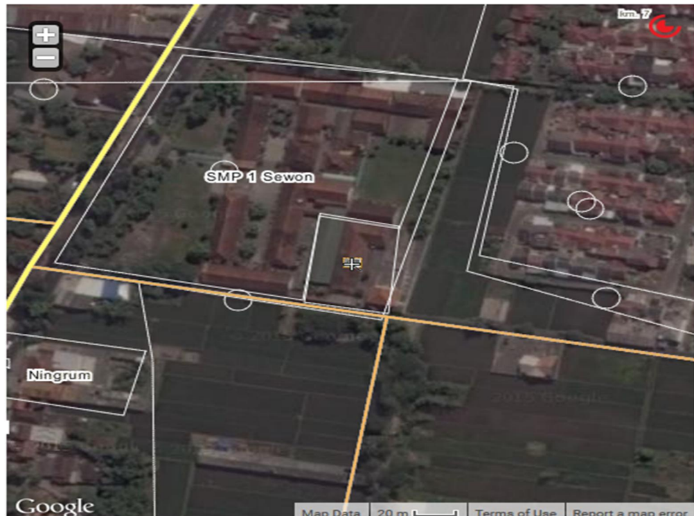
Gambar 1.1. Lokasi Sekolah , Unit 1

kuantitas. Tempat KBM mulai tahun kelima menggunakan 2 unit yaitu di SMP Negeri 1 Sewon (Unit 1) dan bekas SD Manggung (Unit 2) di Cangkringmalang Timbulharjo Sewon. Dan pada tahun ketujuh di unit 2 telah dibangun 5 unit ruang kelas baru. Di samping itu sejak tahun 2007 SMK Negeri 2 Sewon ditunjuk sebagai tempat ICT Center Kabupaten Bantul.