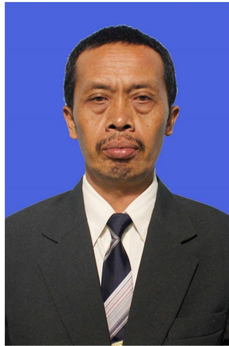
Gambar 1.3. Kepala Sekolah SMK Negeri 2 Sewon