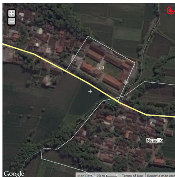
Gambar 1.2. Lokasi Sekolah , Unit 2