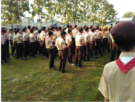
Mengikuti upacara hari Pramuka