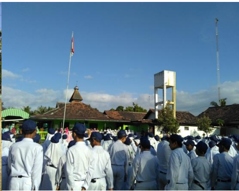
Mendampingi upacara bendera hari Senin