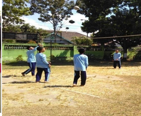
Proses pembelajaran olahraga