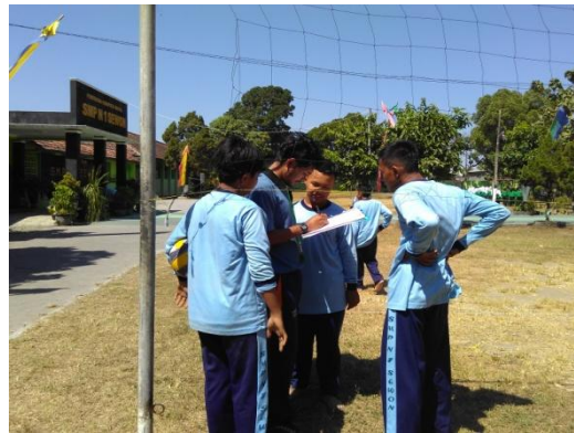
Proses pengambilan nilai olahraga