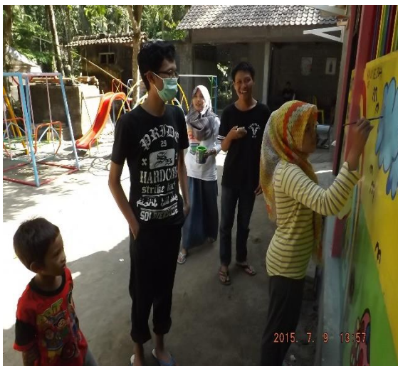
Gambar 3. Melukis dinding PAUD