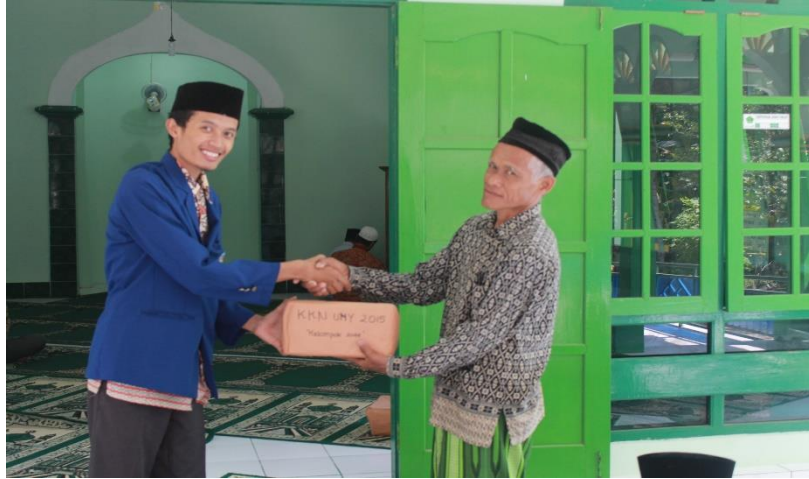
Gambar 11. Pengadaan mukena dan alat kebersihan yang diberikan secara simbolis oleh ketua KKN 2044 kepada Ta'mir masjid Miftahul Hidayah