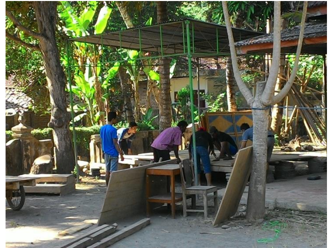
Gambar 14. Kerja bakti di masjid Miftahul Hidayah untuk mempersiapkan Nuzulul Qur'an