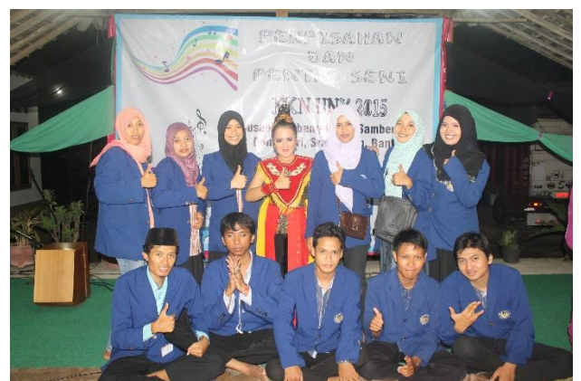
Gambar 41. Foto bersama pasca Pentas Seni dan Perpisahan KKN 2015