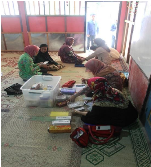
Gambar 33. Medical check up oleh TIM Puskesmas untuk masyarakat Dusun Sambeng II