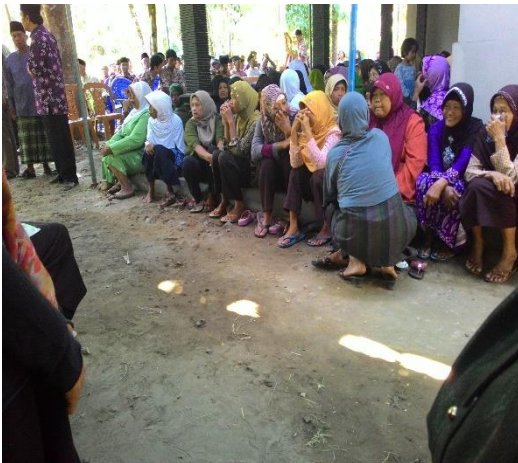
Gambar 48. Takziah di rumah Alm. Ibu Siti