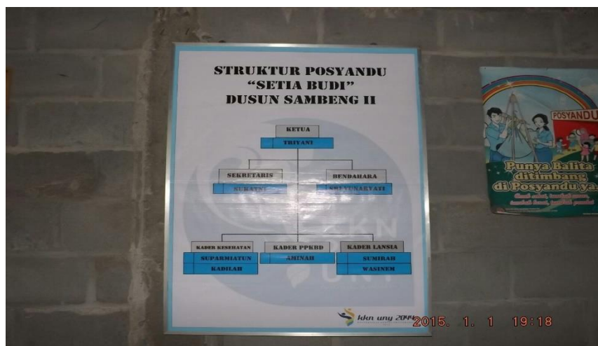
Gambar 15. Pembaharuan struktur organisasi POSYANDU