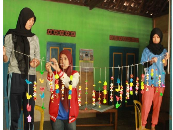
Gambar 9. Pemasangan dekorasi PAUD yang dibuat oleh masyarakat Sambeng II