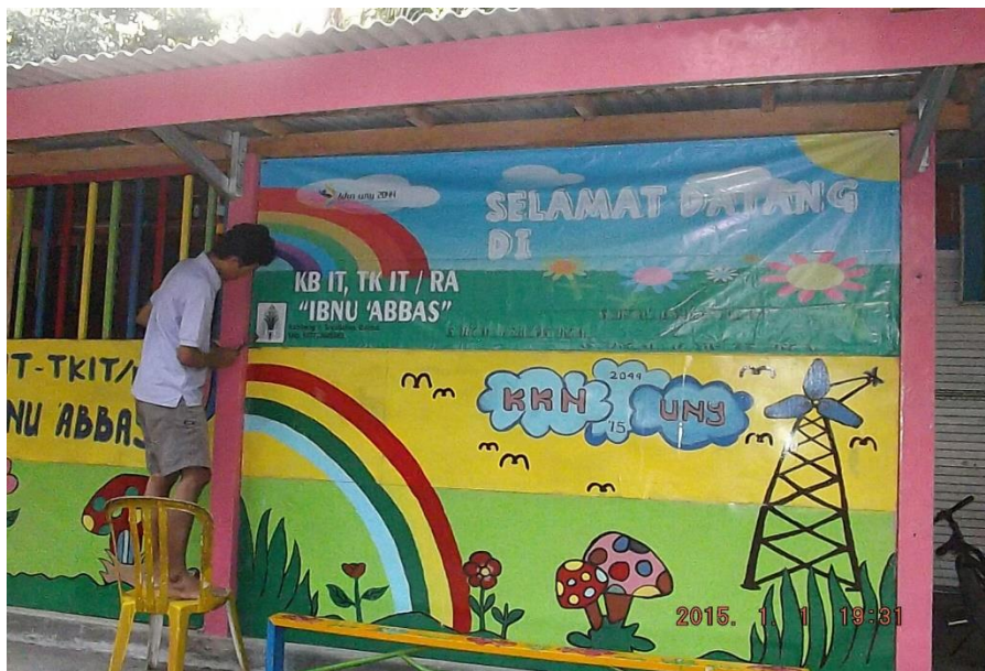
Gambar 10. Pemasangan spanduk PAUD