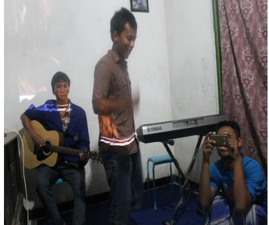
Gambar 43. Malam keakraban untuk pemuda dan pemudi Sembeng II