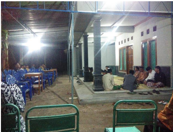
Gambar 52. Tahlilan di rumah Alm. Ibu Siti