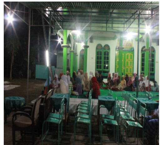
Gambar 45. Malam Nuzulul Qur'an di Dusun Sembeng II