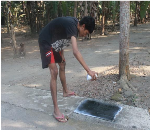
Gambar 20. Penyemprotan papa nama dukuh