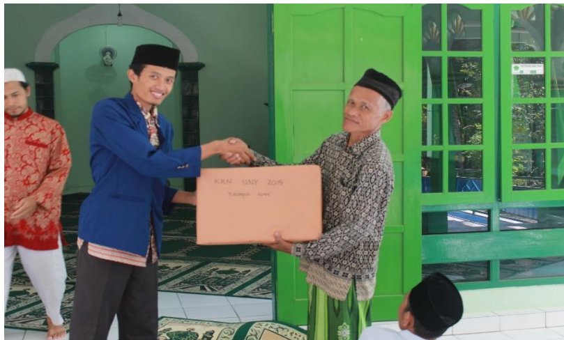
Gambar 12. Pengadaan rak yang diberikan secara simbolis oleh ketua KKN 2044 kepada Ta'mir masjid Miftahul Hidayah