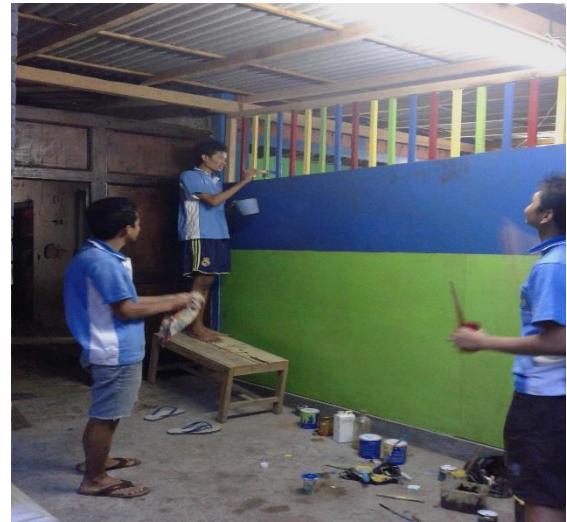
Gambar 2. Pengecatan tahap pertama dengan warna dasar