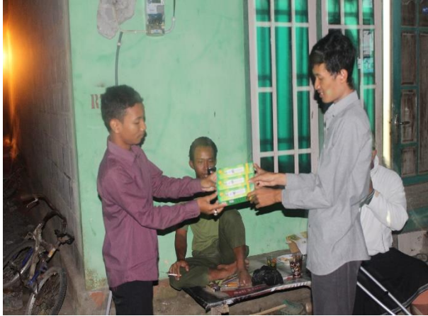
Gambar 16. Pemberian 3 buah lampu yang diberikan oleh ketua KKN 2044 untuk penerangan jalan di Sambeng II