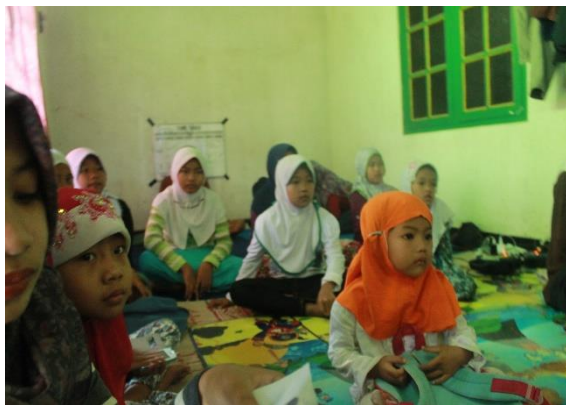
Gambar 34. Nonton bareng film edukasi dengan sasaran anak santri TPA