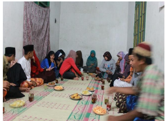
Gambar 47. Tadarus Al Qur'an yang bertempat di POSKO KKN 2044