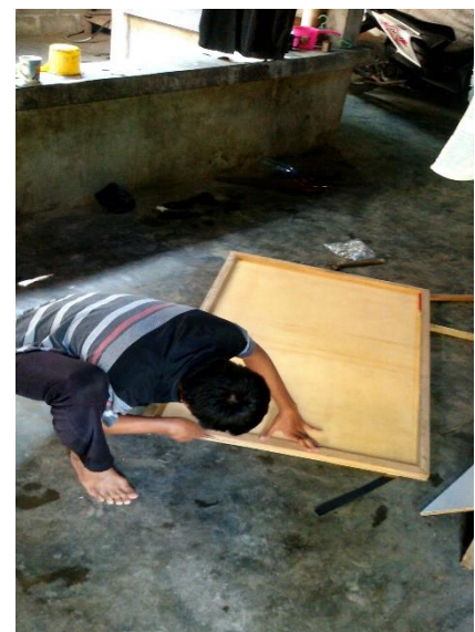
Gambar 19. Pengukuran papan untuk plangisasi