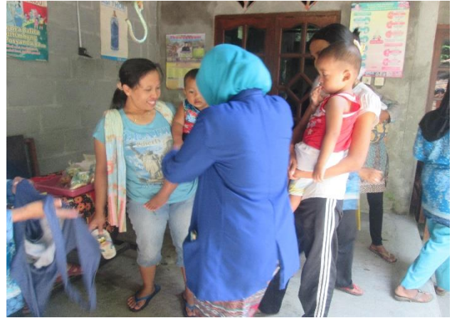
Gambar 34. Pendampingan POSYANDU dari TIM KKN 2044