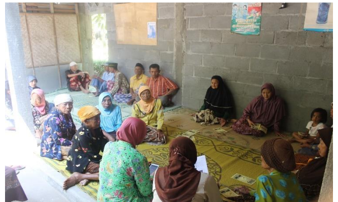
Gambar 32. Sosialisasi DBD dan ASI dengan sasaran masyarakat dusun Sambeng II oleh TIM Puskesmas