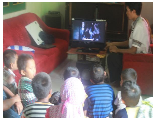
Gambar 35. Nonton bareng film edukasi dengan sasaran anak santri TPA untuk meningkatkan IMTAQ