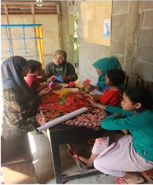
Gambar 8. Pelatihan membuat mainan edukasi PAUD