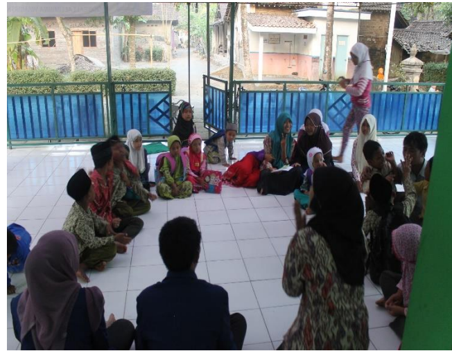
Gambar 28. Metode TGT (Team Games Turnamen) yang diberikan oleh santri dari KKN 2044