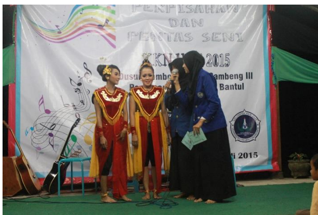
Gambar 40. Penampilan tari oleh 2 mahasiswa KKN UNY