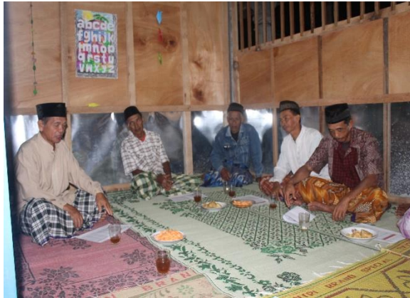
Gambar 24. Sosialisasi Progam Kerja KKN 2044 yang dihadiri oleh tokoh masyarakat dukuh Sambeng II