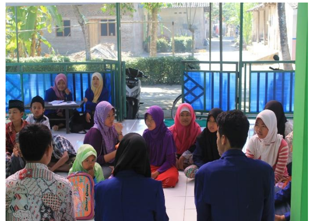
Gambar 27. Lomba keagamaan dengan sasaran santri TPA Darrusalam