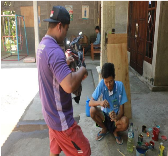
Gambar 1. Pemilihan cat untuk dekorasi PAUD