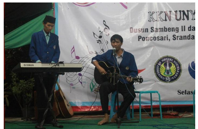
Gambar 39. Penampilan akustik gitar dan keyboard oleh anggota KKN 2044