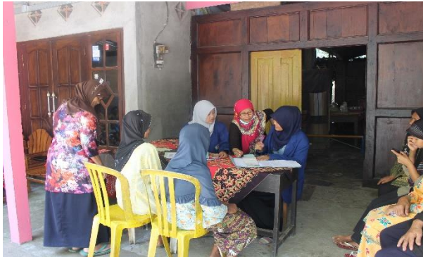
Gambar 31. Admin medical check dari TIM KKN 2044