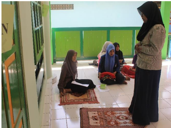
Gambar 26. Lomba keagamaan hafalan sholat