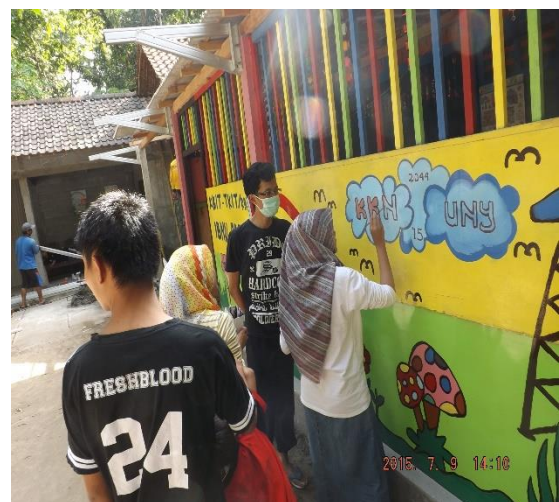
Gambar 4. Pelukisan dinding PAUD dan finishing