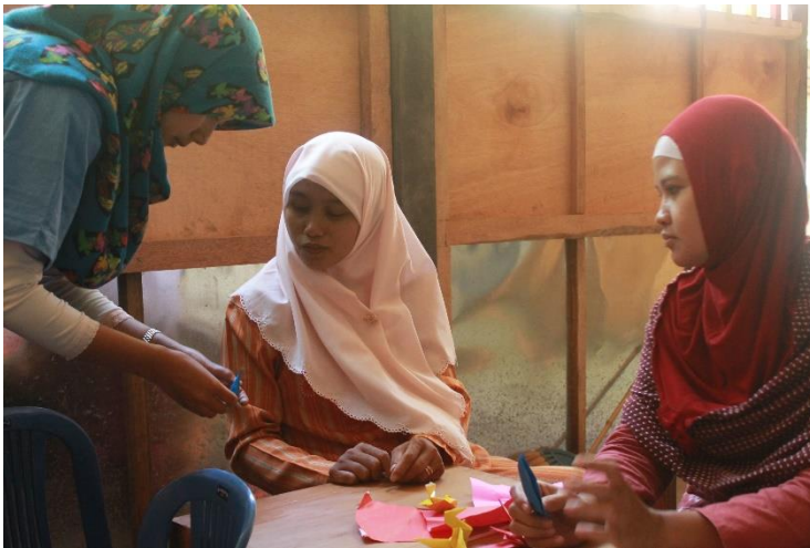
Gambar 6. Pelatihan membuat origami dengan sasaran guru PAUD