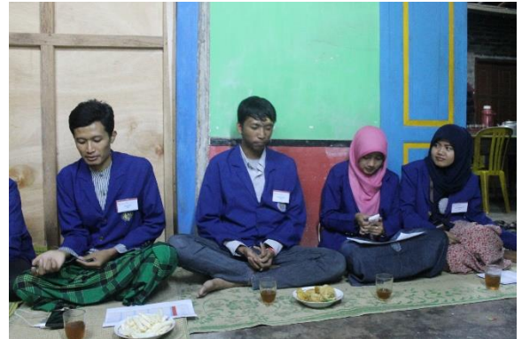
Gambar 25. Sosialisasi Progam Kerja KKN 2044 yang dibacakan oleh ketua KKN 2044