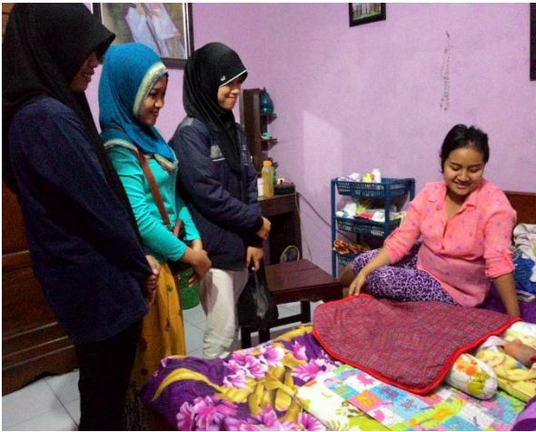
Gambar 50. Brokohan di salah satu rumah warga dusun Sambeng II