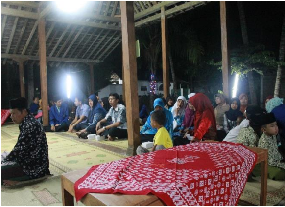
Gambar 36. Pentas seni perpisahan shift ke-1 dan penerjunan shift ke-2 di Dusun Sambeng II