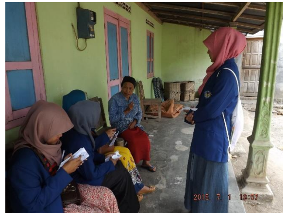
Gambar 23. Perkenalan dengan warga dusun Sambeng II