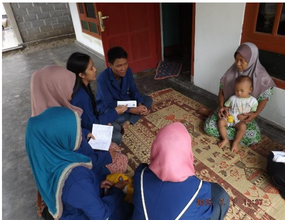
Gambar 22. Perkenalan dengan tokoh masyarakat dusun Sambeng II