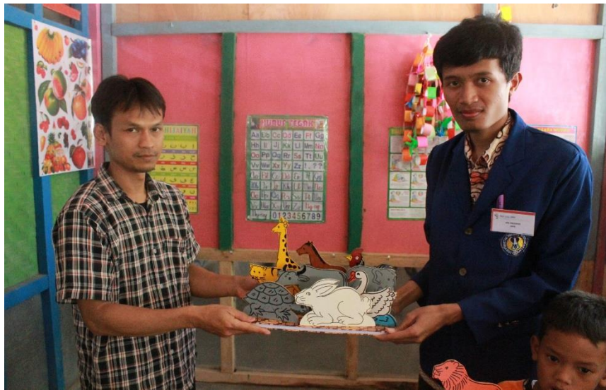
Gambar 5. Pengadaan mainan PAUD yang diserahkan secara simbolis oleh ketua KKN 2044