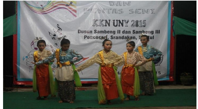
Gambar 37. Penampilan anak-anak di pentas seni dengan tarian tak-tok