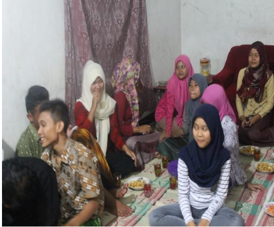
Gambar 42. Nonton bareng oleh pemuda dan pemudi Sembeng II