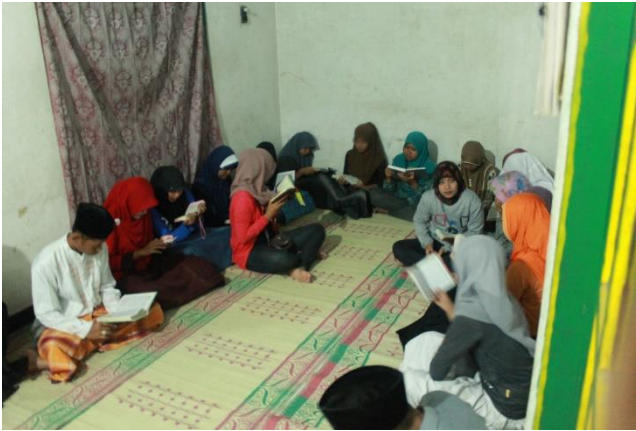
Gambar 46. Tadarus Al Qur'an bersama pemuda dan pemudi Dusun Sambeng II