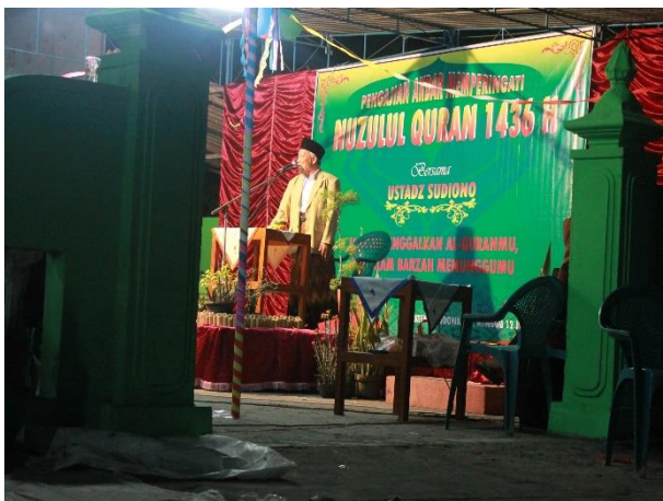
Gambar 44. Nuzulul Qur'an dengan tema Talibul Qilmi