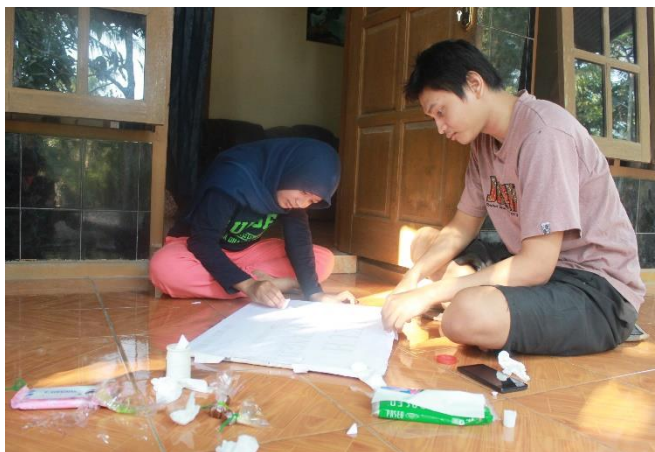
Gambar 18. Pembuatan plangisasi