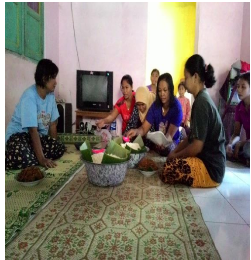
Gambar 51. Kenduri di salah satu rumah warga dusun Sambeng II