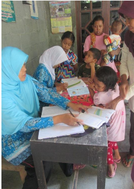
Gambar 33. Pendampingan Admin POSYANDU