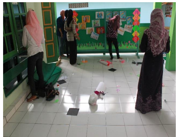
Gambar 30. Pembaharuan mading oleh TIM KKN 2044 dibantu dengan santri TPA Darrusalam