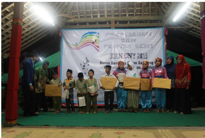
Gambar 38. Penyerahan hadiah lomba TPA Darrusalam oleh ketua KKN 2044