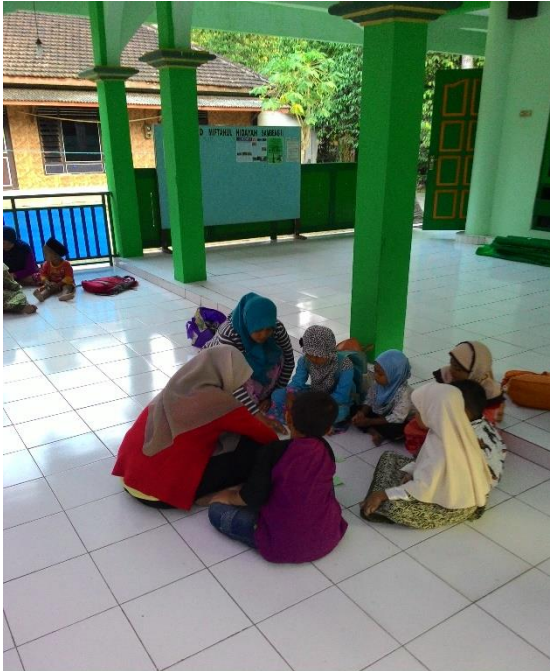
Gambar 27. Metode problem solving yang diberikan oleh santri dari TIM KKN 2044