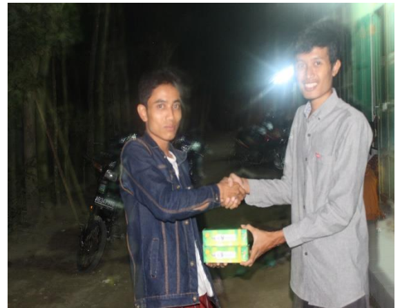
Gambar 17. Pemberian 2 buah lampu yang diberikan oleh ketua KKN 2044 untuk penerangan jalan di Sambeng II