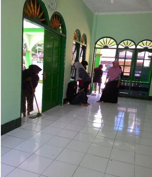
Gambar 13. Kerja bakti di masjid Miftahul Hidayah