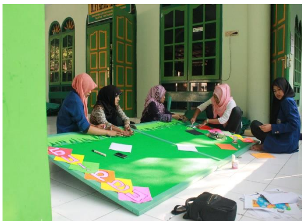
Gambar 29. Pembaharuan mading oleh TIM KKN 2044