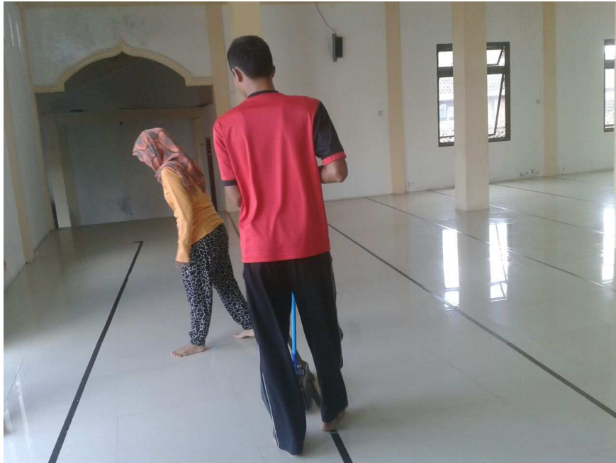
3) Kerja bakti lingkungan