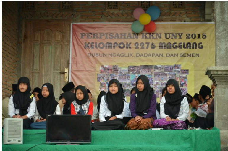
Gambar grup rebana pengisi acara perpisahan oleh tim KKN 2276