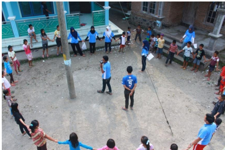
Gambar pengkondisian anak sebelum melaksanakan outbond