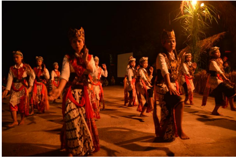
Gambar penampilan kesenian Cakar lele dari dusun Ngaglik