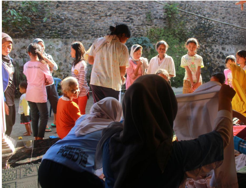
Gambar suasana bazar di posko 2276