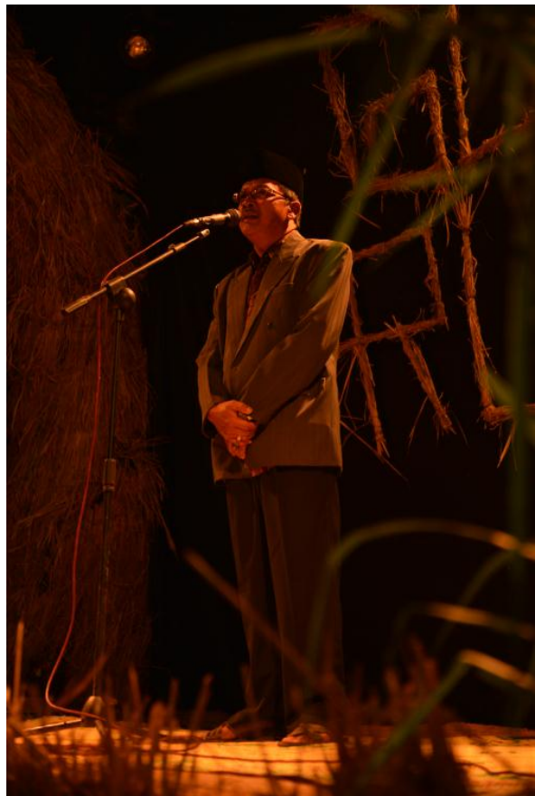
Gambar sambutan kepala desa krinjing pada saat pentas seni