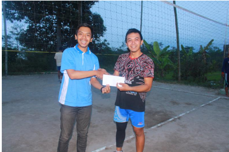
Gambar pemberian hadiah kepada pemenang lomba volley