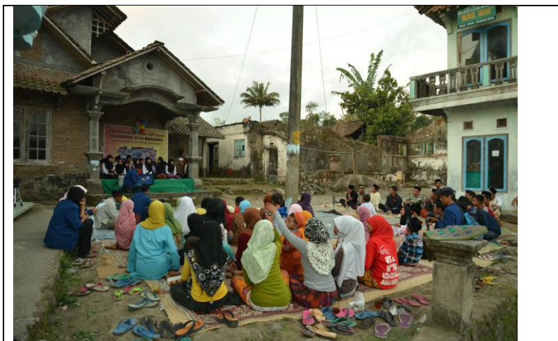
Gambar suasana saat perpisahan oleh tim KKN 2276