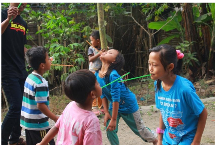
Anak-anak sedang melakukan permainan estafet karet