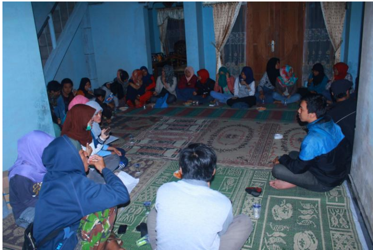
Gambar rapat persiapan pentas seni (Pensi)