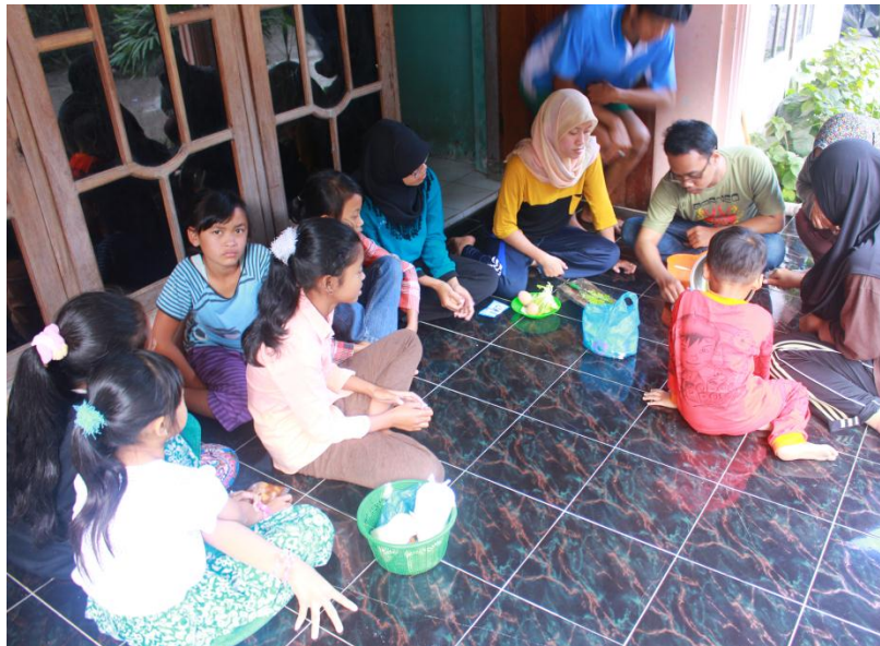
Gambar pelatihan pengolahan sayuran