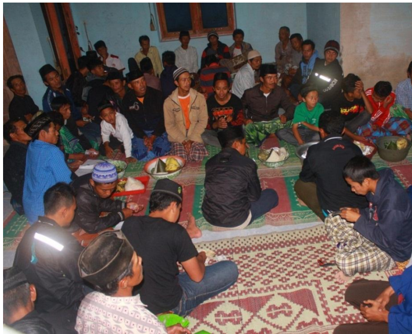
Gambar buka bersama warga dilanjutkan kenduri selikuran