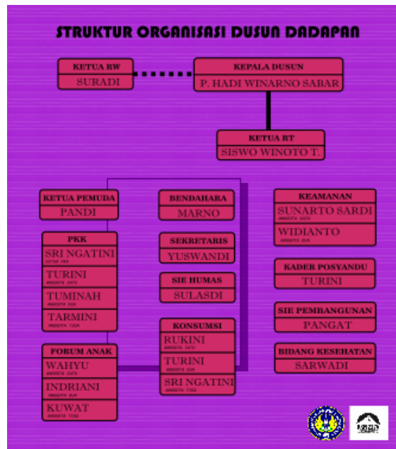
File struktur organisasi