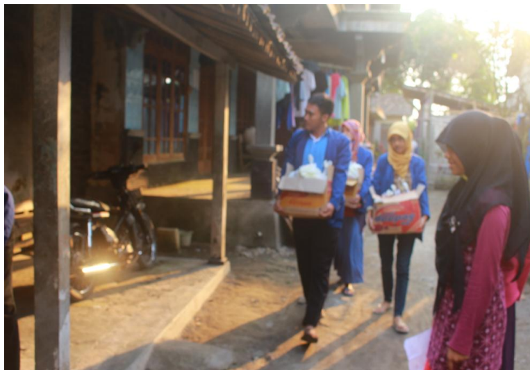
Gambar pembagian bakti sosial ke rumah warga