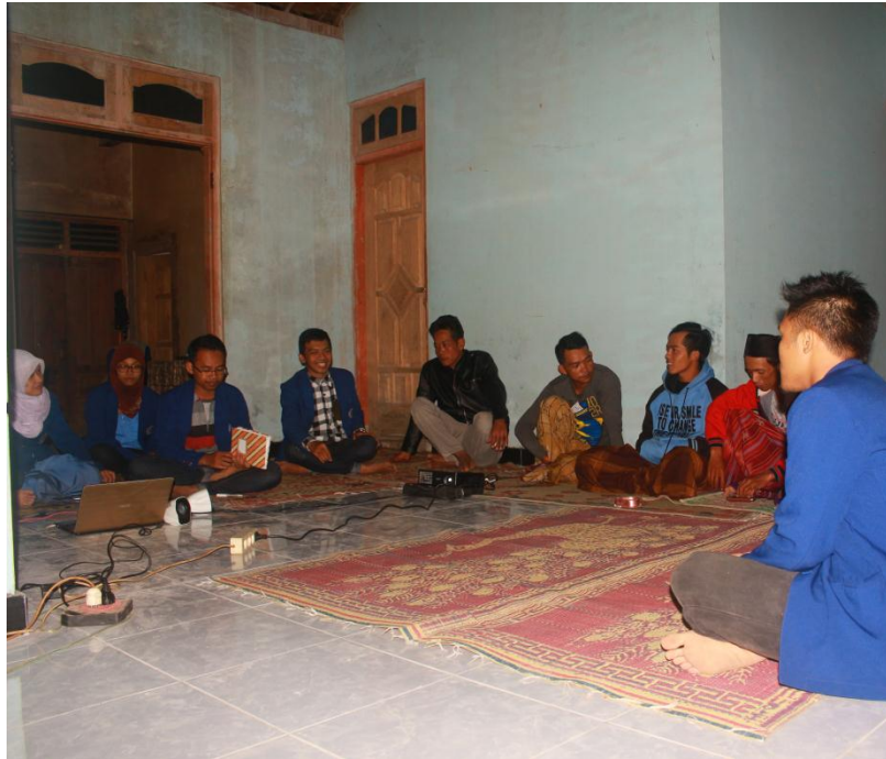
Gambar pelatihan pembuatan proposal dan sponsorship