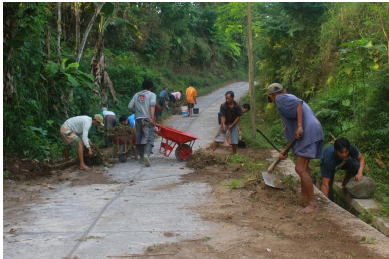
Warga sedang kerja bakti dalam rangka mengikuti lomba kebersihan RT