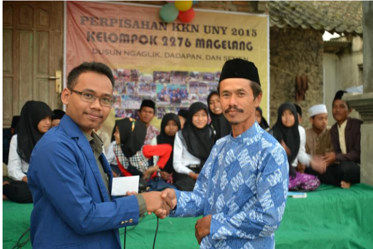
Gambar penyerahan hadiah pemenang lomba kebersihan RT