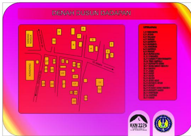
File denah dusun dadapan