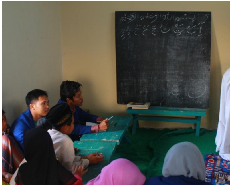
Gambar Lomba praktik sholat sebagai salah satu rangkaian lomba TPA