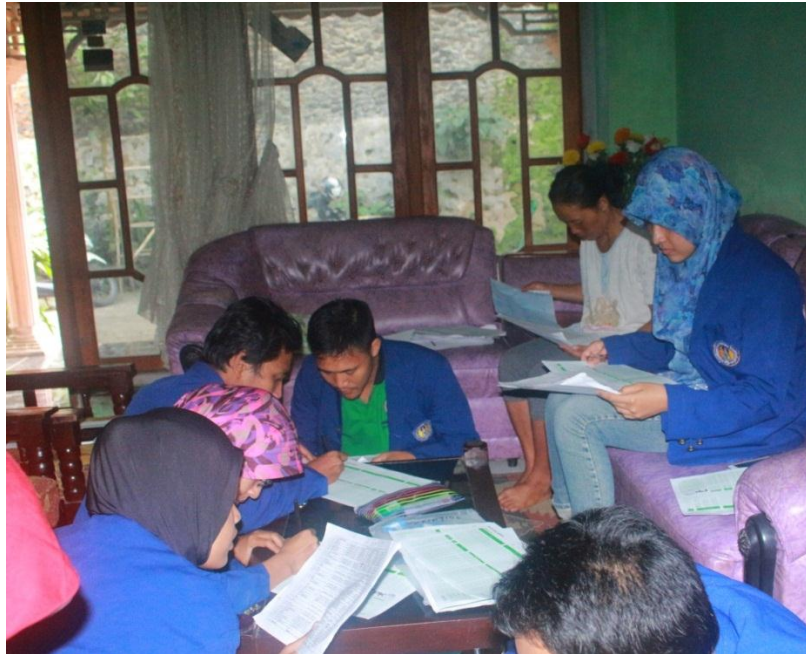
Gambar mahasiswa melakukan pendataan dengan bantuan kader PKK