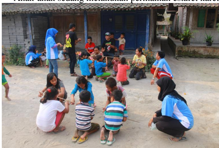
Anak-anak sedang melakukan permainan bambu gila