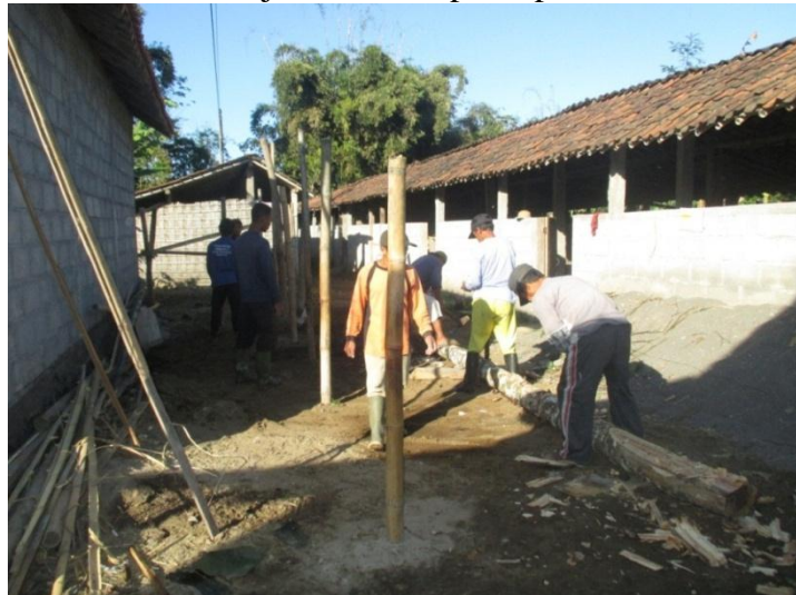
Gambar kerja bakti membuat atap gudang kelompok kandang tani ternak Dadapan