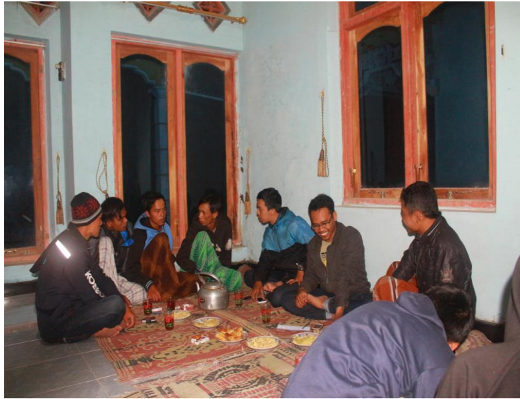
Gambar pelatihan organisasi dusun Ngaglik