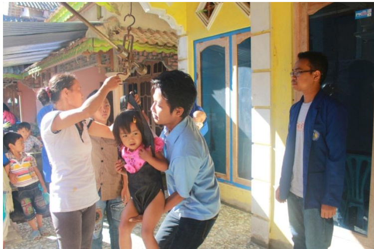
Gambar Mahasiswa KKN membantu penimbangan balita