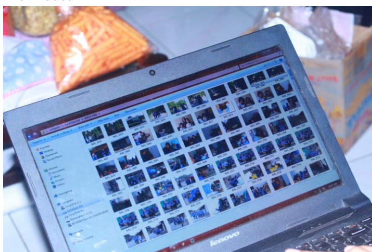
Gambar proses pemilihan file foto dan video yang akan digunakan untuk membuat profil dusun