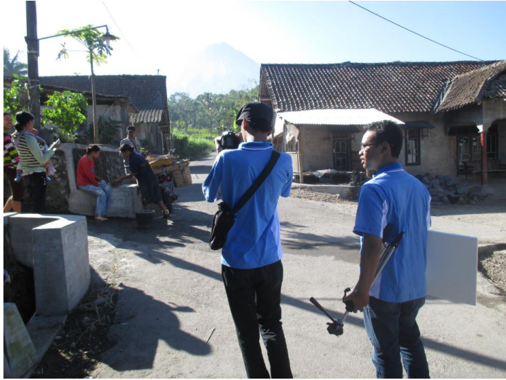
Gambar proses pengambilan gambar untuk profil dusun