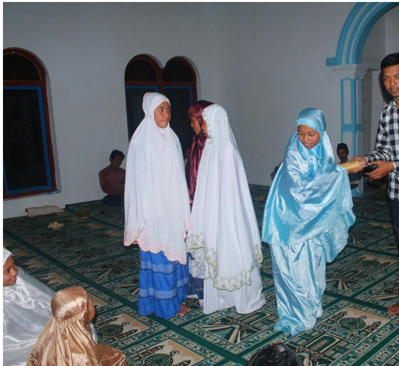
Gambar penyerahan hadiah lomba TPA