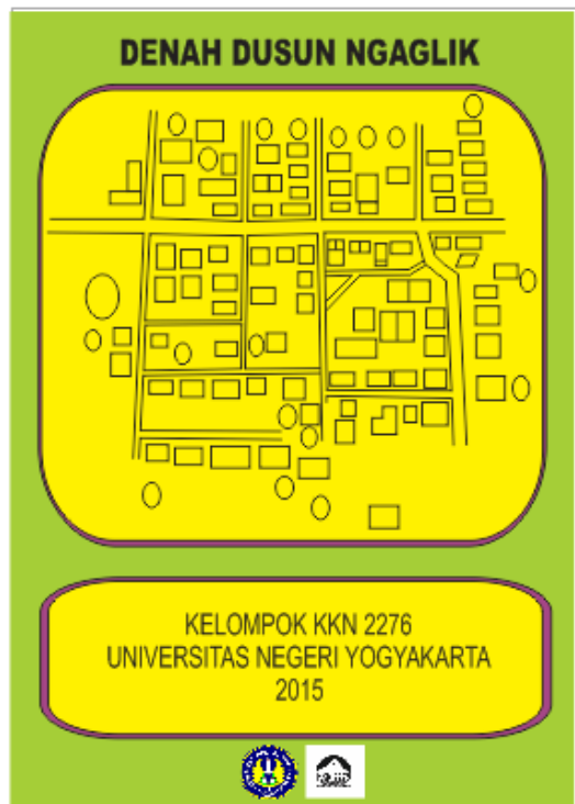
File denah dusun ngaglik