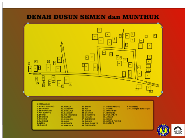
File corel denah dusun semen dan munthuk