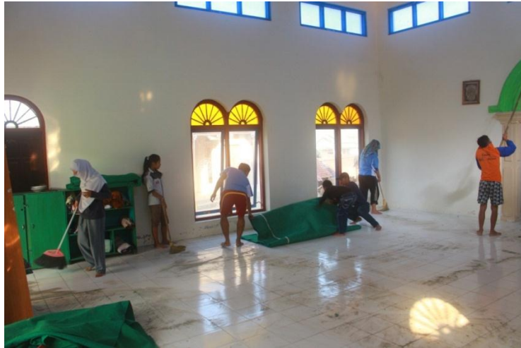
Gambar suasana kerja bakti mempersiapkan Idul fitri