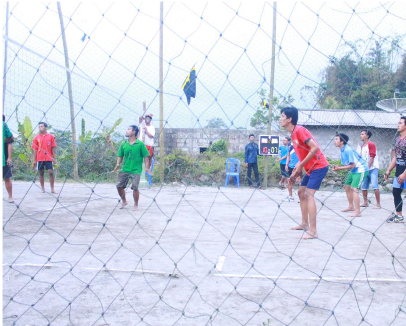
Gambar pertandingan volly