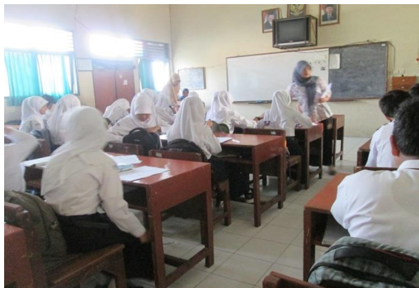
Observer sedang membagi Angket dan Soal kepada siswa