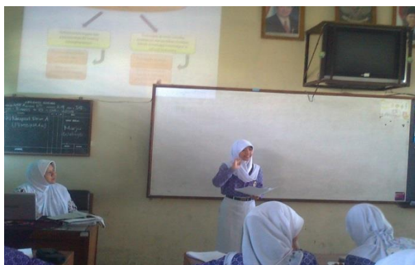
Siswa sedang presentasi tentang materi dalam Peta Konsep yang ditampilkan oleh guru