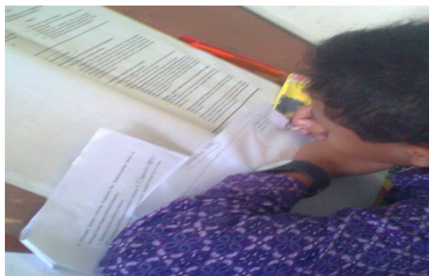
Siswa sedang menggambar Peta Konsep