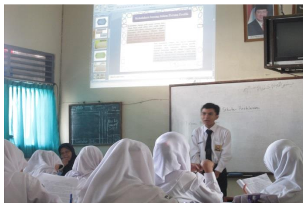
Siswa sedang presentasi mengenai materi pelajaran yang telah dirangkumnya