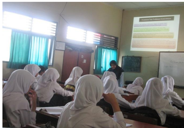
Siswa tampak tidak fokus memperhatikan materi pelajaran yang ditampilkan oleh Guru melalui Power Point