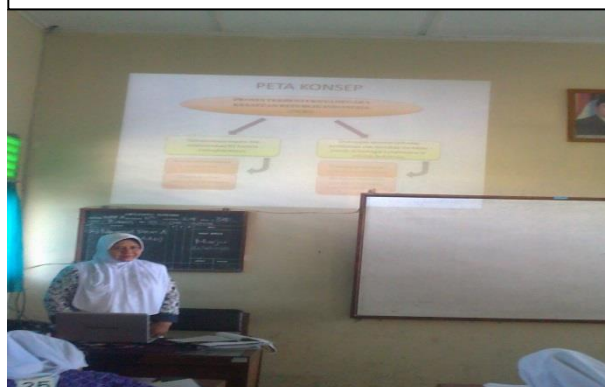
Guru sedang menerangkan materi pelajaran dengan peta konsep yang ditampilkan di Power Point