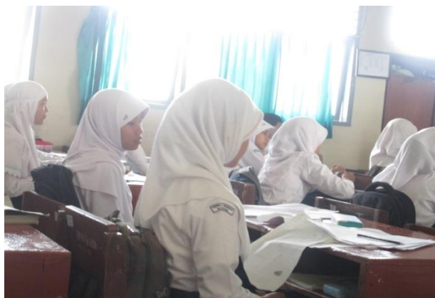
Siswa tampak tenang dan tidak berbuat gaduh