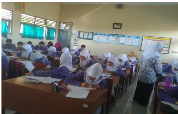
Siswa sedang mengerjakan Soal dan Angket