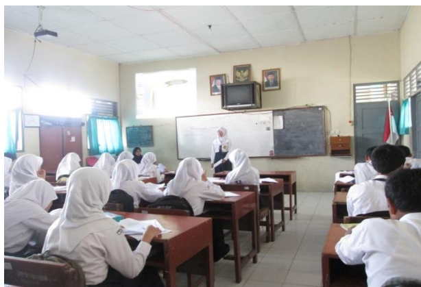
Siswa memperhatikan siswa lain yang sedang presentasi