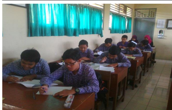
Siswa sedang mengerjakan Angket