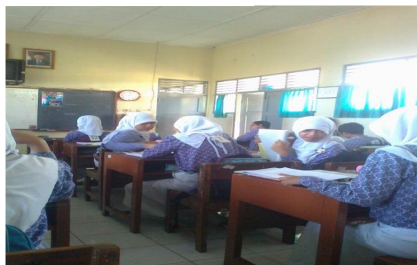
Beberapa siswa sedang bertanya kepada siswa lain tentang materi pelajaran yang sedang diajarkan