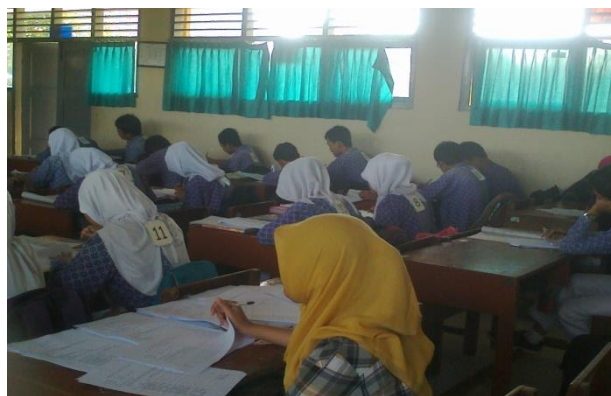
Observer sedang mengamati kegiatan belajar-mengajar