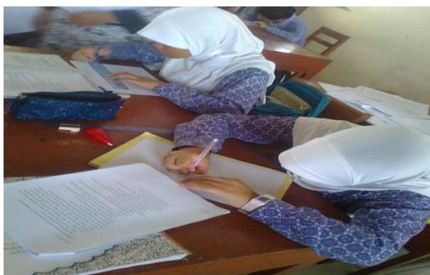
Siswa sedang mengerjakan Soal