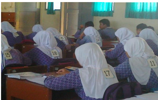
Siswa Tampak fokus memperhatikan pelajaran