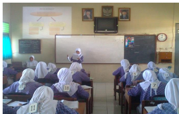
Siswa sedang presentasi tentang Peta Konsep yang telah dikembangkan dan dikreasi sendiri