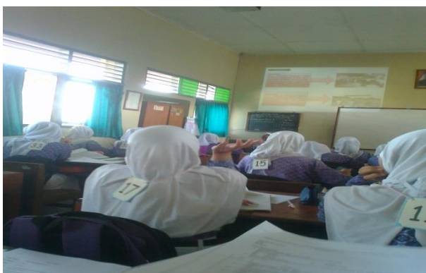
Siswa memperhatikan Slide Power Point yang ditampilkan oleh guru