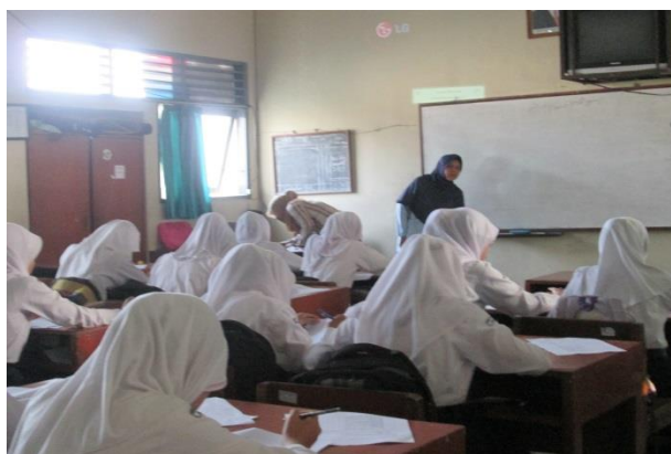
Guru sedang menjelaskan materi pelajaran