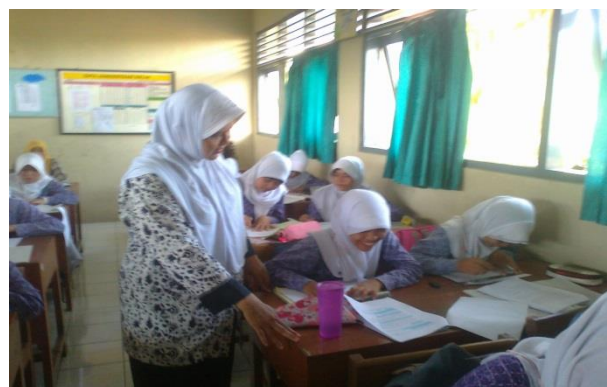
Guru mengecek dan mengarahkan siswa dalam mengerjakan Soal dan Angket