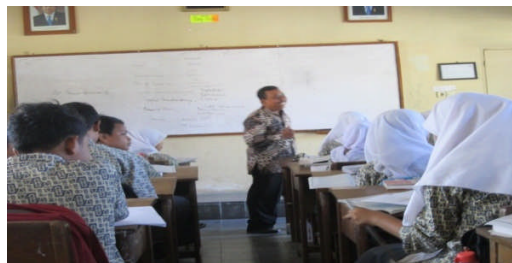
Suasana KBM di SMP N 2 Moyudan