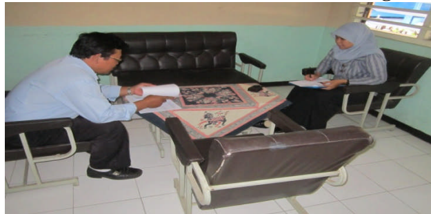
Dokumentasi Pelaksanaan Wawancara Guru SMP Muh. 1 Moyudan