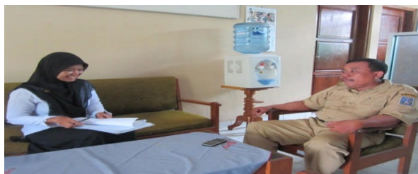
Dokumentasi Pelaksanaan Wawancara Dengan Guru di SMP N 2 Moyudan