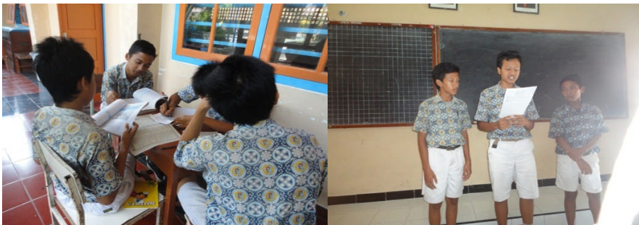
Suasana KBM di SMP Muh. 1 Moyudan