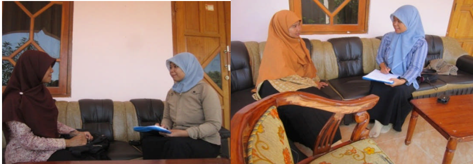
Dokumentasi Pelaksanaan Wawancara Guru SMP Pangudiluhur Moyudan