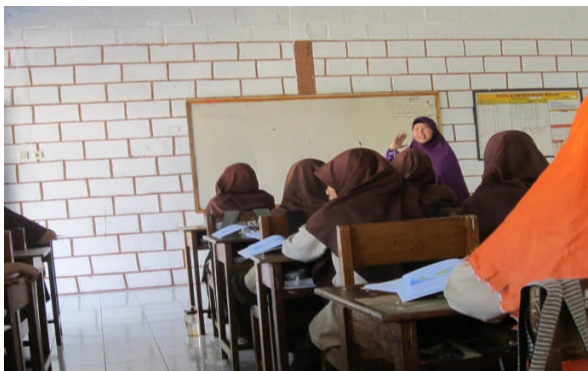
Fasilitas yang dapat digunakan di ruang kelas saat KBM berlangsung di SMP IT Bina Umat