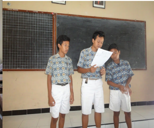
Fasilitas yang dapat digunakan di ruang kelas saat KBM berlangsung di SMP Pangudiluhur Moyudan