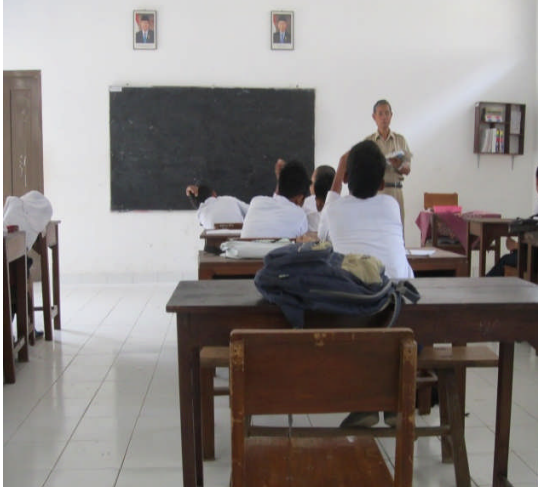
Fasilitas yang dapat digunakan di ruang kelas saat KBM berlangsung di SMP N 1 Moyudan