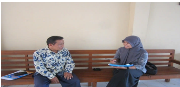
Dokumentasi Pelaksanaan Wawancara Guru SMP IT Bina Umat Moyudan