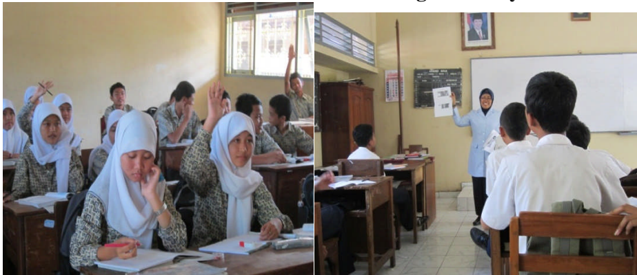
Suasana KBM di SMP Negeri 1 Moyudan