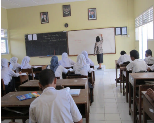
Fasilitas yang dapat digunakan di ruang kelas saat KBM berlangsung di SMP N 2 Moyudan