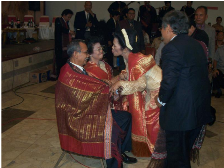
Gambar 4: Acara pemberian ulos oleh keluarga perempuan kepada mertua anaknya

kakaknya, banyak adiknya), Toropma nang boruna (Banyak pula anaknya) memiliki makna agar keluarga (gabungan dari keluarga perempuan dan keluarga laki-laki) tumbuh menjadi keluarga yang besar. Metafora ini berfungsi untuk saling memotivasi keluarga untuk tetap berkembang menjadi keluarga besar. Metafora 3.6 dan 3.7 di atas diungkapkan oleh pembawa acara pada saat acara pemberian ulos oleh keluarga perempuan kepada mertua anaknya. Hal tersebut seperti tampak pada gambar berikut.