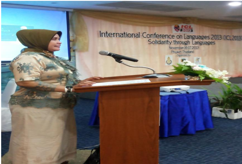
Peneliti memaparkan hasil penelitian pada seminar Internasional di Phuket, Thailand Pada tanggal 16-17 November 2013