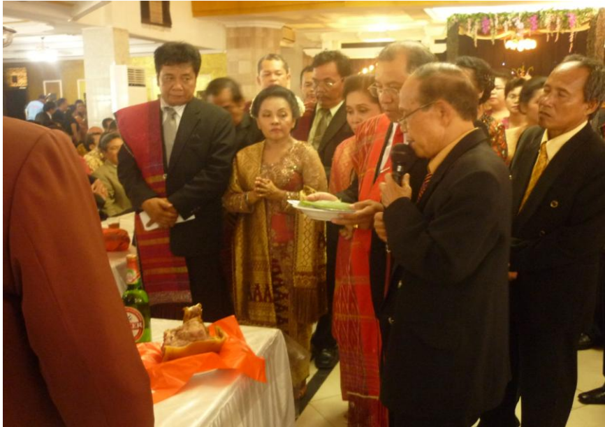
Gambar 3: Menyatakan kebersamaan dengan ungkapan metafora (3.3. 3.4 dan 3.5) pada saat acara adat Batak

Ungkapan metafora yang telah diuraikan di atas digunakan secara turun temurun dari satu generasi ke generasi berikutnya, dan sampai saat ini masih digunakan pada acara adat Batak Toba. Hal ini menunjukkan bahwa masyarakat Batak Toba sangat menghargai nilai-nilai adat yang diturunkan oleh tetua masyarakatnya kepada generasi selanjutnya.