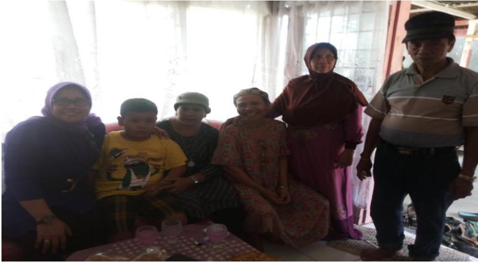
Foto bersama keluarga nara sumber yang bertempat tinggal di Siantar