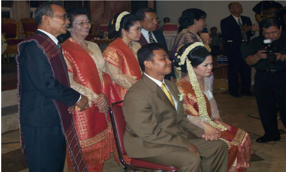
Gambar 1: Pengantin mendengarkan harapan orang tua melalui ungkapan metafora fungsi ekspresif pada metafora 1.1 dan 1.2 (foto ini merupakan foto peneliti pada saat mengikuti upacara pernikahan adat Batak Toba pada bulan Juli 2013)