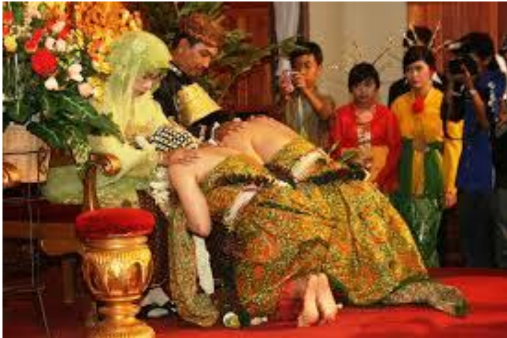
Gambar 5: Acara sungkeman adat Jawa, orang tua memberi nasihat dengan menggunakan ungkapan metafora ( biasanya pembawa acara yang menjadi wakil orang tua untuk mengutarakan ungkapan metafora)

tampak dan diingat dalam kehidupan bermasyarakat. Oleh karena itu, dalam budaya Jawa setiap individu akan selalu menjaga diri dan selalu berbuat baik serta menghindari dari perbuatan yang tidak baik. Ujaran metafora tersebut biasanya diberikan pada saat memberi nasehat kepada pengantin baru pada acara sungkeman ke orang tua oleh kedua mempelai seperti gambar berikut.