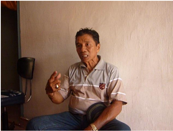
Ketika melakukan wawancara dan validasi data dengan salah satu nara sumber