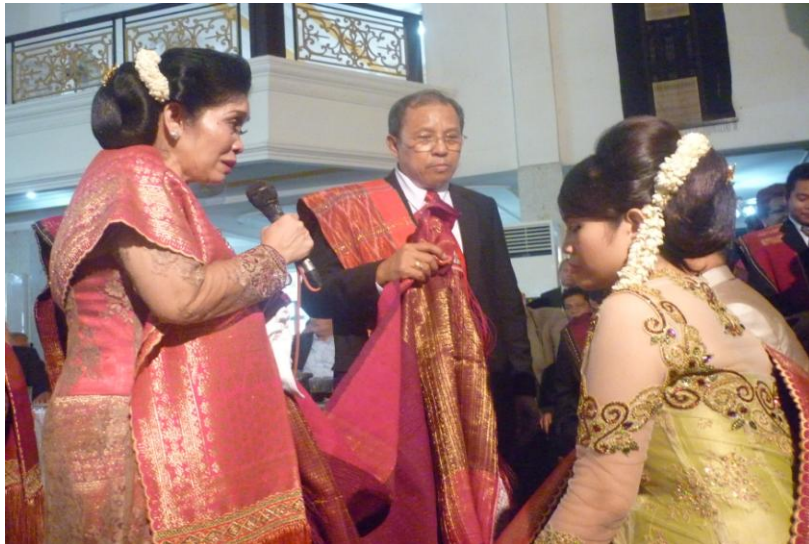
Gambar 2: Acara pemberian ulos dan pemberian nasehat dalam bentuk metafora pada anaknya (pengantin baru)

Pada acara pernikahan, orang tua pihak perempuan memberi nasihat (perintah) agar anak perempuannya menghormati mertua sebagai orang tua. Posisi orang tua sebagai orang yang sangat dihargai dan dapat memberi berkat yang baik bagi anaknya. Masyarakat Batak Toba sangat mendambakan 'hatuaon martua' , (berusia panjang). Hal ini diyakini akan terwujud jika mereka bersikap santun kepada orang tua. Dengan kata lain, masyarakat Batak Toba wajib menghormati orang tua yang dianggap sebagai wakil 'Debata' (Tuhan) yang memberi 'martua' (umur panjang). Nasihat dalam bentuk metafora ini diberikan pada saat orang tua memberi ulos kepada mempelai berdua (pengantin baru), seperti yang tampak pada gambar berikut (yang merupakan foto pribadi peneliti).