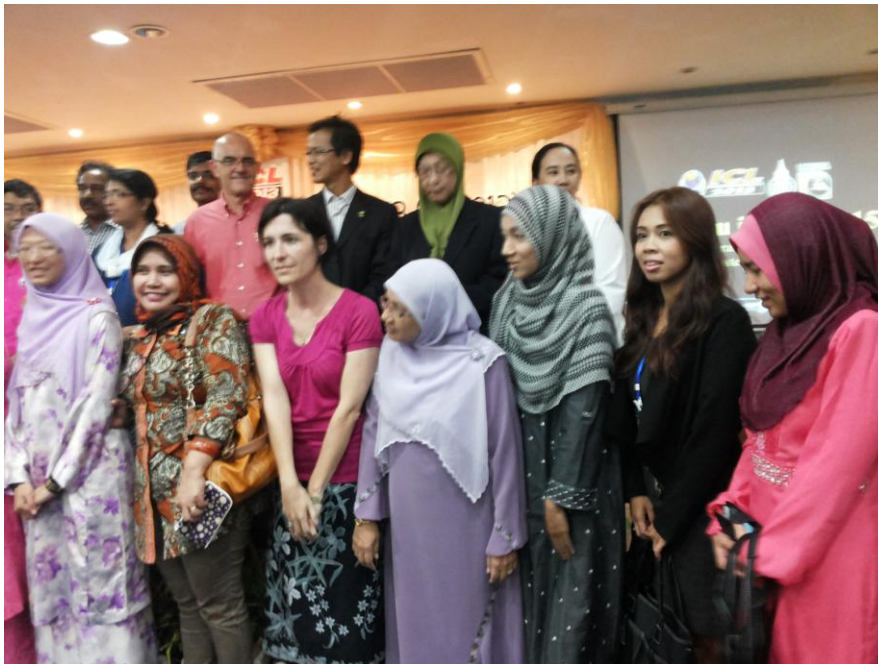
Sebagian dari peserta seminar yang berasal dari 20 negara dan diikuti oleh 115 peserta