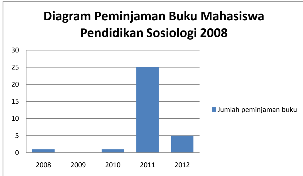
Diagram 1. Peminjaman buku mahasiswa Pendidikan Sosiologi 2008

Sejarah oleh mahasiswa Pendidikan Sosiologi 2008 yang minim, tingkat pemanfaatan yang rendah ini dapat dilihat dari table berikut: