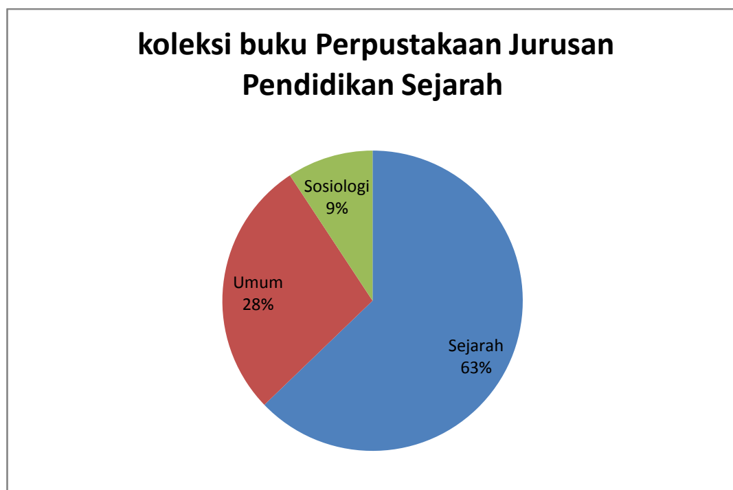
Diagram 3. Jumlah koleksi buku Perpustakaan Jurusan Pendidikan Sejarah

Selain itu dari daftar koleksi buku Perpustakaan Jurusan Pendidikan Sejarah dapat dilihat jumlah koleksi bahan pustaka yang dimiliki oleh perpustakaan ini sebagai berikut: