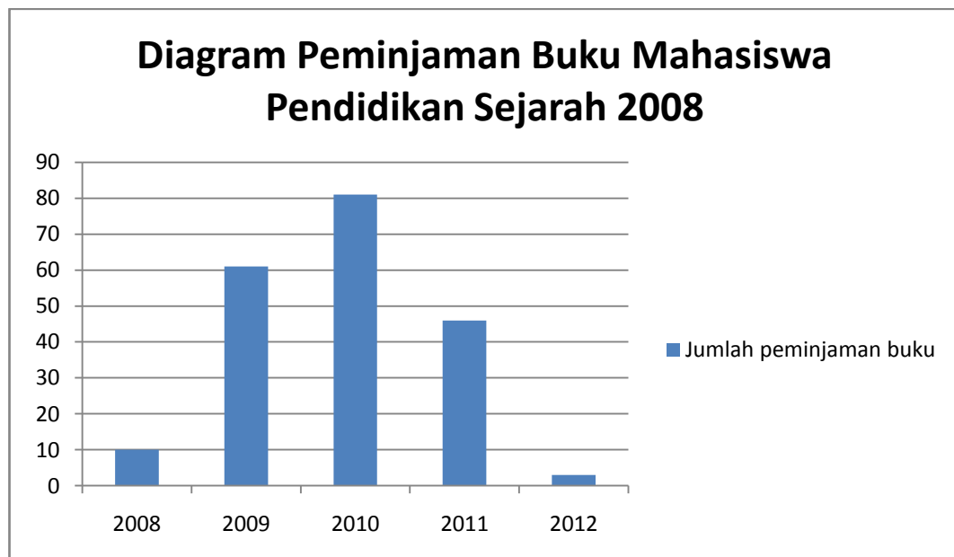
Diagram 2. Peminjaman buku mahasiswa Pendidikan Sejarah 2008