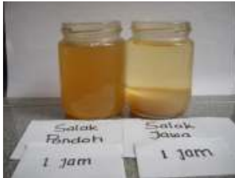
Gambar 9. Proses penjernihan minuman salak dengan madu selama didiamkan 1 jam (menit ke-0, 10, 20, 30, dan 60)

Dari Gambar 9 bisa diketahui bahwa minuman salak dengan madu yang dibuat dari salak Pondoh tidak bisa menghasilkan minuman yang jernih, tetapi tetap keruh meskipun didiamkan. Dengan hasil ini, sebenarnya salak Jawa bisa digalakkan lagi penanamannya jika diinginkan akan dibuat minuman sari buah salak, karena hasilnya bisa jernih, rasanya pun lebih mantap karena aroma salak lebih terasa.