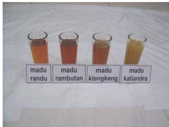
Gambar 1. Visualisasi warna madu randu, rambutan, kelengkeng, dan kaliandra

Penelitian sifat fisikokimia madu monoflora telah dilakukan oleh Chayati (2008). Sifat fisika yang diamati adalah kadar air, warna, dan viskositas, sedangkan sifat kimianya adalah pH, komponen fenolat total, dan jenis dan kadar gula yang hasilnya bisa dilihat pada Gambar 1 dan Tabel 5.