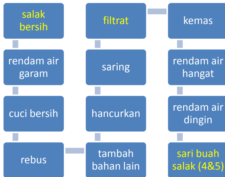
Gambar 6. Proses pembuatan minuman sari buah salak percobaan 4 dan 5

Perbedaan percobaan 4 dan 5 adalah pada proses perebusan, percobaan 4 pada saat perebusan panci tanpa tutup, sedangkan percobaan 5 menggunakan tutup kaca pada panci saat proses perebusan. Pada percobaan 1 sampai 3 perebusan juga tanpa tutup panci. Percobaan 4 dan 5 ini menggunakan buah salak dengan konsentrasi 7,5% dengan hasil terlihat pada tabel di bawah ini.