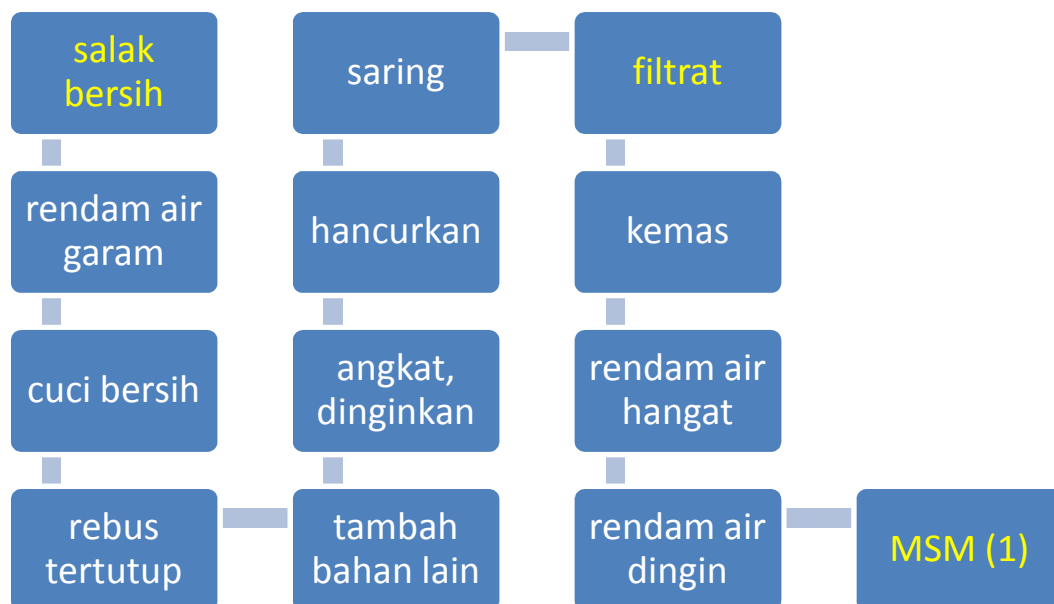
Gambar 7. Proses pembuatan minuman salak dengan madu percobaan 1

Percobaan 2 dan 3 menggunakan bahan yang sama dengan percobaan 1, perbedaan terletak pada saat memasukkan madu kelengkeng. Pada percobaan 2, madu masuk saat akan diangkat (setelah mendidih), sedangkan pada percobaan 3 madu masuk saat proses penghancuran. Hasil pengamatan percobaan 1, 2, dan 3 bisa dilihat pada tabel d bawah ini.