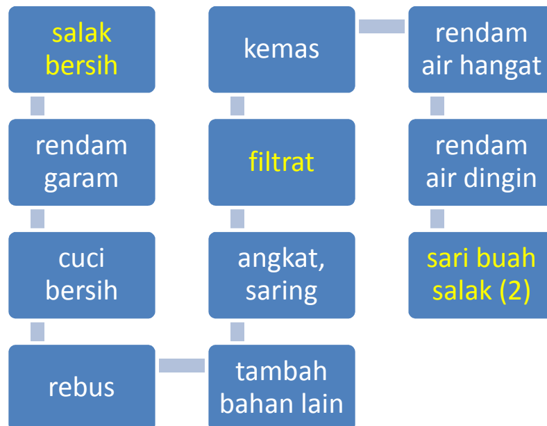
Gambar 4. Proses pembuatan minuman sari buah salak percobaan 2

Salak pondoh bersih 100 g Garam 5 g Air bersih (Aqua) 100 ml Air bersih (Aqua) 1 L Gula pasir 100 g Asam sitrat 1 g Na benzoat 1 g