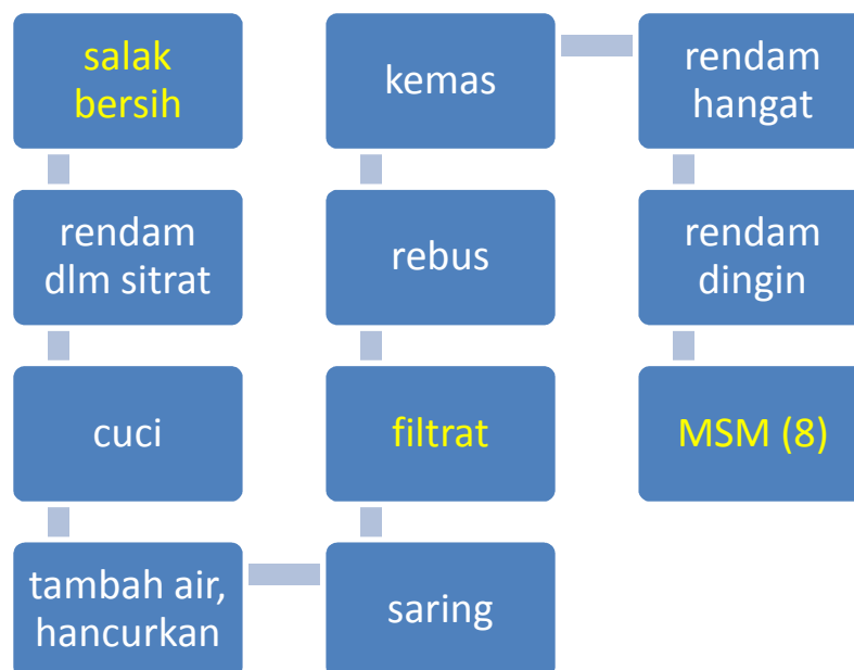
Gambar 8. Proses pembuatan minuman salak dengan madu percobaan 8