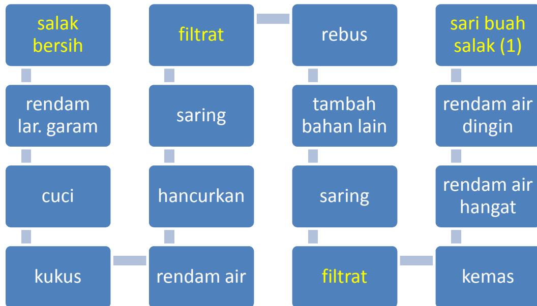
Gambar 3. Proses pembuatan minuman sari buah salak percobaan 1