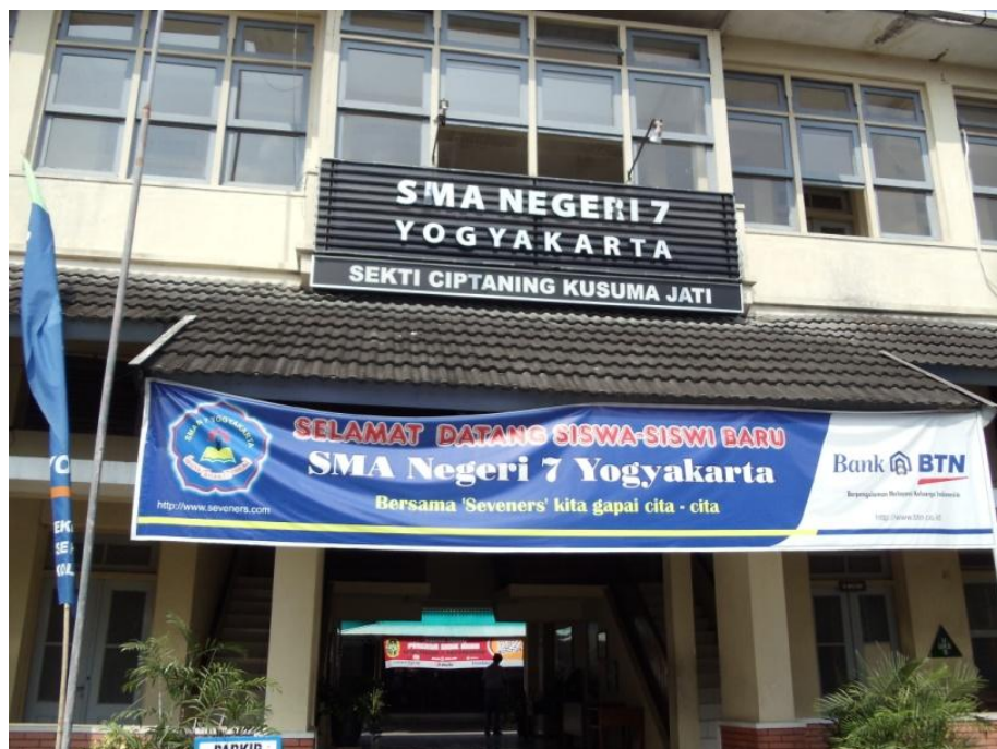
Gb. I Kondisi SMA Negeri 7 Yogyakarta tanggal 27 April 2011