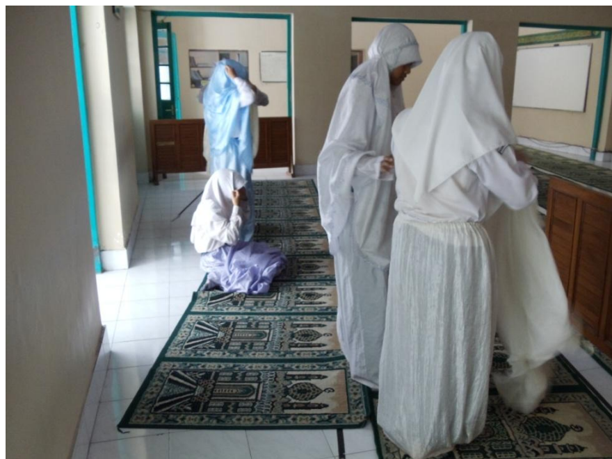
Gb. VII Siswi yang sedang melaksanakan sholat Dhuha tanggal 5 Mei 2011