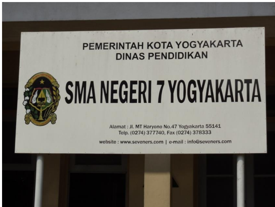
Foto Peserta didik, Pendidik dan lingkungan SMA N 7 Yogyakarta