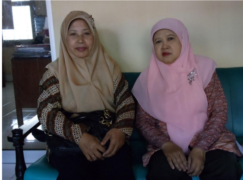
Gb. IV Pemakaian jilbab Ibu Guru tanggal 11 Mei 2011