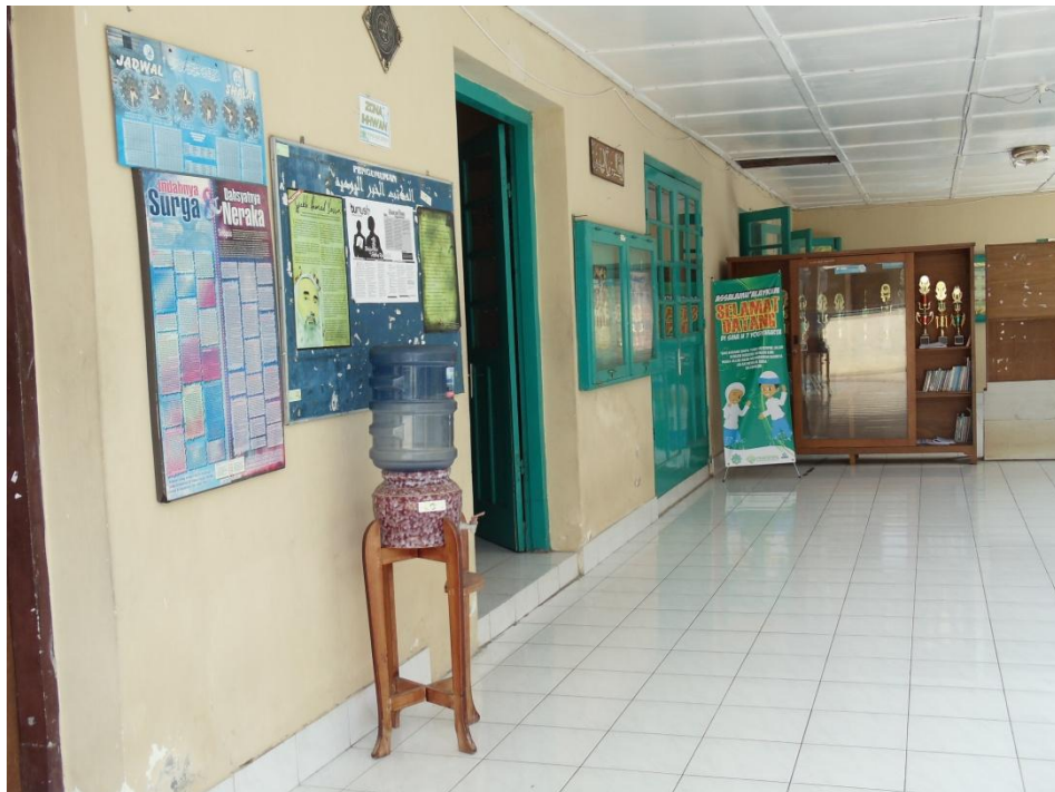
Gb. VIII Kondisi Mushola Sekolah tanggal 27 April 2011