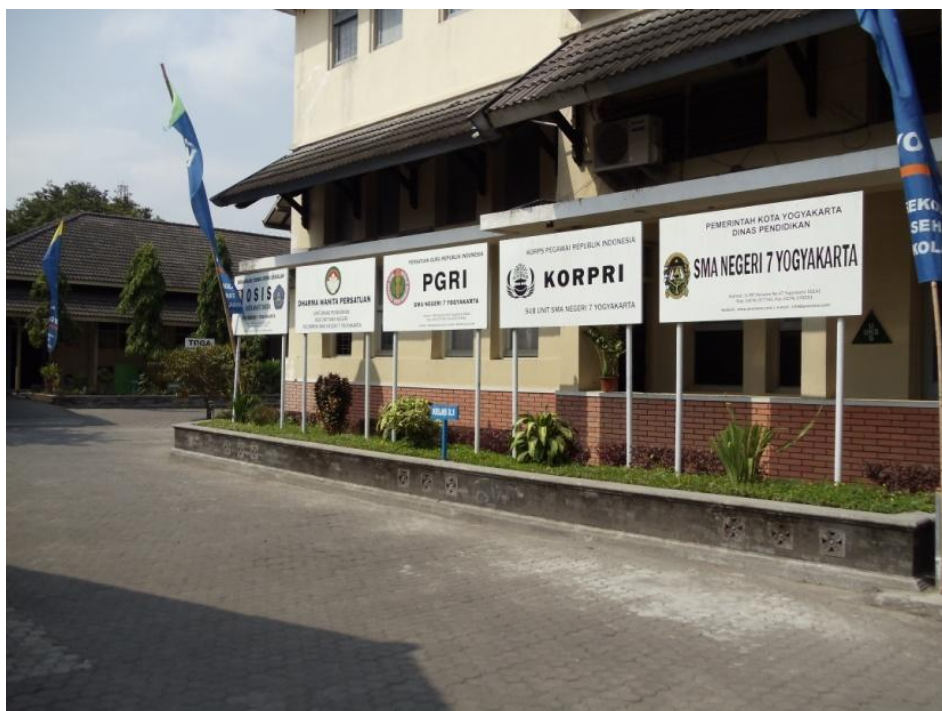
Gb. IX Kondisi SMA Negeri 7 Yogyakarta tanggal 27 April 2011