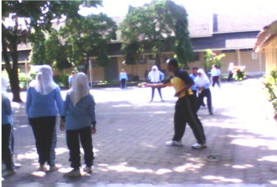
Gb. VI Pelajaran Olah Raga siswi muslim menggunakan jilbab dan berseragam panjang, sedangkan yang non muslim menggunakan seragam panjang tanggal 5 Mei 2011