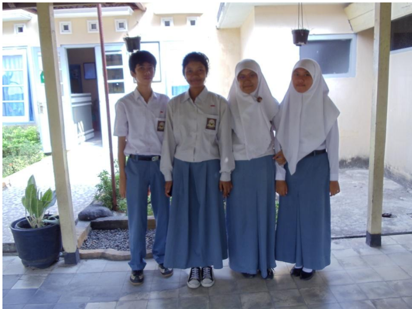
Gb. III Peserta didik kelas X setelah wawancara tanggal 11 Mei 2011