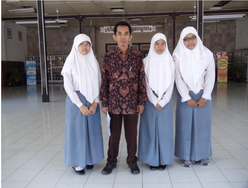
Gb. II Siswi saat berdiskusi dengan salah satu Guru di Bangsal Wiyata Mandala tanggal 11 Mei 2011