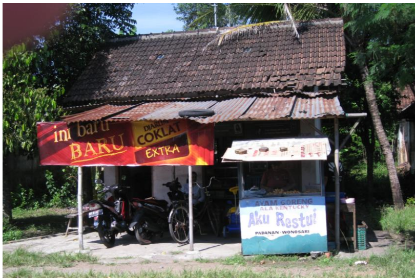
Gambar 2. Warung sederhana milik ibu SR