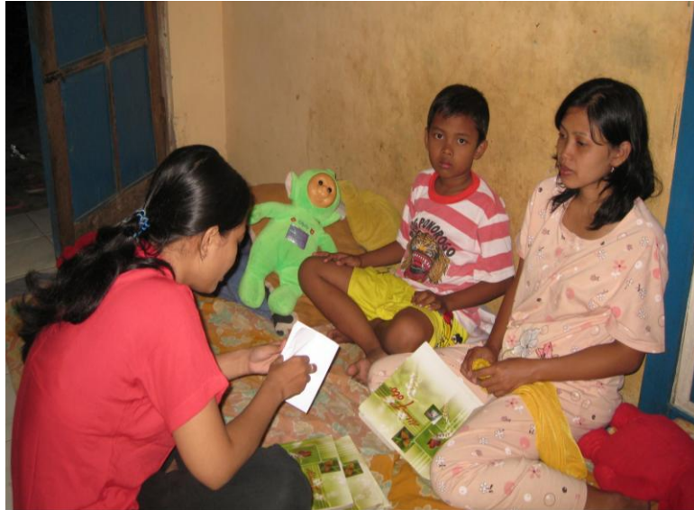
Gambar 3. wawancara dengan salah satu informan