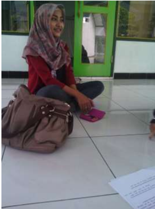
Gambar 8. Salah satu pengguna smartphone Blackberry , 20 Juni 2013