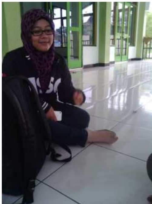
Gambar 7. Salah satu pengguna smartphone iPhone , 20 Juni 2013