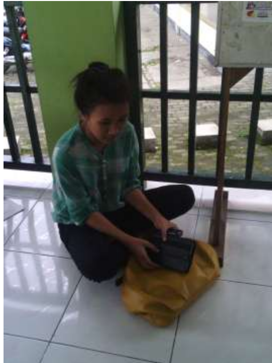
Gmabr 6. Salah satu pengguna smartphone Android , 20 Juni 2013