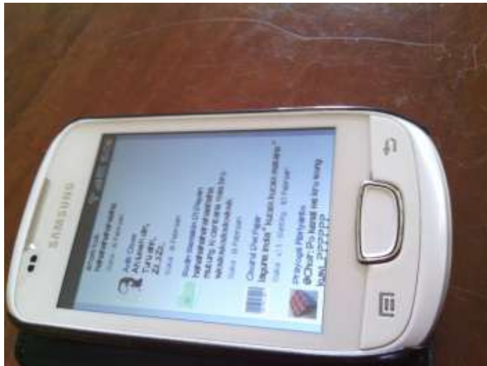
Gambar 2. Samsung Android Froyo, 20 Maret 2013