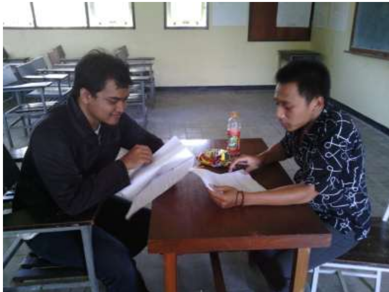
Gambar 5. Wawancara dengan salah satu pengguna smartphone Android , 20 Maret 2013