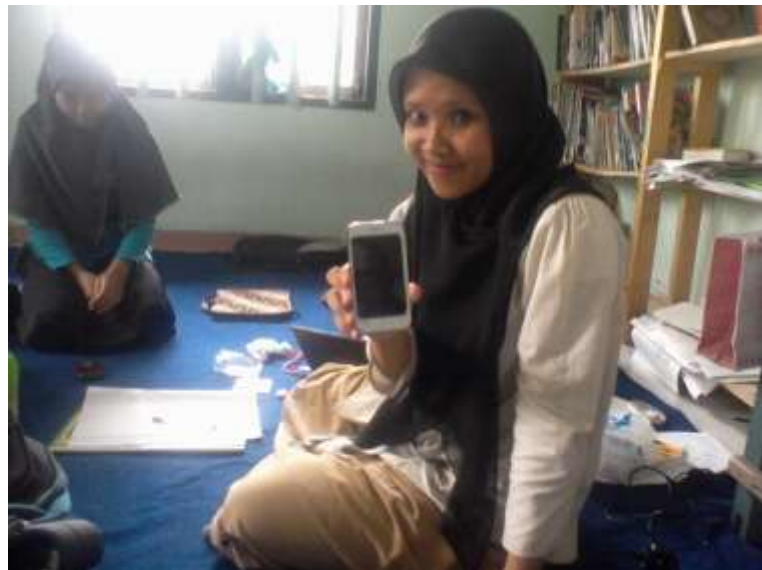
Gambar 9. Salah satu pengguna smartphone Android , 20 Juni 2013 ( Dokumentasi Pribadi )