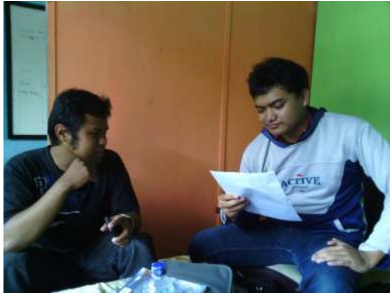
Gambar 4. Wawancara dengan salah satu pengguna smartphone Blackberry , 10 Juni 2013