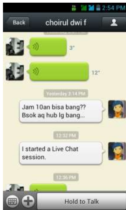
Gambar 10. Komunikasi melalui aplikasi IM Wechat , 20 Juni 2013 (Dokumentasi Pribadi)