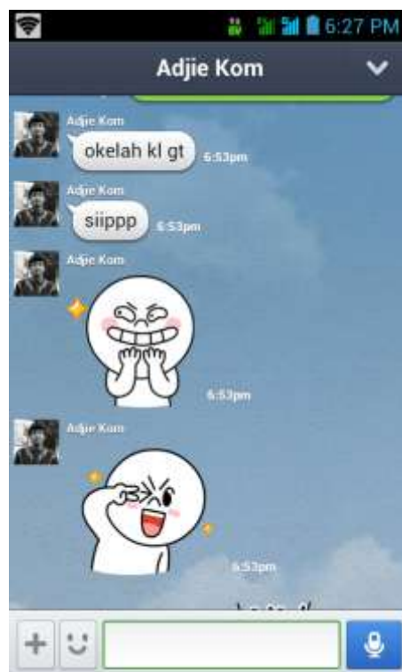
Gambar 11. Emoticon pada aplikasi IM , dan sosial media Line 20 Juni 2013