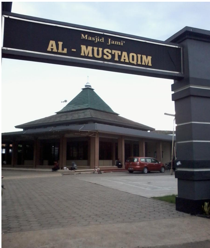
Gambar 1 Masjid Jami Al-Mustaqim