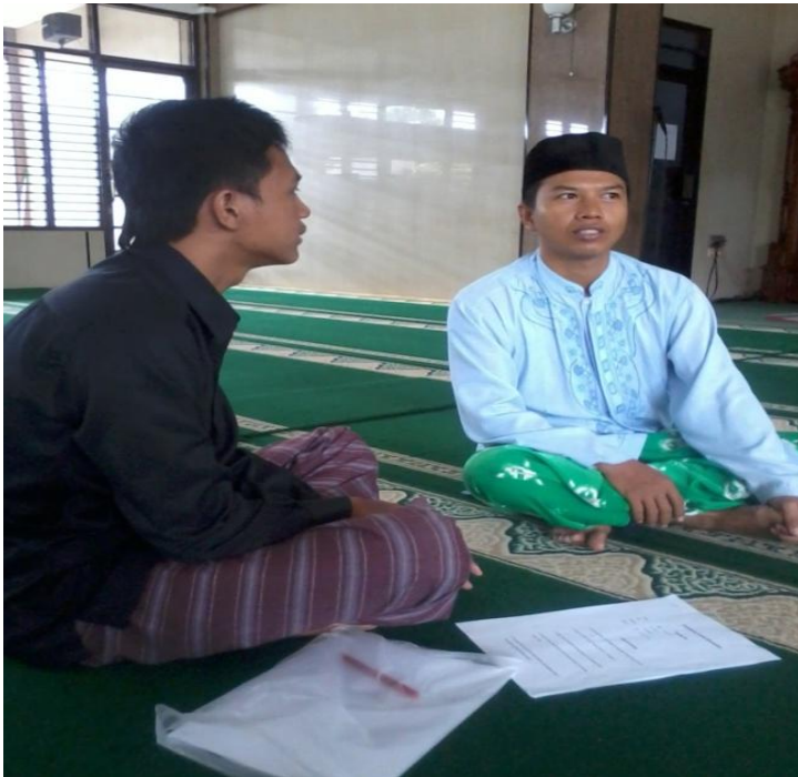
Gambar 4 Wawancara dengan masyarakat