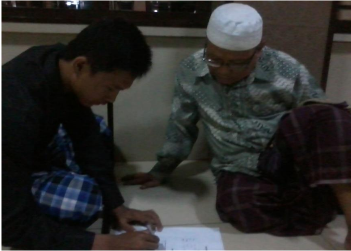
Gambar 3 Wawancara dengan tokoh masyarakat