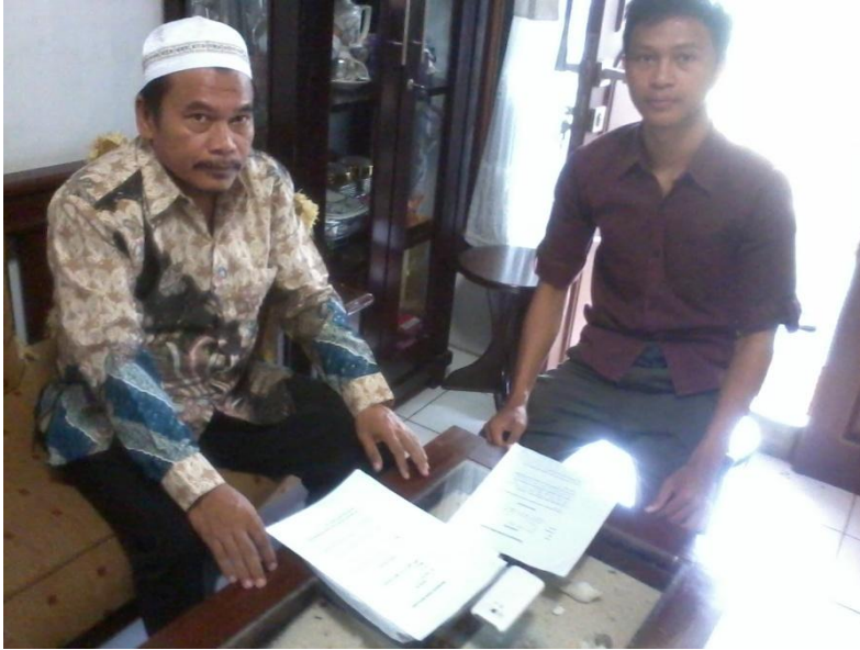
Gambar 2 Wawancara dengan ketua DKM Al-Mustaqim