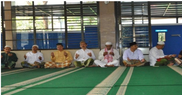
Gambar 17 Kegiatan tahlil bersama