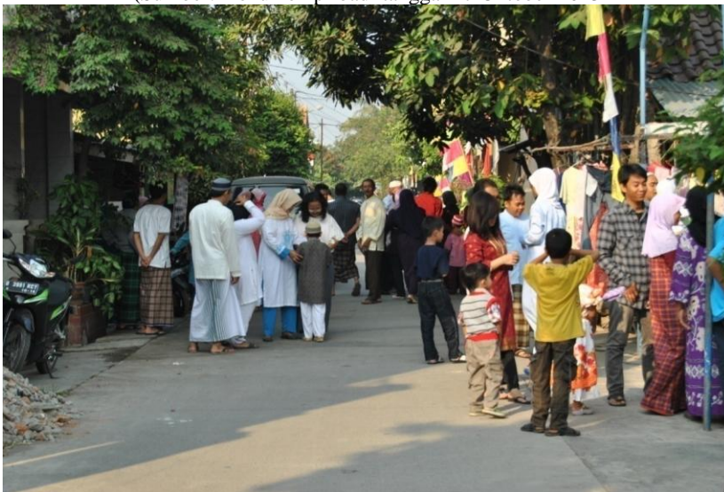
Gambar 14 Silaturahmi masyarakat Bulak Kapal Permai setelah melaksanakan soalt Idul Fitri