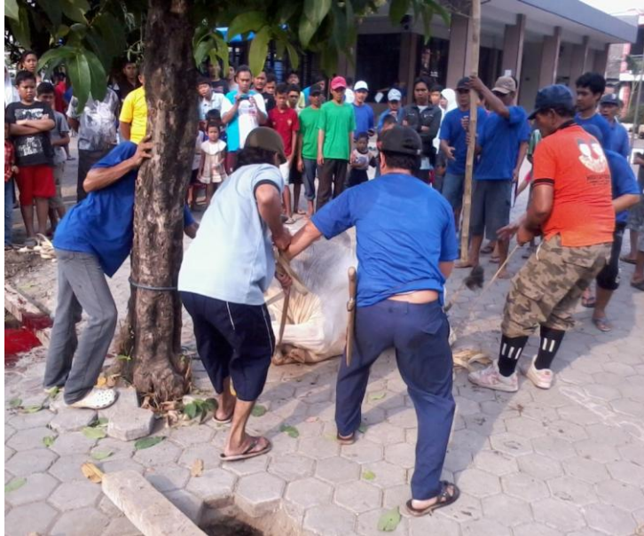
Gambar 12 Prosesi penyembelihan hewan kurban