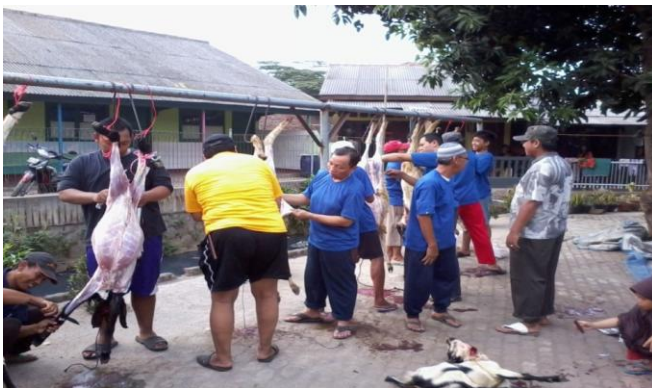
Gambar 11 Masyarakat bekerja sama dalam proses menguliti hewan kurban