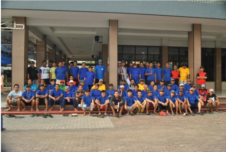
Gambar 13 Panitia tabungan kurban