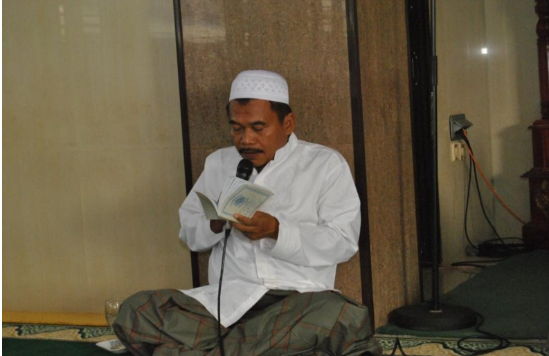
Gambar 15 Ketua DKM sedang memimpin kegiatan tahlil dan zikir bersama