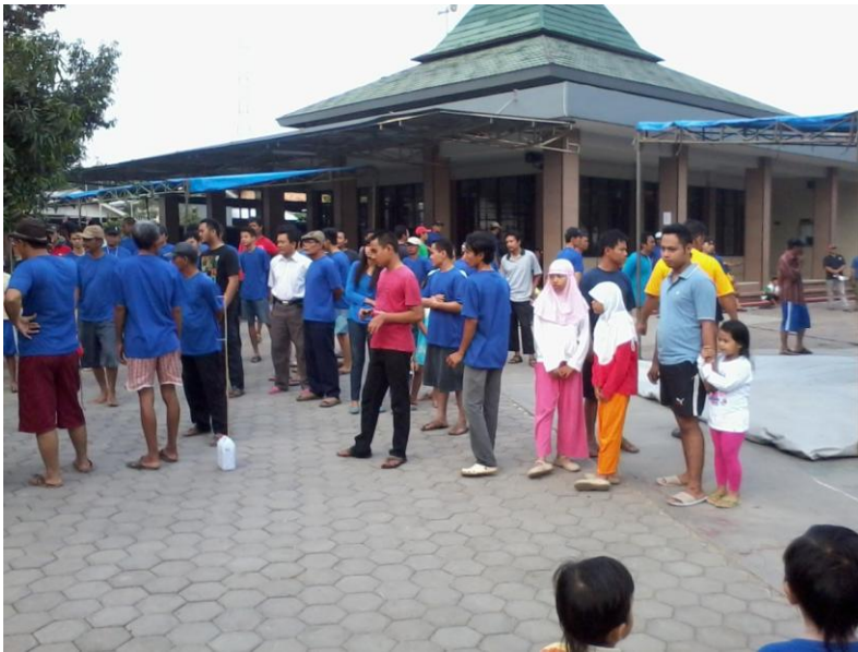
Gambar 10 Masyarakat sedang menyaksikan proses penyembelihan hewan kurban