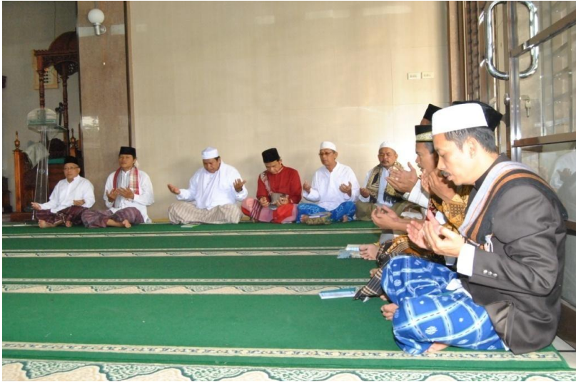
Gambar 16 Doa bersama se usai tahlil