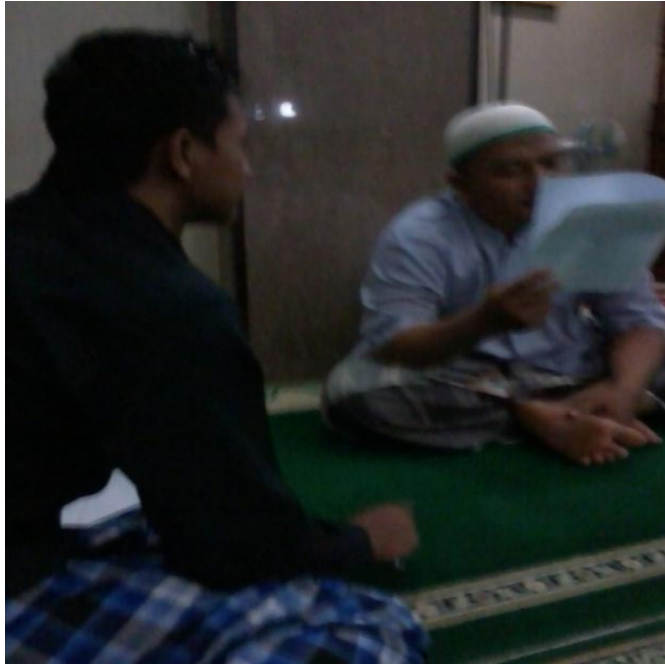
Gambar 5 Wawancara dengan salah satu pengurus DKM Al-Mustaqim