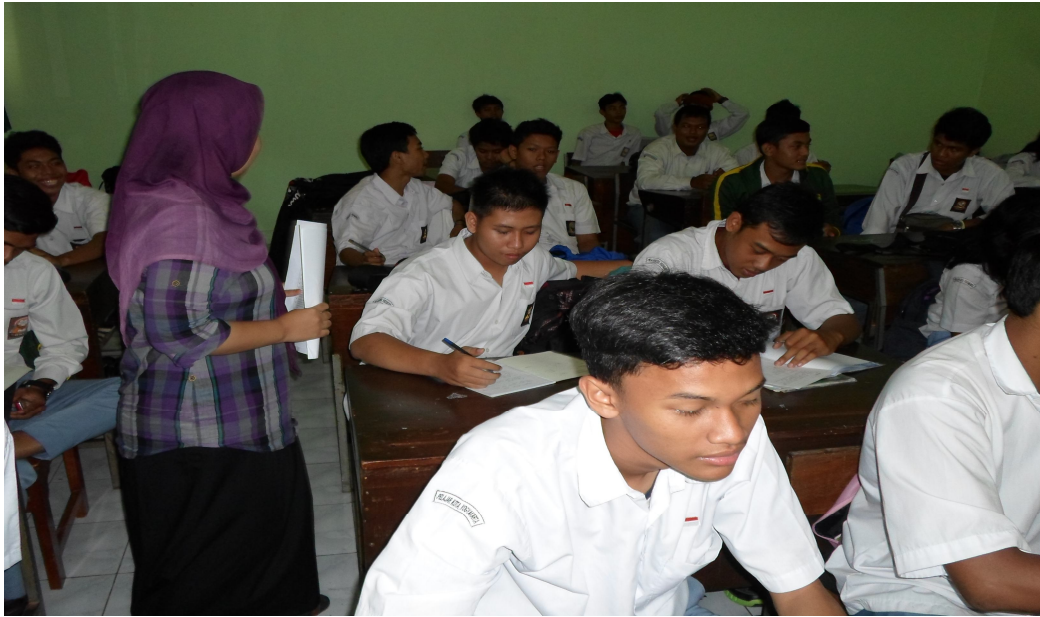
Siswa mendengarkan penjelasan materi oleh guru (peneliti)