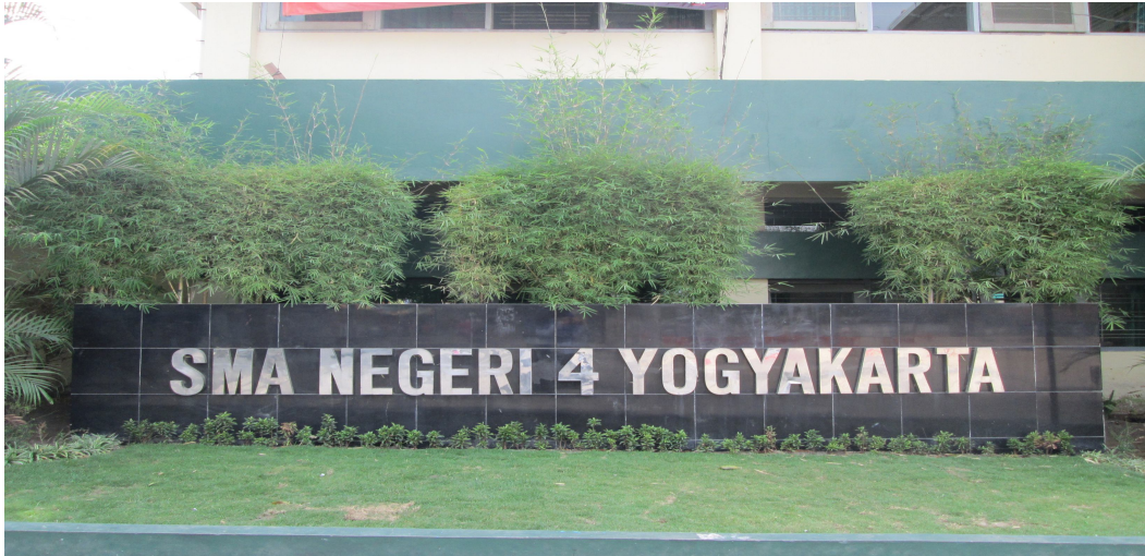
Bagian depan SMA Negeri 4 Yogyakarta