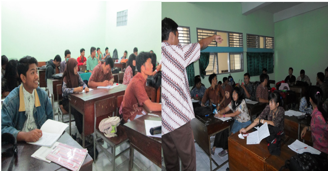
Siswa memperhatikan penjelasan materi guru dan uraian temanya