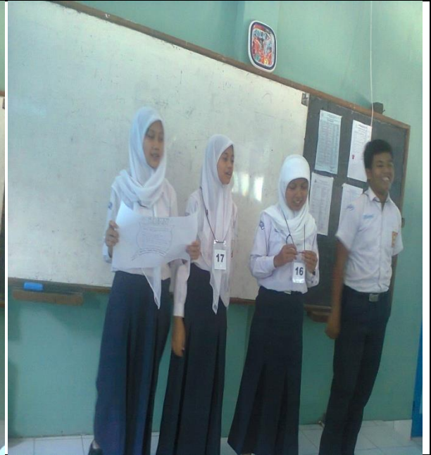
Siswa mempresentasikan hasil diskusinya