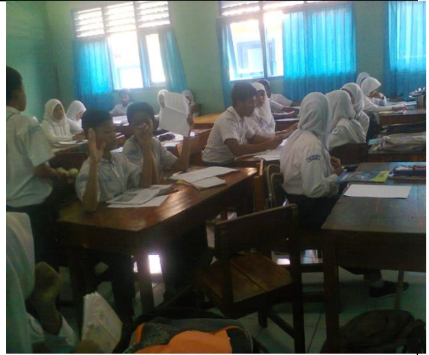
Pembagian kelompok dan pemberian tugas atau proyek