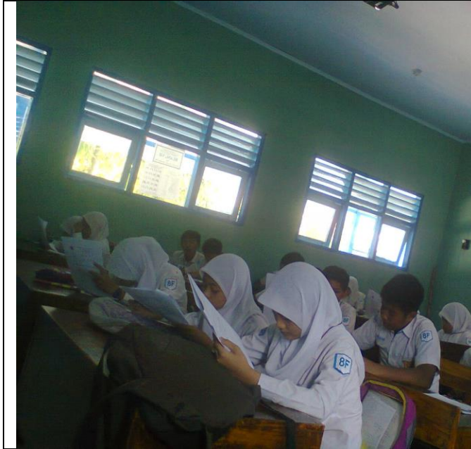
Siswa sedang mengerjakan posttes dan angket