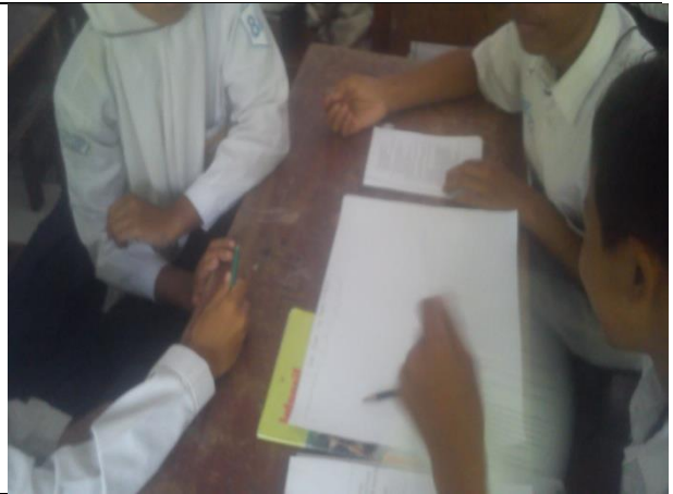
Siswa berdiskusi dalam kelompok besar