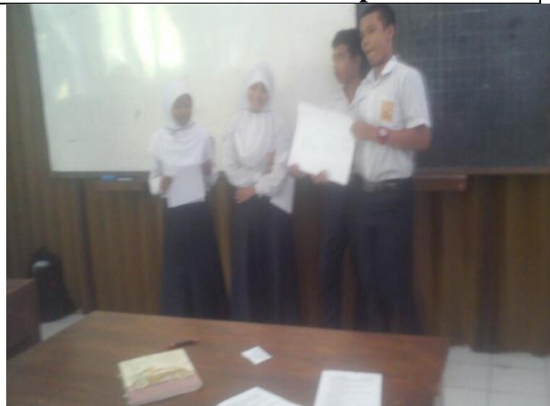
Siswa sedang mempresentasikan hasil dikusinya dengan peta konsep