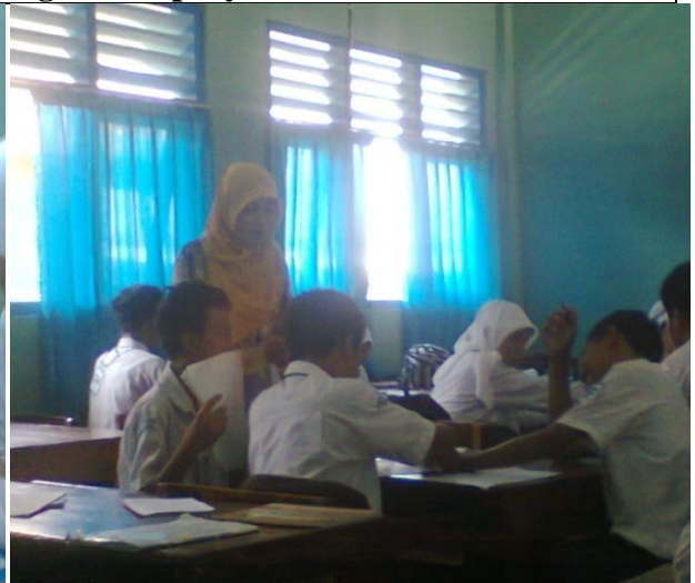
Siswa melakukan diskusi dan investigasi