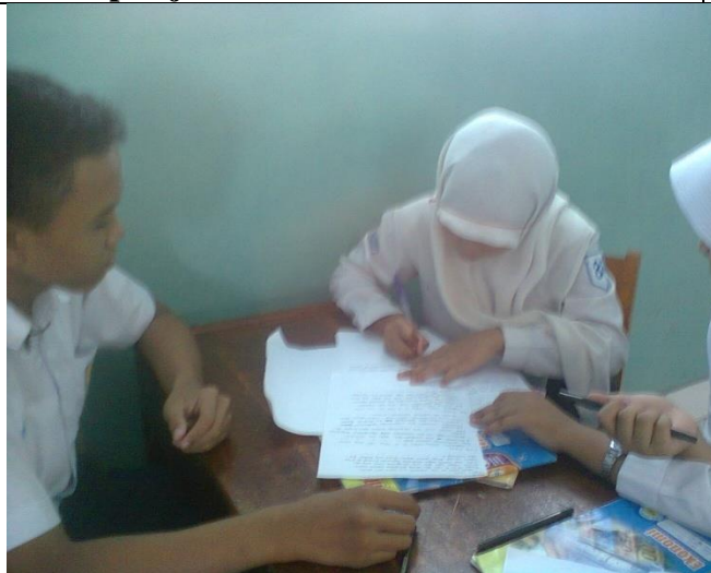
Siswa melakukan diskusi, investigasi, dan menyusun hasil investigasi