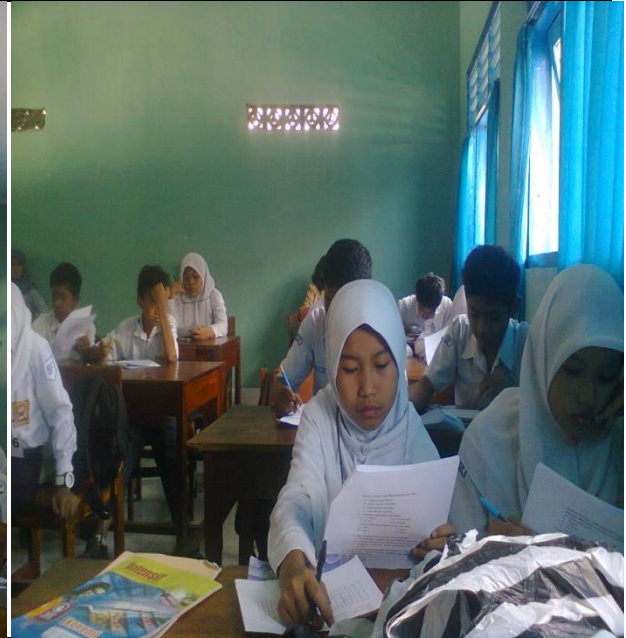
Siswa sedang mengerjakan posttest dan angket