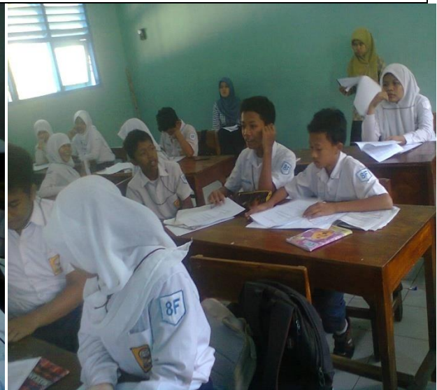
Siswa memperhatikan kelompok yang sedang presentasi