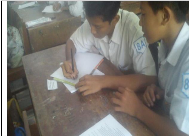
Siswa berdiskusi dalam kelompok kecil