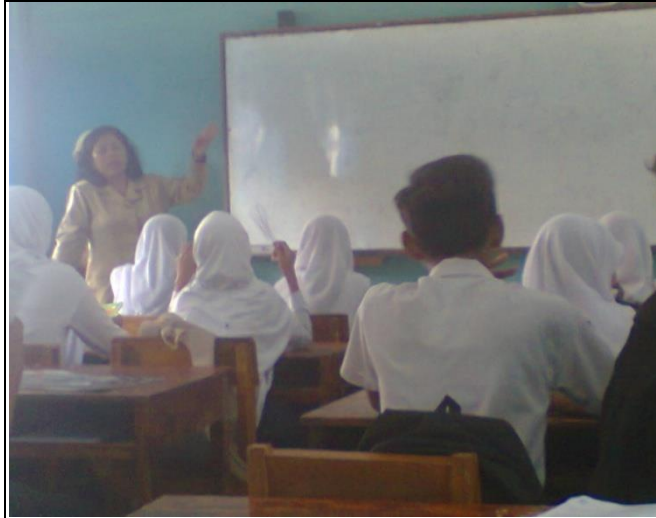
Guru sedang menjelaskan sekilas tentang materi pelajaran