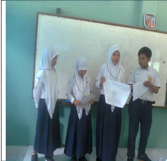
Siswa mempresentasikan hasil diskusinya