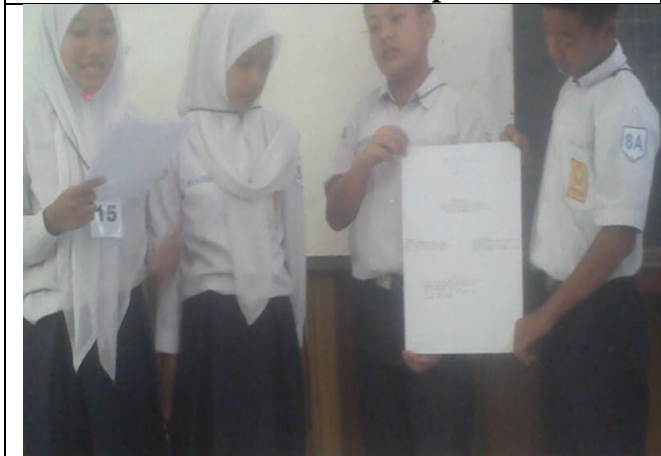
Siswa sedang mempresentasikan hasil dikusinya dengan peta konsep