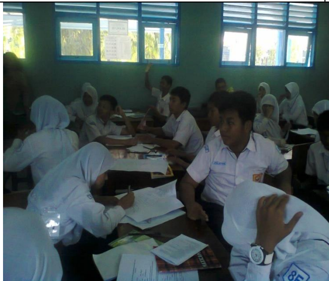
Beberapa siswa aktif mengajukan pertanyaan kepada kelompok yang presentasi