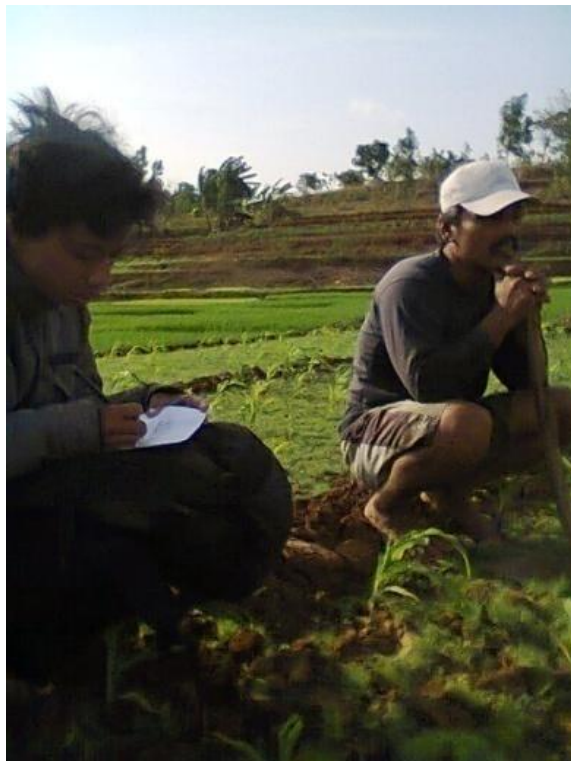
Gambar 5. Wawancara dengan Petani