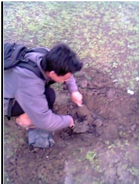
Gambar 6. Pengambilan Sampel Tanah