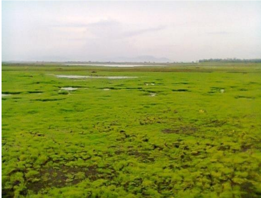
Gambar 3. Lahan Pasang Surut di Waduk Gajah Mungkur Kecamatan Wuryantoro Kabupaten Wonogiri