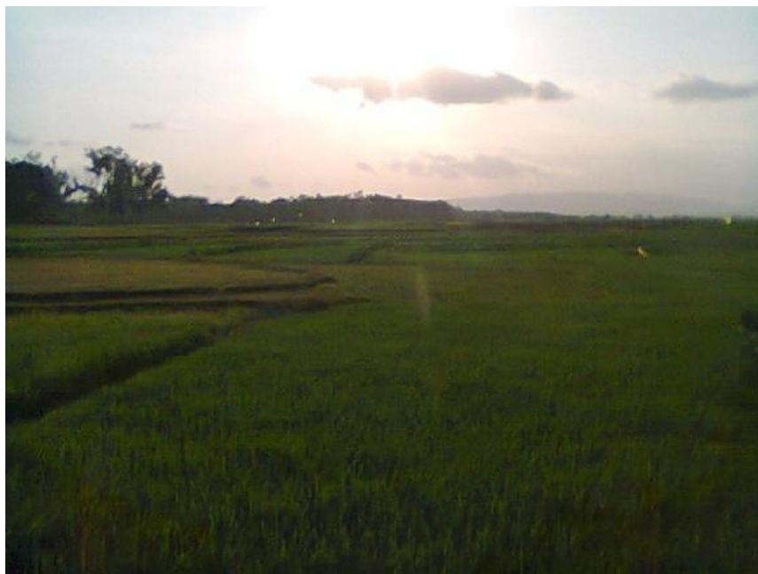
Gambar 4. Pertanian Tanaman Padi Lahan Pasang Surut di Waduk Gajah Mungkur Kecamatan Wuryantoro Kabupaten Wonogiri