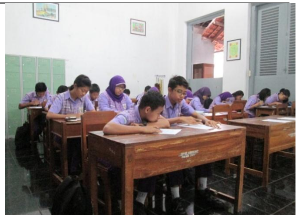
Gambar 6. Siswa Mengerjakan Posttest dan Angket