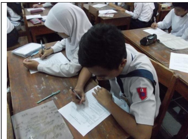
Gambar 5. Siswa Mengisi Angket Sebelum Perlakuan dan Sesudah Perlakuan