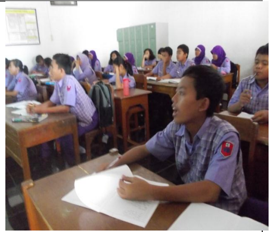
Gamabar 2. Siswa mendengarkan penjelasan dari guru