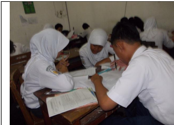
Gambar 3. Siswa sedang Menjelaskan Hasil Ringkasannya Kepada Temannya