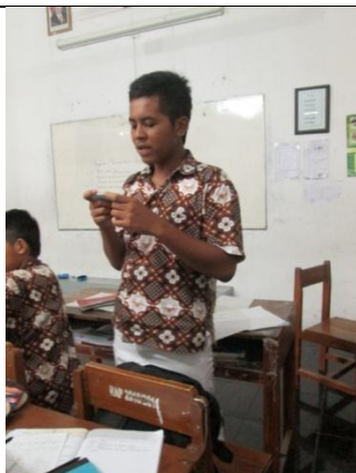
Gambar 5. Siswa Menjawab Pertanyaan dengan Menggunakan Kartu Menjawab