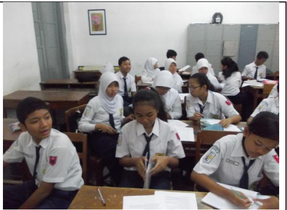
Gambar 2. Pembentukan Kelompok