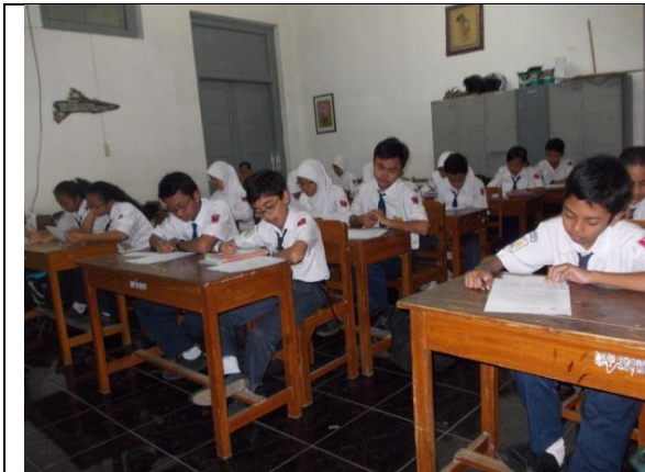
Gambar 1. Siswa Mengerjakan Pretest dan Angket