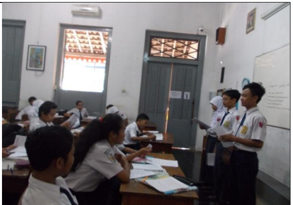
Gambar 4. Siswa sedang Presentasi di Depan Kelas