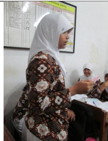
Gambar 4. Siswa Bertanya dengan Menggunakan Kartu Bertanya