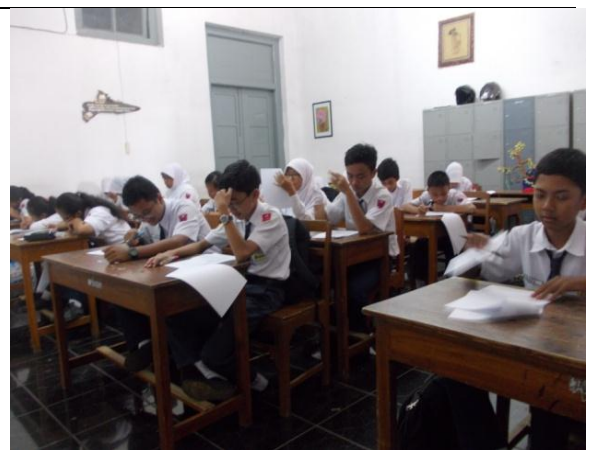
Gambar 6. Siswa Mengerjakan Posttest dan Angket