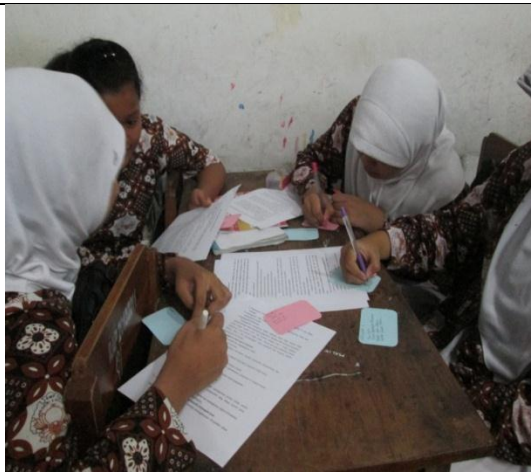
Gambar 3. Siswa sedang Menjelaskan Kepada Siswa yang Lain tentang Apa yang mereka temukan dalam Tugas yang Mereka Dapatkan