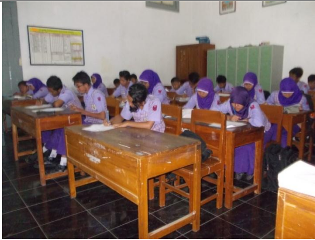
Gambar 1. Siswa Mengerjakan Pretest dan Angket