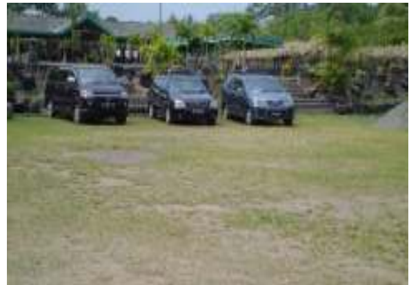
Kondisi Tempat Parkir