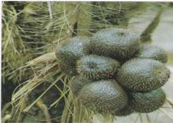
Salak Pondoh Merah Hitam