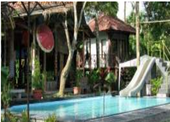
Lokasi Banyu Sumilir