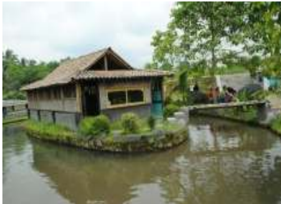
Lokasi Rumah Makan