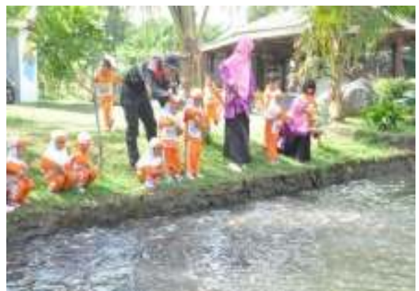
Aktivitas Memberi Makan Ikan