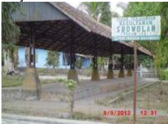
Lokasi Pasar Perjuangan Srowolan