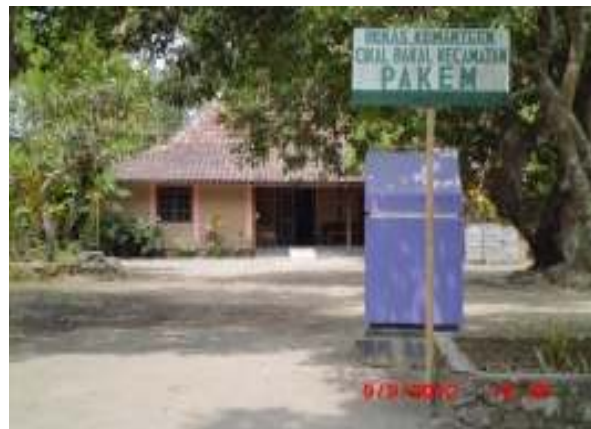
Lokasi Bekas Kecamatan Pakem