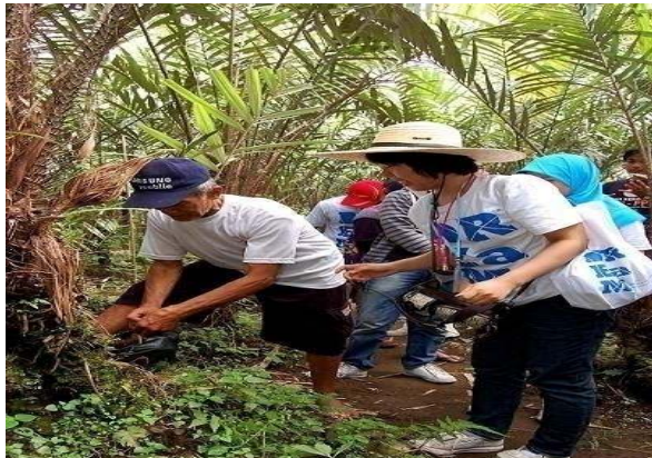
Aktivitas Wisata Berkebun Salak