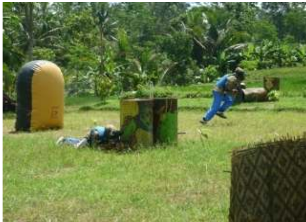
Aktivitas Permainan Paintball