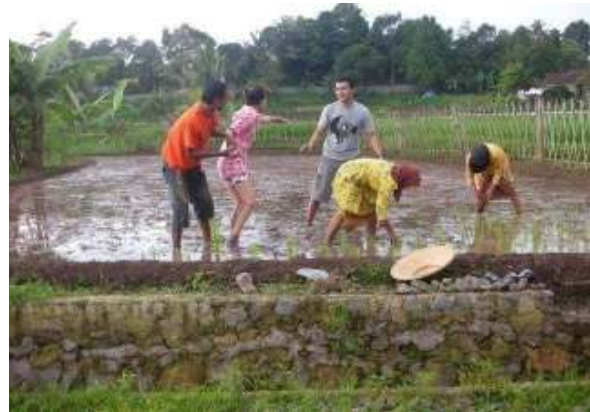
Aktivitas Belajar Perikanan