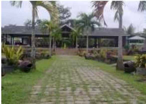
Lokasi Tempat Pertemuan (Aula) I