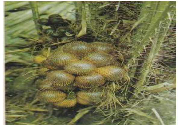
Salak Pondoh Kuning