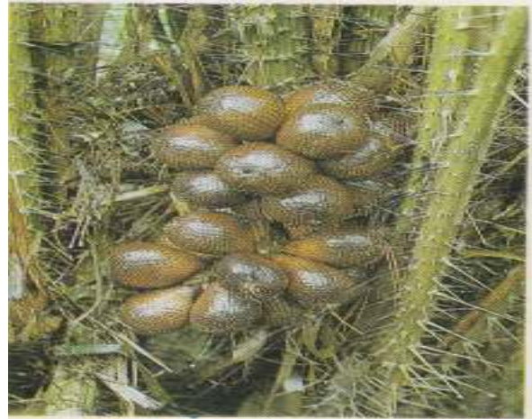
Salak Pondoh Merah