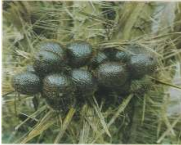
Salak Pondoh Hitam