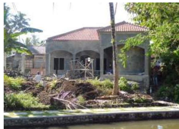
Proses Pembangunan Penginapan