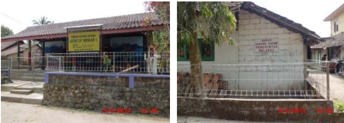
Muka Depan dan Belakang Lokasi Gudang Garam