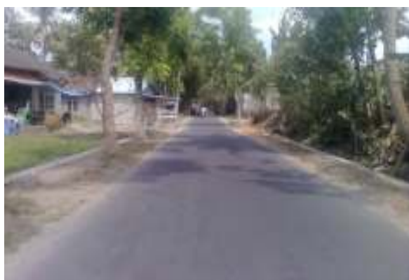
Kondisi Jalan Menuju ke Karangasri