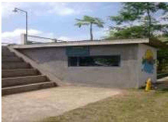
Kondisi Pusat Informasi