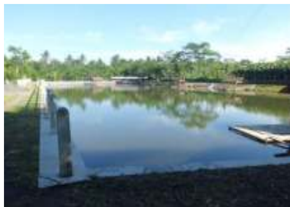
Lokasi Embung Karanggeneng