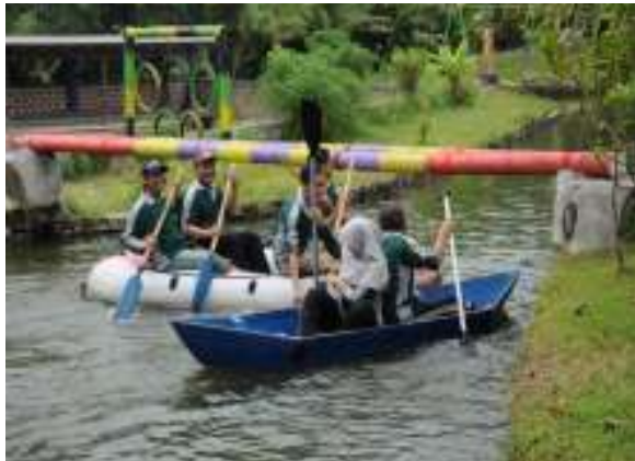
Aktivitas Wisata Tracking