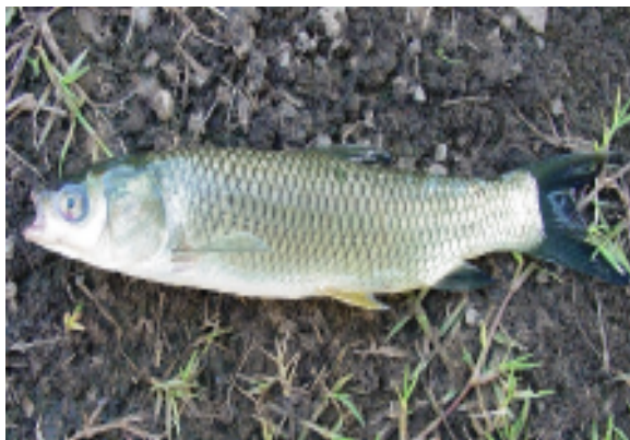
Ikan Grass Carp