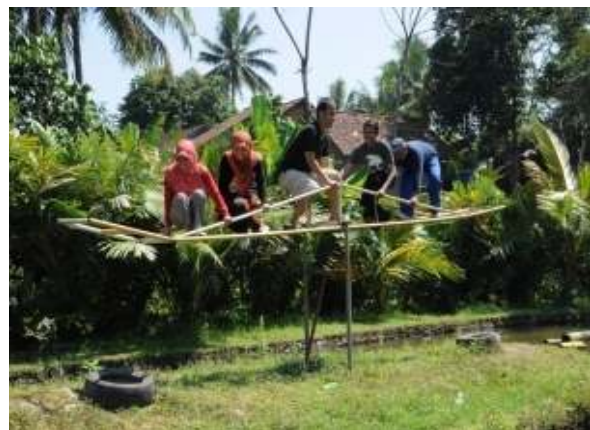
Aktivitas Permainan Outbound