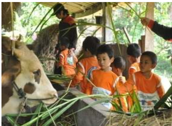
Aktivitas Memberi Makan Hewan Ternak