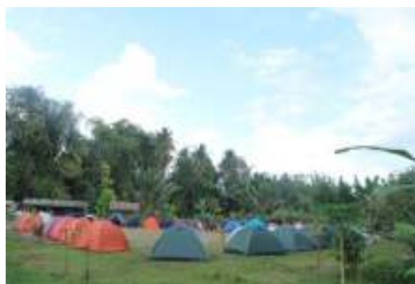
Lokasi Camping Ground