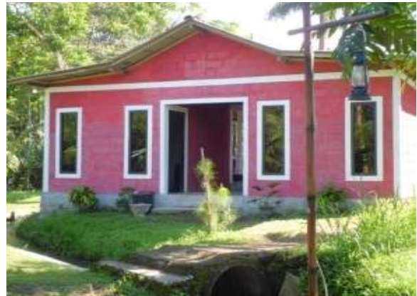
Lokasi Tempat Pertemuan (Aula) II