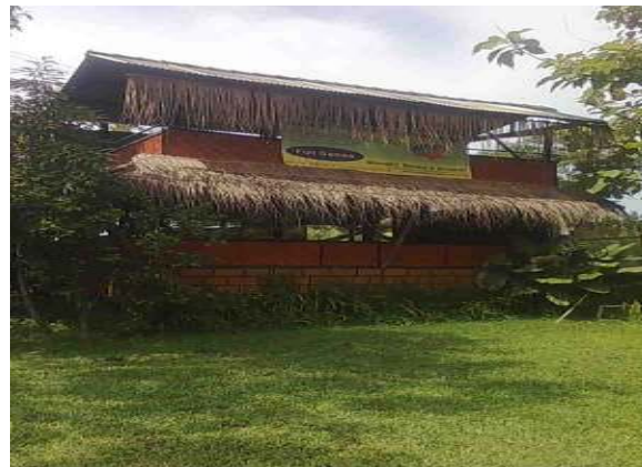
Lokasi Sahabat Alam (Shaba)