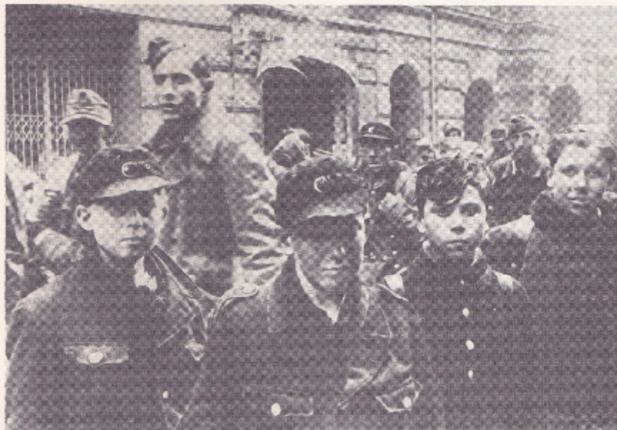
The "soldiers" of the Berlin defense, aged between 12 and 15, photographed after capture. This picture was released to the author by the Russians. Below, the Volkssturm Home Guard, some in their seventies.