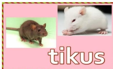
Gambar 2. Contoh kartu kata bergambar