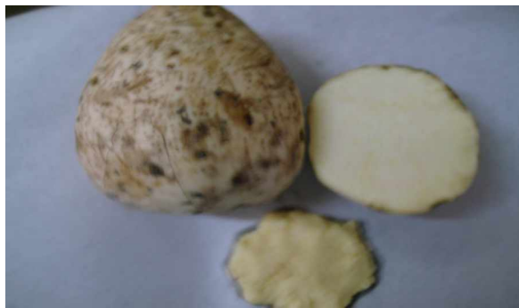
Gambar 1. Ubi jalar kuning dan penampakan permukaan daging ubi.

Warna makanan disebabkan oleh pigmen alam atau pewarna yang ditambahkan. Pigmen alam mencakup pigmen yang sudah terdapat dalam makanan dan pigmen yang terbentuk pada pemanasan, penyimpanan, atau pemrosesan. Karotenoid merupakan golongan besar senyawa yang tersebar luas dalam produk yang berasal dari hewan dan tumbuhan. Pigmen ini terdapat dalam ikan dan krustasea, sayur dan buah, telur, produk susu, dan serelia. \beta -karoten yang ditemukan dalam buah dan sayur digunakan sebagai ukuran kandungan provitamin A makanan. \beta -karoten menyebabkan warna kuning muda sampai jingga. Ubi jalar mengandung \beta -karoten sehingga warna ubi jalar juga kuning muda sampai jingga. Ubi jalar yang dibuat tepung adalah ubi jalar kuning seperti dalam Gambar 1. Ubi jalar ini mempunyai kulit coklat muda tipis, dipilih yang baru saja dipanen dan segar serta kualitas baik. Daging ubi berwarna kuning kemerahan.