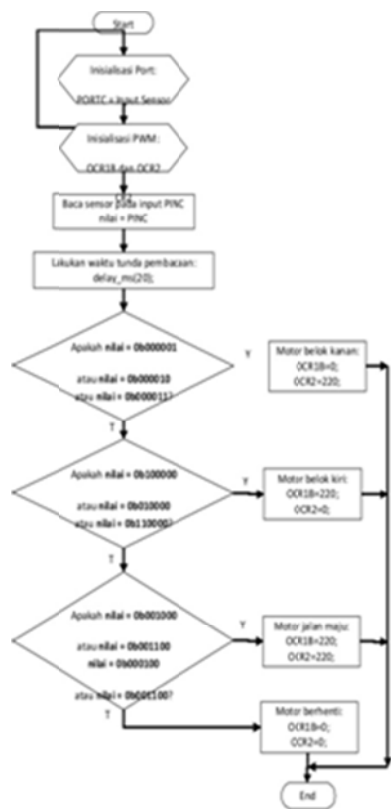
Gambar 2.Alur Flowchart